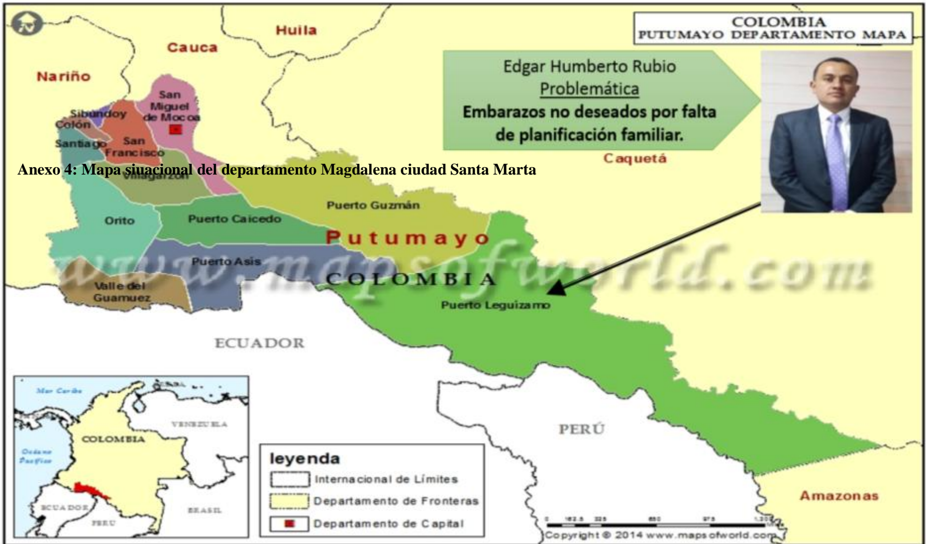
Anexo 4: Mapa situacional del departamento Magdalena ciudad Santa Marta