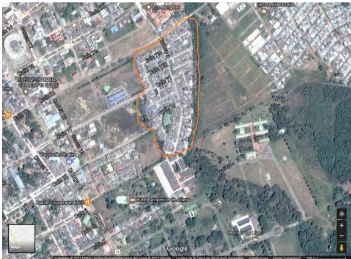
Figura 1. Delimitación geográfica en anaranjado del barro el paraíso.

El barrio el paraíso está ubicado en las inmediaciones del municipio de Granada Meta, Al norte limita con el barrio villas de Granada, al sur el basurero municipal, al oriente con el batallón 21 Pantano Vargas y al occidente con la carretera antigua vía San Martín.