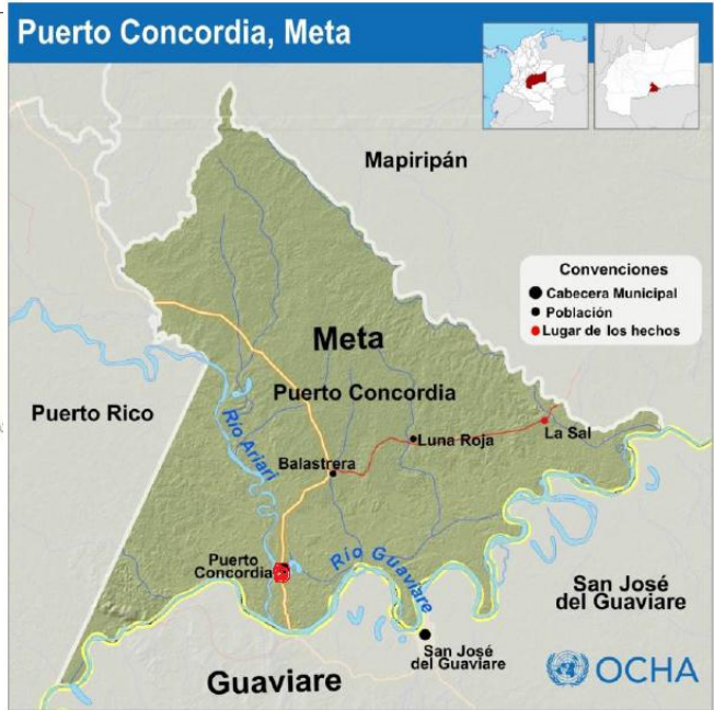
4. Mapa Municipio de Puerto Concordia - Meta