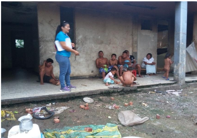
2. Presentación Propuesta, Comunidad JIW

Palabras Claves: Identidad Cultural, Gobierno Propio, Autogestión, Empoderar, Territorialidad, Discriminación, Exclusión Social,