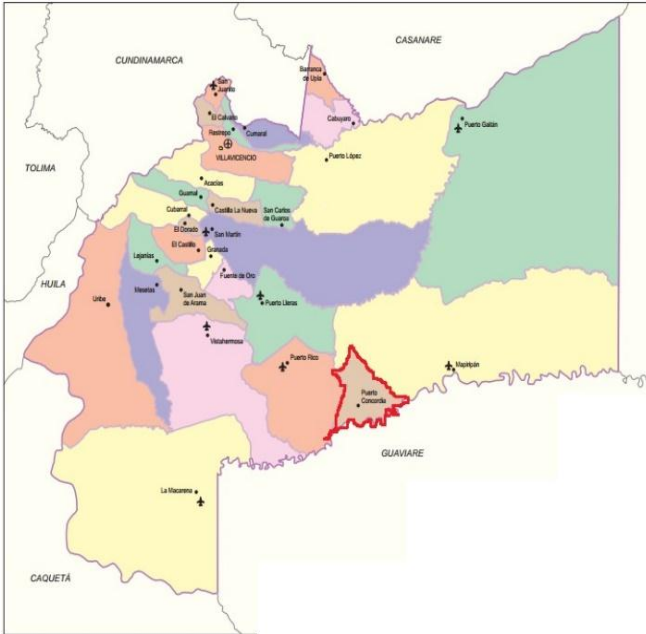
5. Mapa del departamento del Meta

La propuesta de acompañamiento se ejecutó en el Departamento del Meta municipio de Puerto Concordia Meta, en el antiguo centro de salud, ubicado en el barrio el diamante