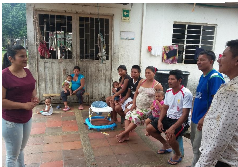
3. Taller sobre empoderamiento – Comunidad JIW Zaragoza 5