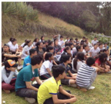
Salida pedagógica (27/10/2017)