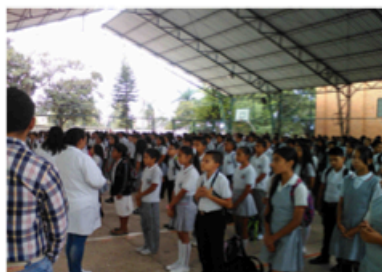
Celebración Eucarística (27/06/2017)