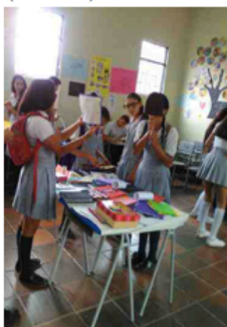
Muestras académicas (04/10/2017)