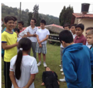
Salida pedagógica (27/10/2017)