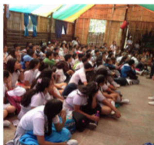
Salida pedagógica (27/10/2017)