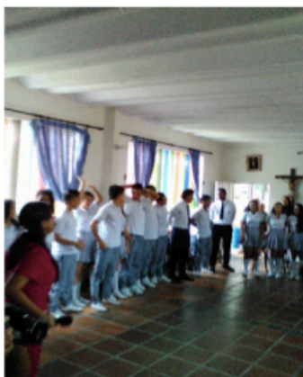
Visita al ancianato (30/03/2017)