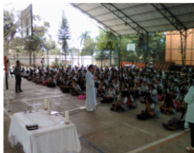
Celebración Eucarística (27/06/2017)