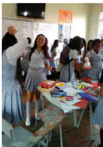
Muestras académicas (04/10/2017)