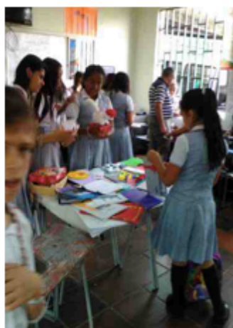
Muestras académicas (04/10/2017)