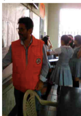
Muestras académicas (04/10/2017)