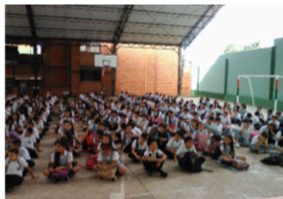
Celebración Eucarística (27/06/2017)