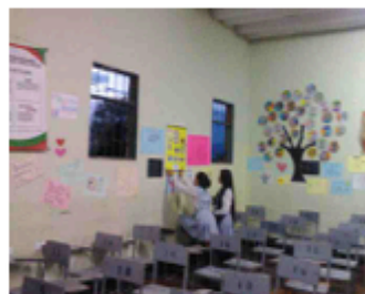
Muestras académicas (04/10/2017)