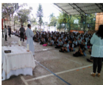
Celebración Eucarística (27/06/2017)