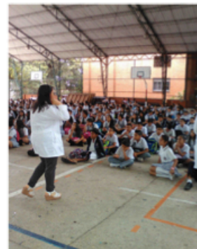
Celebración Eucarística (27/06/2017)