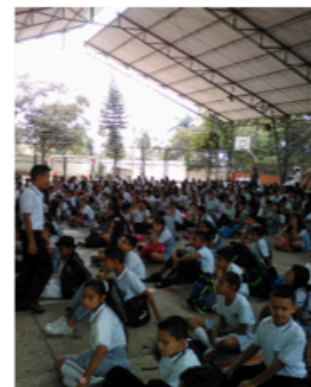
Celebración Eucarística (27/06/2017)