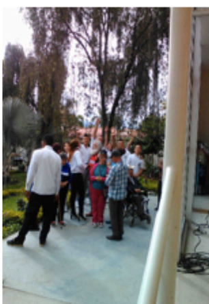
Visita al ancianato (30/03/2017)