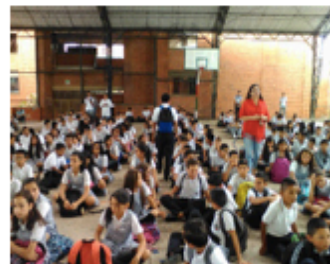
Celebración Eucarística (27/06/2017)