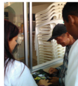
Visita al ancianato (30/03/2017)