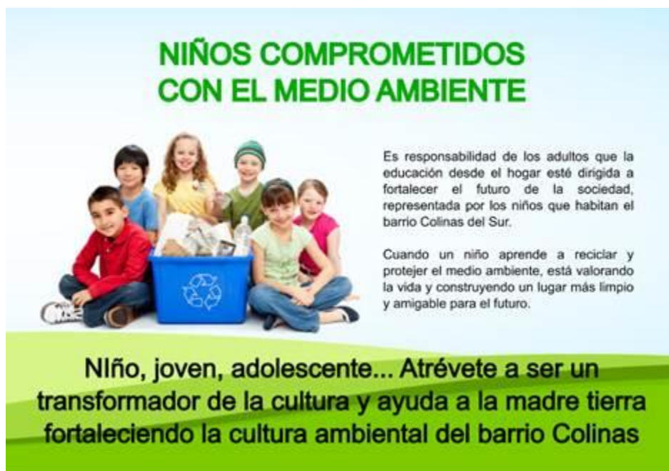
Figura 2. Afiche para comunicar a los niños