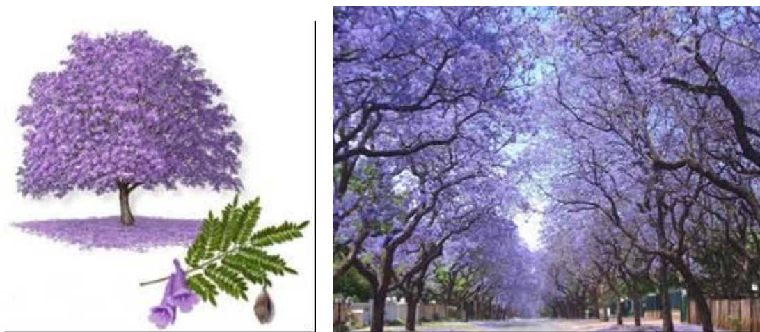
Figura 3. Gualanday ( jacaranda caucana )