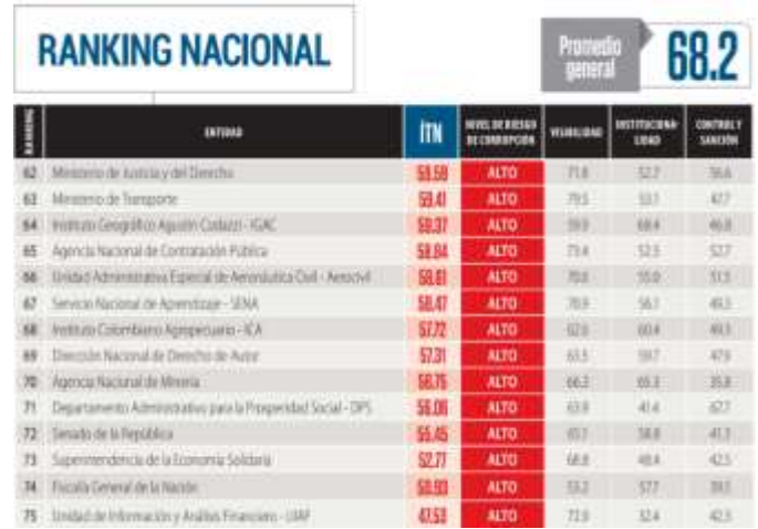
Fig. 6 Ranking Nacional Índice de Transparencia, Corporación Transparencia por Colombia

de manera directa los resultados del PIB y el gasto público dentro del gobierno; permitiendo que se reduzca sustancialmente los dineros en inversión dentro del país; afectando en muchas ocasiones la creación de nueva infraestructura que permite el intercambio de bienes y servicios.