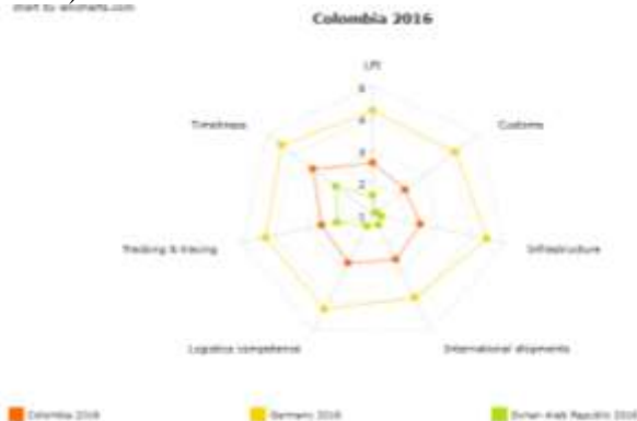
Fig. 2 Comparación de países.

Para el caso colombiano, la posición que ostenta el país dentro de una lista de 160 países es de 94 a nivel mundial y ocupando uno de los últimos lugares por debajo de Argentina (puesto 66), Perú (puesto 69) y Ecuador (puesto 74) dentro de los países suramericanos, a pesar de contar con posibilidades de expansión enorme por su posición estratégica territorialmente hablando (uno de los pocos países con salidas a ambos océanos).