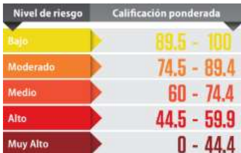
Fig. 5 Nivel de riesgo de corrupción, Corporación Transparencia por Colombia

Cabe anotar que según la Corporación Transparencia por Colombia, para esta medición tuvo en cuenta una ponderación diferente para cada uno de los ítems que compone el indicador, también una clasificación de riesgo dependiendo del índice de transparencia resultante.