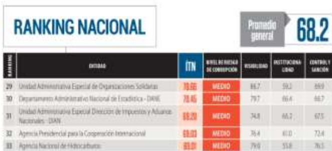
Fig. 4 Ranking Nacional Índice de Transparencia, Corporación Transparencia por Colombia

soportando en mayor parte la relación encontrada por el CECIP, donde se evidencia que Aduanas y Envíos Internacionales tiene un gran declive en su score individual de 0,38 y 0,17 respectivamente. Sustentando una decadente afectación indirecta sobre la cuenta corriente de la balanza de pagos del país, revelando debilidad frente a otras naciones; acompañado de un mal momento de la economía mundial. No obstante, eso no difiere de la manera como las normas y políticas relacionadas a estos indicadores afectan el desempeño real de las entidades a cargo. Según la Corporación Transparencia por Colombia, los resultados mostrados en el marco temporal de 2015-2016, en su informe Índice de Transparencia Nacional [4], posiciona a la DIAN 3 en el puesto 31 dentro de un grupo de 75 entidades a nivel nacional donde su nivel de riesgo de corrupción es medio.