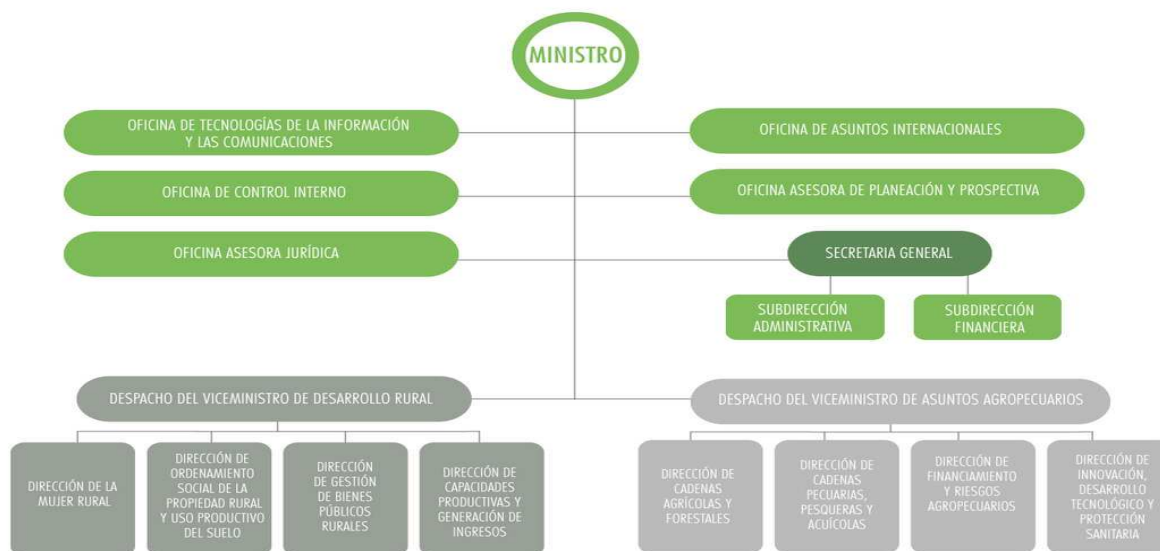
Figura 1. Organigrama del Ministerio de Agricultura y Desarrollo Rural