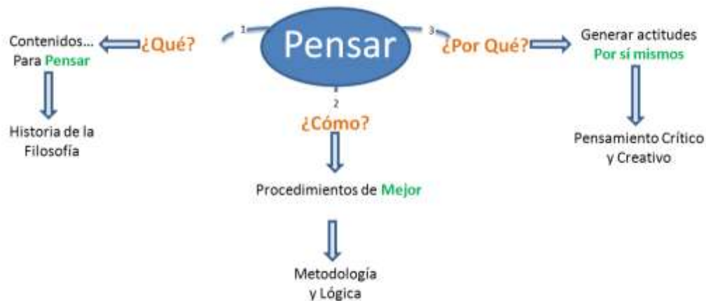
Gráfica 2: Pensar mejor por sí mismos

Veamos el siguiente esquema donde nos detalla lo que llaman “pensar mejor por sí mismos”.