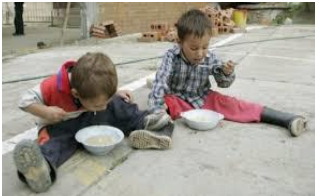
Figura 3 Situación Nutricional del municipio