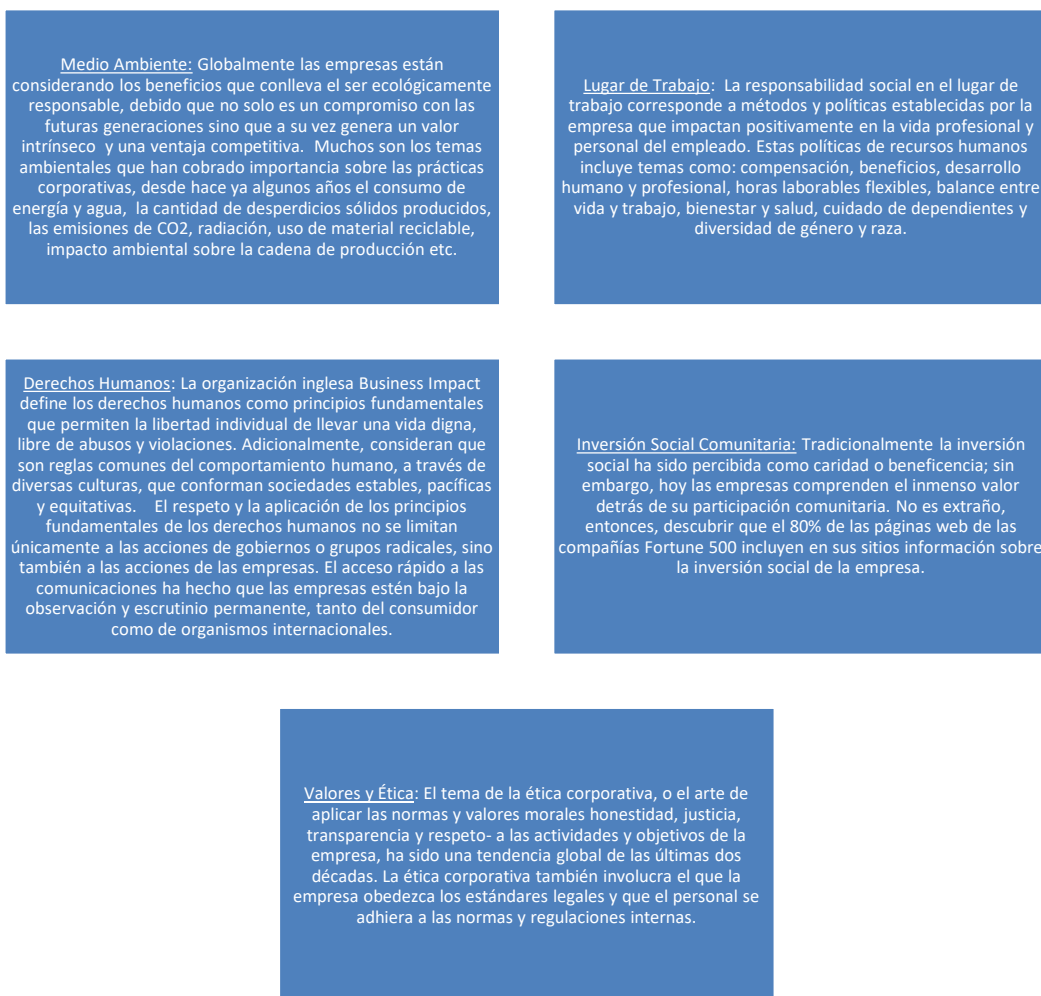
Figura 2. Valores fundamentales de la RSE