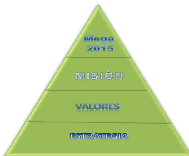
Figura 1. Resumen del pensamiento estratégico.

La generación de proyectos sostenibles dentro del ámbito empresarial debe estar guiada por los valores corporativos que han sido transversales dentro de la compañía y que sean sostenibles a través del tiempo. Es así como el servicio que se ofrece a través de acciones efectivas y a nivel de conocimientos, la construcción de equipos de trabajos óptimos y alineados y la presencia de innovación y simplicidad en el desarrollo del trabajo, han permitido la obtención de una misma carta de navegación: trabajar para que el cliente regrese, misión propia de la organización, que direcciona el rumbo de la compañía, capturar la lealtad y fidelidad de los consumidores, la preferencia de sus proveedores e incrementar el sentido de pertenencia de sus empleados y accionistas. En la figura 1, se puede observar el resumen del pensamiento estratégico.