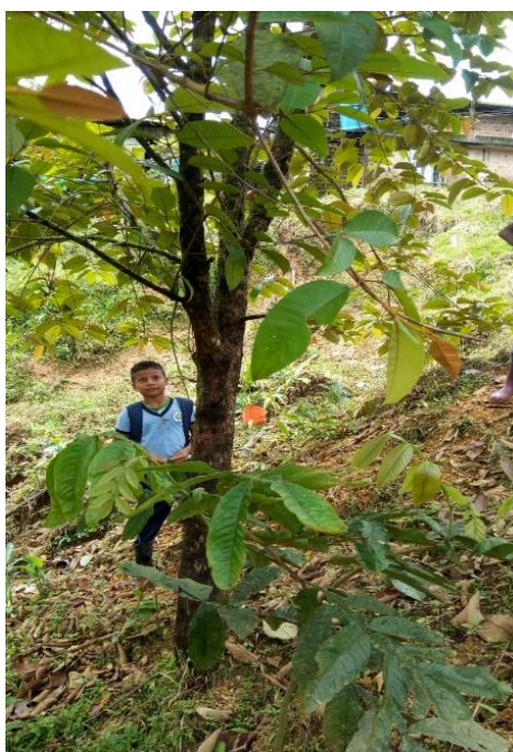
Ilustración 4 Salida de campo