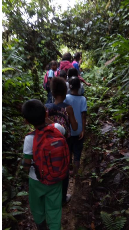
Ilustración 5 Salida de campo