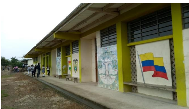
Ilustración 2 Centro Educativo Los Telembés

En la actualidad, el Centro Educativo los Telembés cuenta con cuatro aulas de clase, un comedor escolar, tres baterías sanitarias, un patio, sala de informática y un salón múltiple. La planta física está integrada por ocho docentes, cuatro con nombramiento en propiedad y cuatro en provisionalidad, en el registro de matrícula se cuenta con 164 estudiantes de los grados preescolar a noveno, la mayoría de estudiantes son de comunidad Indígena, pero también se atiende a niños y niñas pertenecientes a la etnia afro del Consejo Comunitario Nueva Esperanza. En el Centro Educativo no se cuenta con algunos servicios básicos como, luz eléctrica, agua potable y acceso a internet. El centro educativo se encuentra en una zona muy lluviosa, el clima predominante es húmedo tropical.