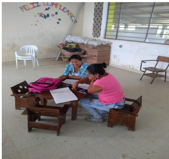
Ilustración 3 Entrevista a Madre de Familia