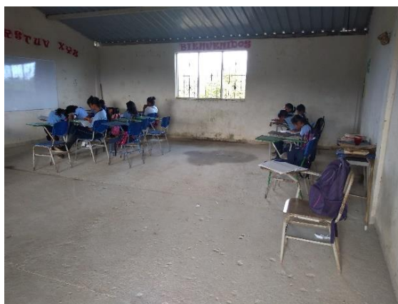
Ilustración 6 Trabajo con niños y niñas