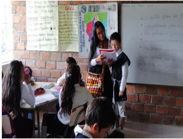
Figura 8. Lectura de la leyenda El Volcán Doña Juana

El recurso etnopedagógico fue acogido por los estudiantes.