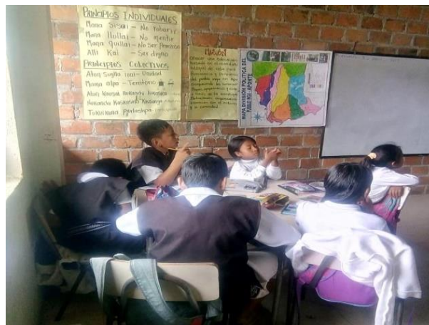
Figura 1: Estudiantes del grado quinto en el aula de clases

Todos estos saberes o temas fueron tenidos en cuenta a la hora de desarrollar e implementar los cuatro planes de aula que fueron trabajados semanalmente, durante 8 horas en el área de Identidad cultural (español).