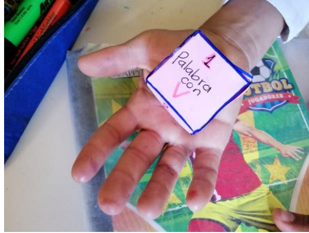
Figura 6. Ejercicio de ortografía