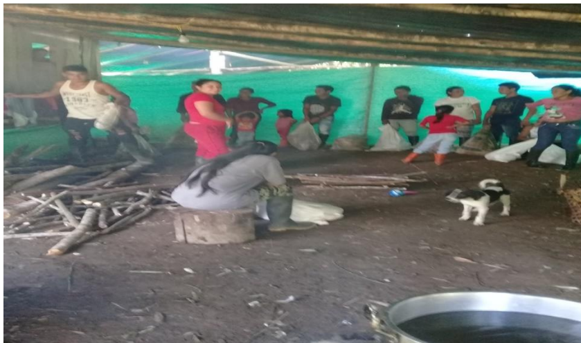
Figura 5. Aprendiendo educación propia

Aprendiendo educación propia: En la familia, cuando escuchamos a nuestros taitas, para aprender valores y pervivir en el tiempo