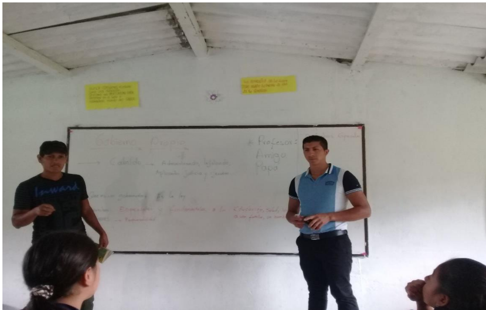
Figura 2. Salón de clases con sabedor, docente y guaguas

Gobierno propio: es una organización representada por personas honorables y avaladas por los habitantes del territorio para dirigir, organizar, controlar y ejecutar los destinos del territorio.