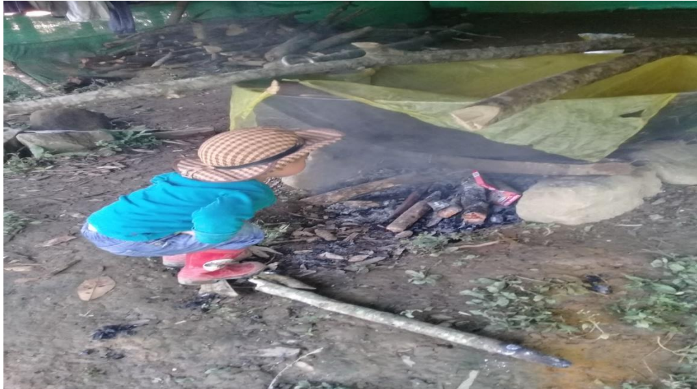
Figura 6. Aprendiendo desde el fogón