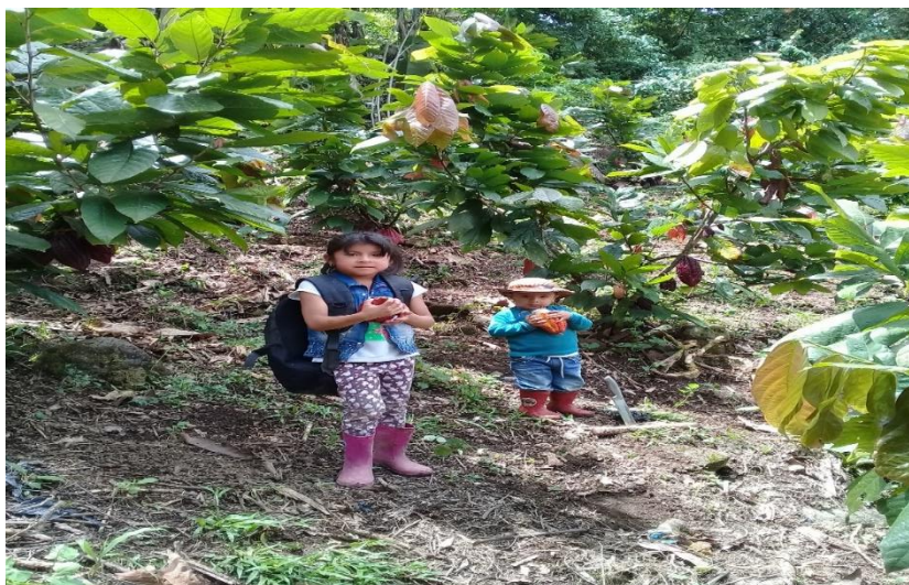
Figura 7. Aprendiendo desde el territorio

En el territorio aprendemos a conocer la delimitación territorial, la fauna, la flora, cuencas hidrográficas, medicina natural, la historia, fases lunares de siembra, chagra, organizarlo conservarlo, a leer y escribir desde la oralidad