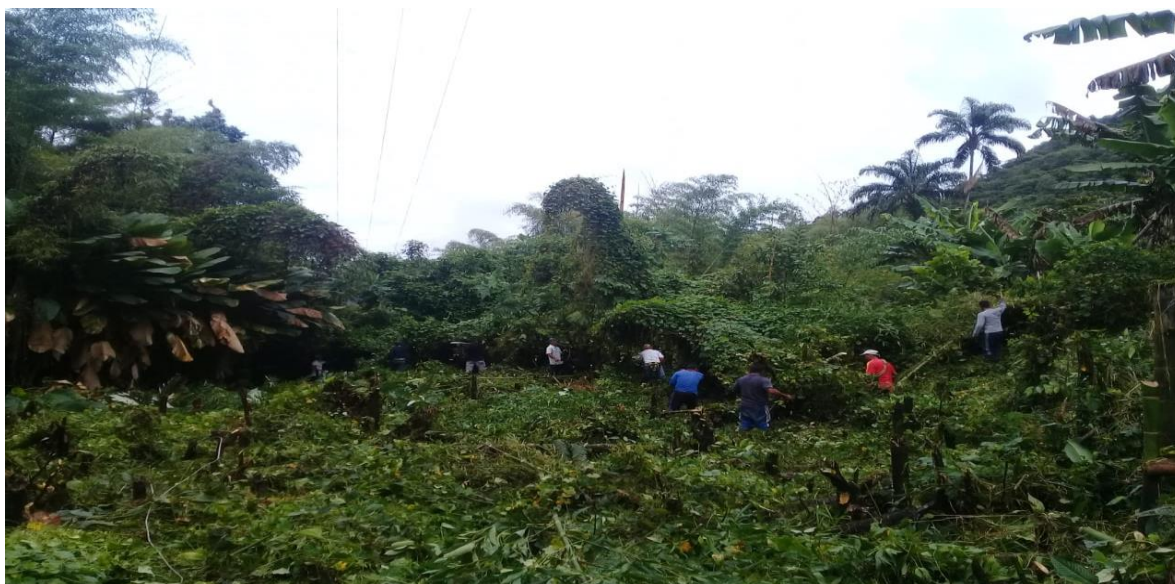
Figura 10. Protección del territorio

Protección del territorio: Se protege el territorio delimitando los linderos con los resguardos vecinos, protegiendo las fuentes hídricas, las zonas de reserva, no contaminando con residuos sólidos ordinarios y residuos peligrosos