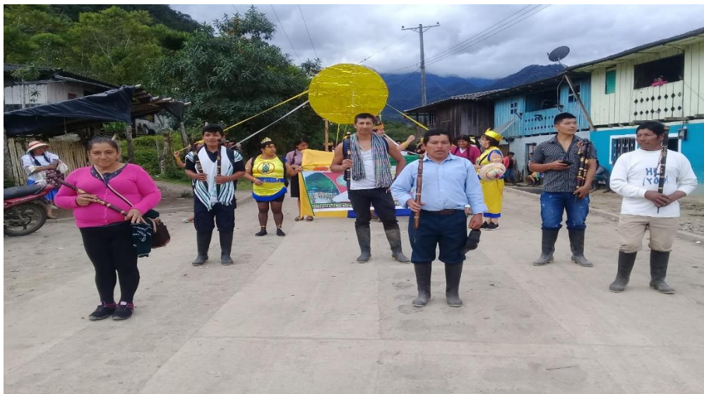
Figura 12. Máxima autoridad del resguardo