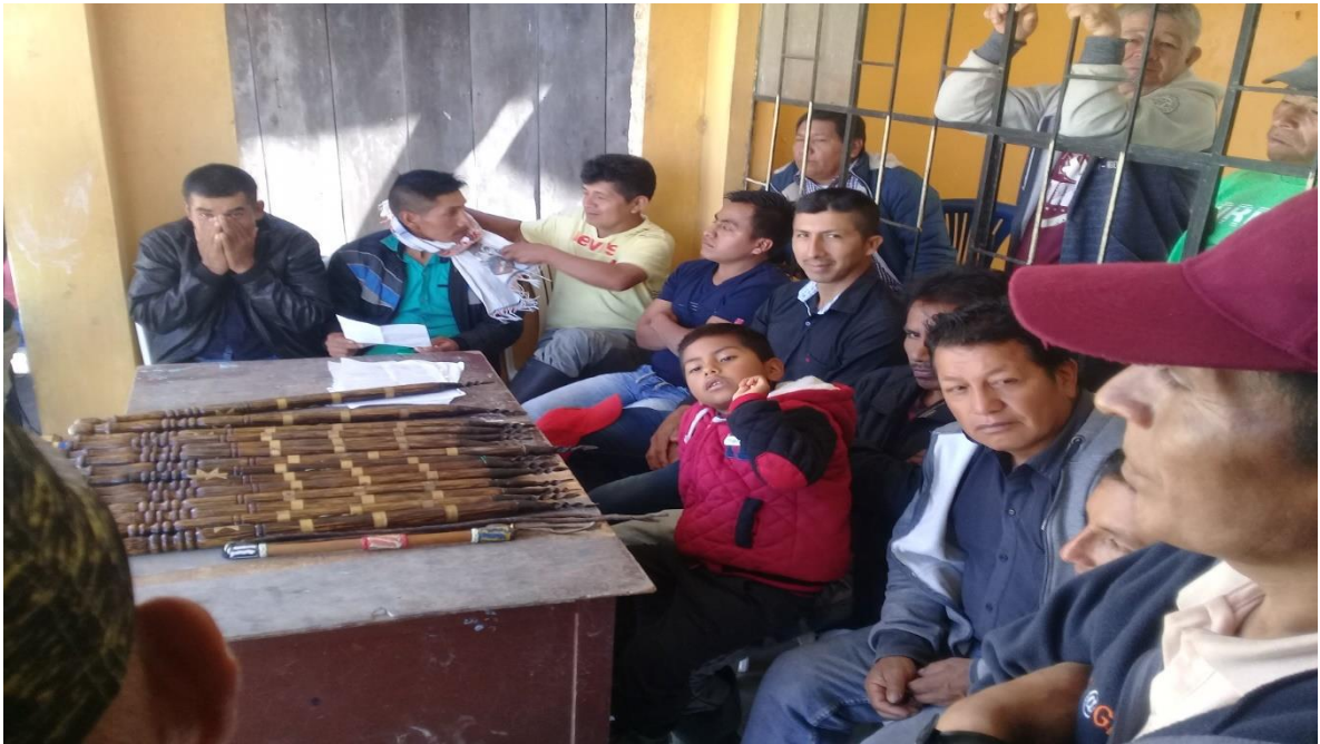
Figura 11. Organización máxima autoridad del resguardo

Organizaciones de la máxima autoridad del resguardo: esta organizada por gobernador, presidente, vicepresidente, gobernador suplente, alcalde, regidor principal, regidores veredales y secretario.