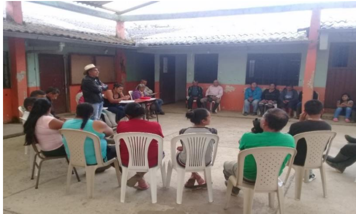
Figura 8. Mingas de pensamiento