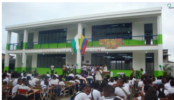
Figura 6. Los jóvenes presentan una obra teatral