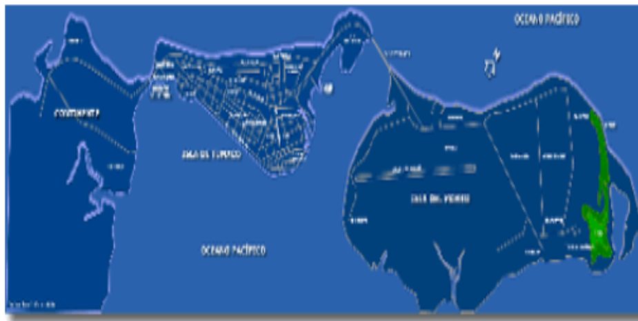
Figura 2. Mapa de las Islas de Tumaco, El Morro y la Viciosa

Con respecto a la historia de Tumaco, según Leusson (1999):