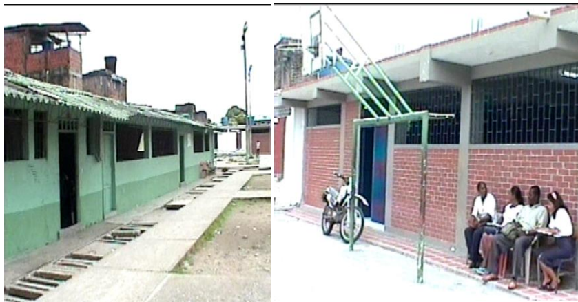
Figura 3. Antigua y moderna infraestructura de la Sede General Santander