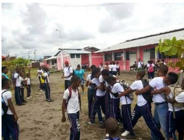
Figura 5. Los juegos orales, experiencia de aprendizaje

- Taller No. 2: “Recopilación de elementos propios de la oralidad afrotumaqueña. Esta actividad, sirvió de motivación a los estudiantes para que creen y produzcan conocimientos alrededor de las ventajas de la literatura oral”: se realizó con ayuda de los estudiantes de los cursos superiores, quienes presentaron un dramatizado donde se hacía uso de versos, historias y demás elementos orales, para dar a conocer la trama de la obra: “joven dime que sí”. Esta obra fue la delicia de grandes y chicos y con ayuda de ella, se les habló de las múltiples formas que presenta la oralidad (ver figura 6).