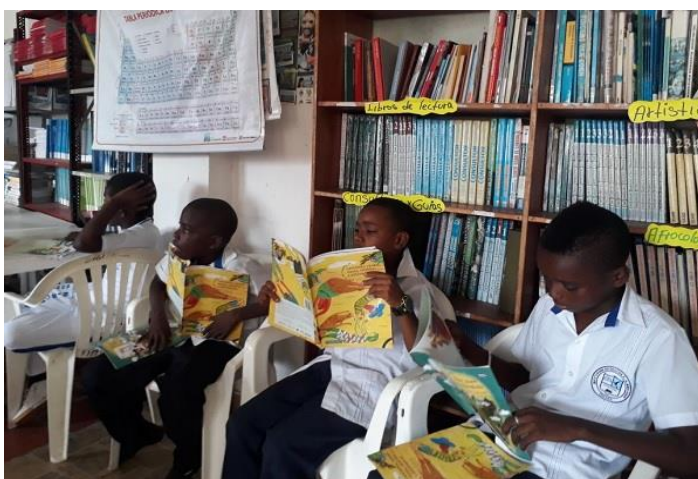
Figura 8. Los niños disfrutan de la lectura en la biblioteca