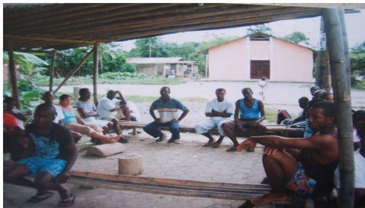
Figura 4. Los cuenteros cuentan sus experiencias

- Visitas domiciliarias con los cuenteros y copleros del municipio: se visitó a algunos de los copleros y cuenteros que existen en el municipio, con el fin de que cuenten sus experiencias sobre las coplas que componen y la razón por la cual lo hacen. El primer encuentro se realizó en el barrio Santísima Trinidad donde viven dos de ellos, para escuchar sus historias y vivencias (ver figura 4).