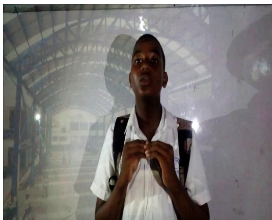
Figura 7. Los estudiantes exponen sus creaciones, en forma oral

Posteriormente, se les dejó de tarea que siguieran recopilando coplas hasta tener un cuaderno o un folleto con todas ellas. Fueron al aula a realizar las propias y con gran entusiasmo las expusieron (ver figura 7)