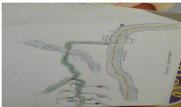
Figura 2. Ubicación geográfica del Centro Educativo Pambil