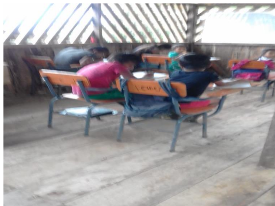
Figura 5. Actividad produciendo mi texto escrito

Socializaciones en encuentros con los mayores sabedores (narraciones de cuentos, leyendas, y otras expresiones orales del pueblo Awá).