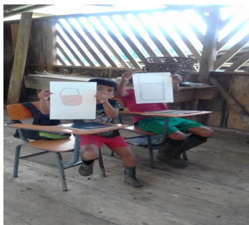
Figura 4. Dibujando y coloreando mi canasto