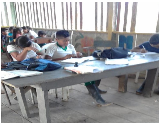
Figura 7. Producción textual, creaciones y aportes.

Cada una de las actividades que se planearon se han ido cumpliendo con los niños, obteniendo logros muy satisfactorios que sumergen a los pequeños en el mundo y riqueza de los saberes ancestrales y propios de las áreas del conocimiento, lo más importante es que se volvieron a enamorar de la lectura y escritura.