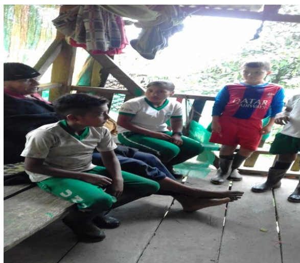
Figura 6. Abuela sabedora contando la leyenda de la llorona

Socializaciones en encuentros con los mayores sabedores (narraciones de cuentos, leyendas, y otras expresiones orales del pueblo Awá).