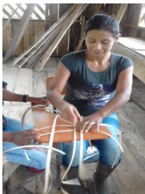
Figura 3. Empezando a leer con el canasto