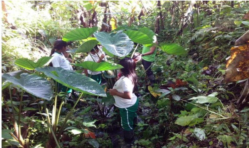
Figura 2. Estudiantes salidas de campo