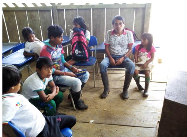
Figura 1. Entrevista a los sabedores Fuente. Esta investigación

Los estudiantes del centro educativo Guelmambi Caraño están de interés en aprender sobre las siembras y producción de las semillas ancestrales el papa cun y de igual manera los mayores y mayoras tienen sus conocimientos de saberes ancestrales de cómo realizar en la actividad cotidiana con los niños y niñas