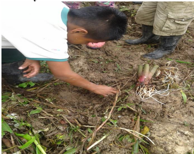
Figura 3. Estudiantes en la siembra y producción del papa cun