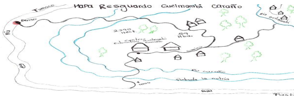
Figura 1. Ubicación geográfica comunidad Guelmambi Caraño