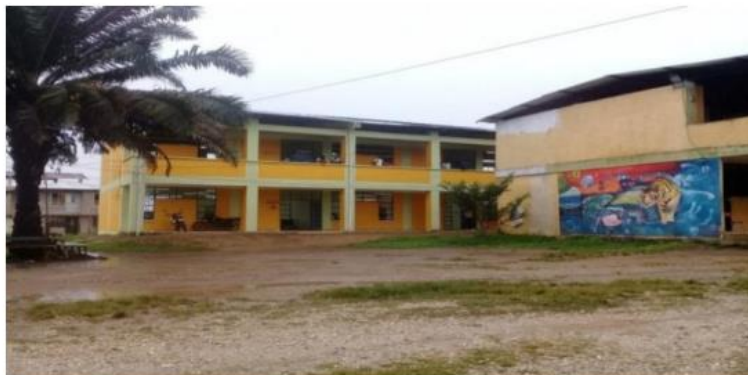
Figura 2: Institución Educativa Técnica Agropecuaria Eliseo Payán

la ejecución de proyectos de emprendimiento que le permitan aportar al etnodesarrollo de la región. (p.12)