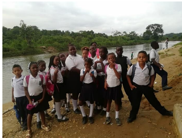
Figura 5: Estudiantes en salida de campo