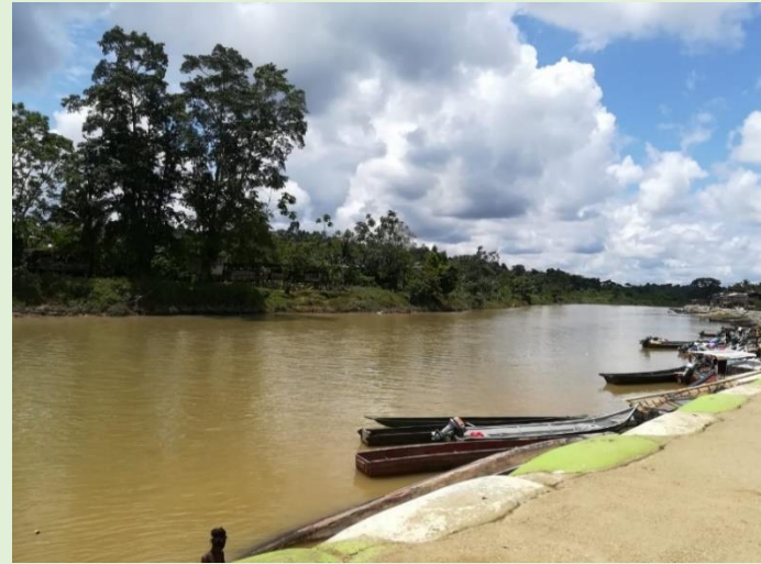
Figura 6: Pesca tradicional en el Rio Magüí Payán, como la actividad económica más importante del Municipio de Magüí Payán Payan

También se despejan dudas de los estudiantes y estos opinan diciendo que la mala acción del hombre interrumpe la buena funcionalidad de las especies animales como vegetales.