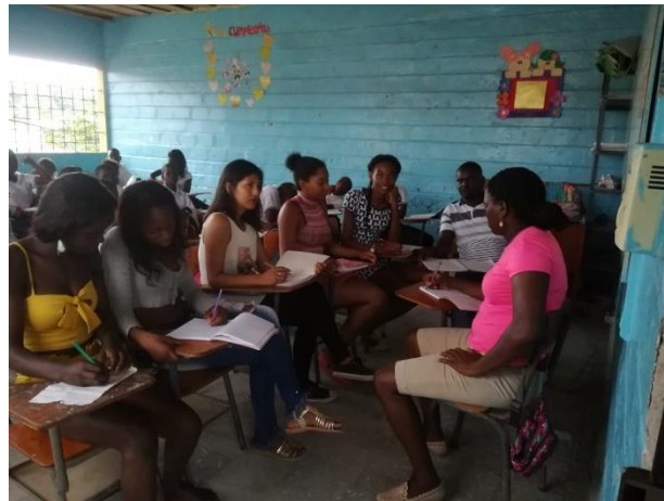
Figura 4. Docentes, estudiantes y comunidad en construcción de estrategias para la preservación de los recursos naturales

Estas actividades vincularon a la comunidad, a los estudiantes y claro está, a los docentes en una triangulación de experiencias distintas, con diferentes miradas y enfoques, pero convergentes en un solo objetivo el cual es brindar protección, conservación y preservación de los recursos naturales.