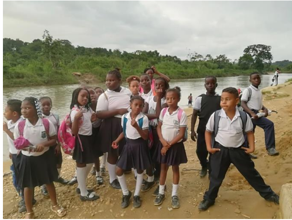
Figura 3. Estudiantes en proceso de investigación, Rio Magüí Payán