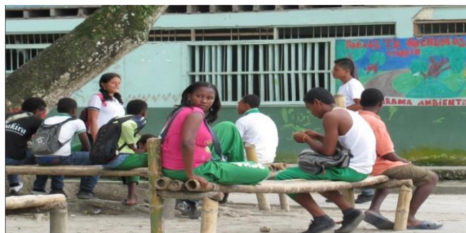
Ilustración 8 Implementación plan de aula