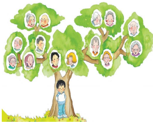
Ilustración 4 Árbol Genealógico

Quién tu Menor y pega foto o imágenes alusivas de ella.