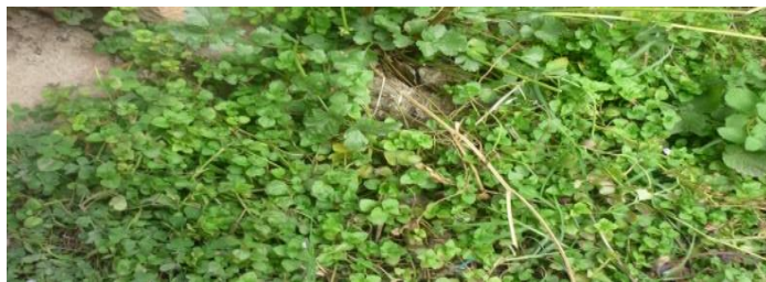
Ilustración 6 Mata de poleo

El poleo: el poleo es una hierba de hojas menudas con un aroma agradable que le da un delicioso sabor a las comidas especialmente a los sancochos de gallina.