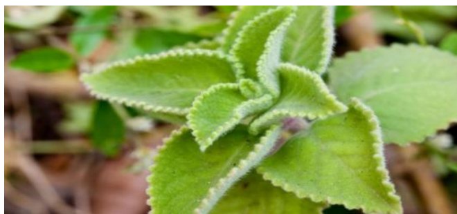
Ilustración 7 Mata de orégano

Orégano: es una especie de la familia nativa del oeste o suroeste, se usa como condimento para aliñar las comidas especialmente los sancochos de pescado, la parte que se utiliza son las hojas.