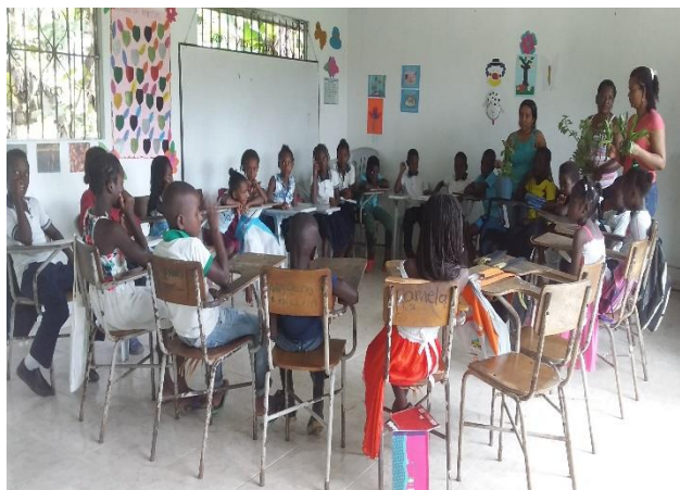
Ilustración 1 Recursos para el aprendizaje propio