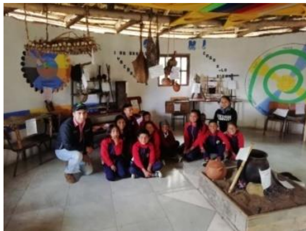
Figura 8. Grupo focal de investigación

La Institución Educativa Agropecuaria Polachayán, se ubica a las faldas del cerro el Paramillo, ofrece una educación desde el nivel preescolar hasta el grado once, que atiende a una población de 157 estudiantes, 11 docentes y 2 administrativos.(PEC, 2018)