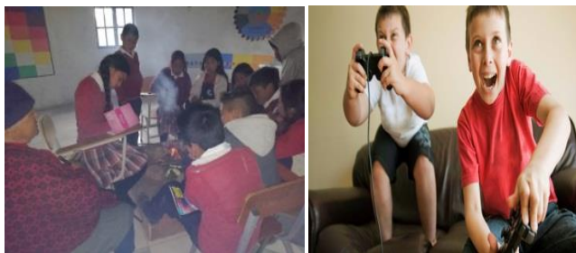
Figura 2. Evolución de usos y costumbres

Estas nuevas prácticas han permitido en gran escala que se pierda el dialogo en la familia y la comunicación entre padres e hijos y viceversa de igual manera el uso del Facebook, whatsApp, twitter y todas las redes sociales. Con esto se puede afirmar claramente el pensamiento de Albert Einstein temo el día en que la tecnología sobre pase nuestra humanidad; el mundo solo tendrá una generación de idiotas”(Luis Apperti, 2014)