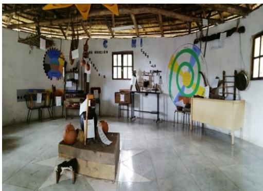
Figura 13. Panorámica del espacio pedagógico

Es por eso que hoy en día los guaguas ya no los conocían, ni los utilizaban, aun mas con la implementación de las TIC se va exterminando la identidad cultural; de tal manera que al llegar a las viviendas de la comunidad causó impacto, asombro y curiosidad al conocer estos utensilios que hicieron parte vital y fundamental del diario vivir de los mayores donde además se encuentra plasmada la sagralidad y sabiduría ancestral; es muy importante anotar que se visitaron 15 viviendas y se recolectó 45 utensilios propios los cuales se encuentran depositados en la Yachay Wasy (casa de la sabiduría ancestral) como se observa en la siguiente imagen.