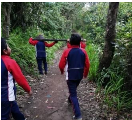
Figura 10. Estudiantes llevando los utensilios a la Yachay Wasy

Posteriormente de haber experimentado esta vivencia los utensilios propios fueron transportados por los estudiantes de grado quinto con entusiasmo ayudando a cargar cada uno de ellos, donde al realizar esta práctica se estimula positivamente la minga, el respeto, la colaboración, la solidaridad en sí los valores del ser humano. Como se observa en la siguiente imagen.