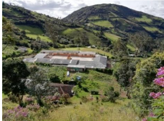
Figura 6. Contexto corregimiento de Polachayán