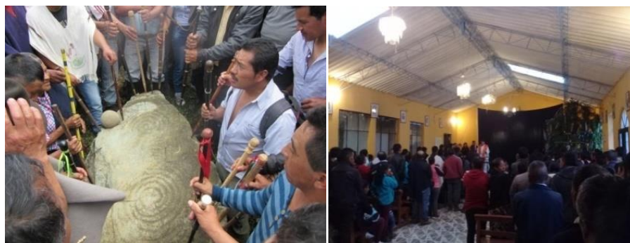
Figura 1. Comparación de creencias

Sometiendo a los mayores y a la población actual como el caso de los estudiantes del grado quinto (5°) de la Institución Educativa Agropecuaria Polachayán a utilizar aparatos modernos y a la práctica de nuevas creencias religiosas; porque el clero al mirar que se comunicaban en las lenguas maternas, realizaban sus ritos y ceremonias propias a los Dioses propios y plasmar el pensamiento cosmogónico en los espacios naturales como las rocas, entre otras; estos los castigaban y manifestaban que las costumbres, tradiciones y formas de vida ancestrales son diabólicas. Como se evidencia en la siguiente imagen que los mayores adoraban a los Dioses propios y hoy en día a causa de la religión a las imágenes religiosas.