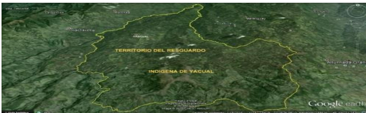
Figura 5. Mapa de Yascual

Yascual está situado sobre una colina a 2.777 metros de altura sobre el nivel mar, su temperatura es de 14 grados centígrados, a una distancia de 24 km. De la ciudad de Túquerres