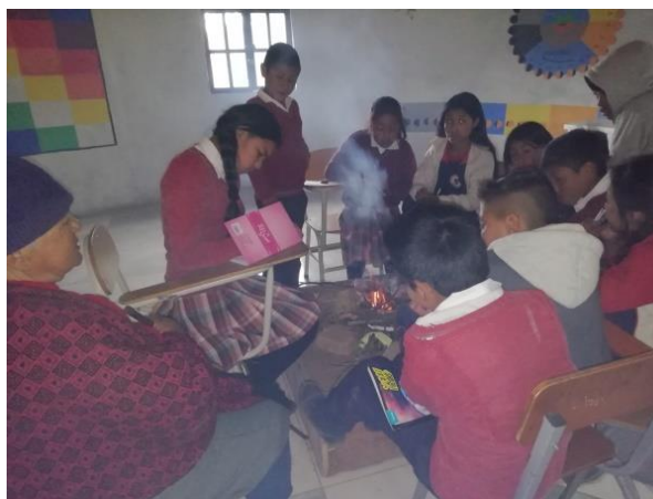
Figura 14. Estudiantes mingueando

Hoy en día es muy importante recopilar y sistematizar los saberes ancestrales que día a día se van extinguiendo, puesto que los mayores al ir desapareciendo es una biblioteca que muere y el conocimiento de ellos es irrecuperable; al realizar esta acción permitió revivir y transmitir algunos conocimientos y saberes sobre cada uno de los utensilios propios a los estudiantes del grado quinto, donde la mayor contó con interés y al mismo tiempo con nostalgia sobre su historia vivida al recordar sus padres quienes le inculcaron esos saberes y hacer uso ellos; donde además los guaguas despertaron la curiosidad e interrogantes al escuchar la importancia y el uso que se les daba a los diferentes utensilios, de igual manera realizaron preguntas para conocer más sobre el tema como lo miramos en la imagen siguiente.