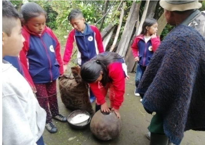
Figura 11. Estudiantes identificando utensilios