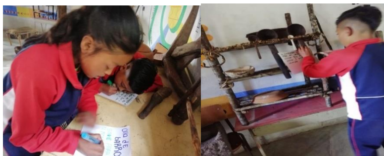
Figura 16. Estudiantes describiendo utensilios

Una vez organizado y ubicados los utensilios en su lugar correspondiente mediante la minga de trabajo y pensamiento con la mayor sabedora los estudiantes descubrieron la historia, la utilidad y la importancia de cada uno. Donde optimizaron el aprendizaje y a la vez le dieron la relevancia que se merece el conocimiento y el saber ancestral, a cada estudiante se le entregó un pedazo de cartulina para que describa lo palabreado en la minga; se encontraban inquietos de un lado a otro escogiendo cual utensilio va a describir, también hubo momentos de disgusto entre compañeros, puesto que unos querían coger los utensilios que más les llamo la atención, entre ellos el zurrón y el arado, pero aun así lo hicieron describiendo de 2 a 3 utensilios; en algunas ocasiones hacían preguntas como la ortografía y dudas que tenían con respecto al material en que estos eran elaborados, así cuando terminaron de describirlos pegaron en cada utensilio según corresponda, la esta actividad realizada ayudo a profundizar más el conocimiento ancestral y les permitió dirigirse sin confundirse de utensilio.