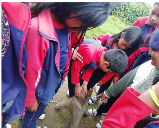
Figura 9. Estudiantes conociendo la rueca

Mediante el recorrido del territorio con visitas programadas y guiadas por los investigadores junto con el acompañamiento de los once (11) estudiantes del grado quinto de la Institución Educativa Agropecuaria Polachayán permitió el hallazgo de varios utensilios propios como la piedra de moler maíz, chumina, arado, bateas, platos de palo, cucharas, caquero, ollas de barro y la rueca entre otra acción que condujo a dar cumplimiento al primer objetivo.