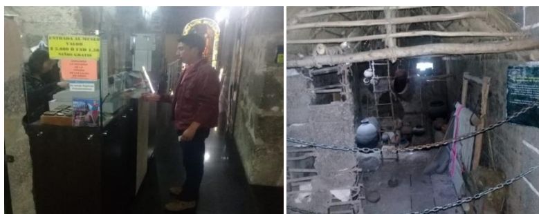
Figura 3. Museo generador de lucro y negocio

La colonización y el modernismo además de separar al indígena de su territorio, también ha contribuido negativamente a la pérdida del pensamiento e identidad cultural; ya que para el mundo occidental los utensilios propios son vistos como elementos pasivos y de exhibición en museos para generar lucro y negocio tales como la batea, el tangán, el caquero, el zumbo la piedra de moler el ají, entre otros como se puede observar en la siguiente imagen.