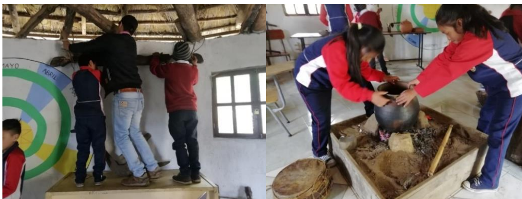
Figura 15. Estudiantes en Minga de trabajo

También se observó que los estudiantes sintieron satisfacción y alegría al escuchar que sus antepasados entre ellos los abuelos eran quienes elaboraban estos utensilios para las actividades del diario vivir herramientas que hacían parte de la ciencia y la tecnología ancestral que en la actualidad ya no se conoce sobre ello.