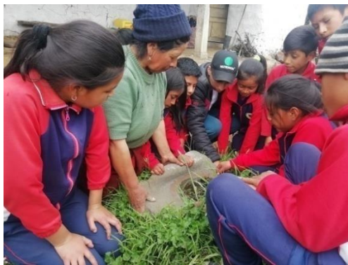
Figura 12. Estudiantes recuperando piedra de moler maíz

Es por eso que hoy en día los guaguas ya no los conocían, ni los utilizaban, aun mas con la implementación de las TIC se va exterminando la identidad cultural; de tal manera que al llegar a las viviendas de la comunidad causó impacto, asombro y curiosidad al conocer estos utensilios que hicieron parte vital y fundamental del diario vivir de los mayores donde además se encuentra plasmada la sagralidad y sabiduría ancestral; es muy importante anotar que se visitaron 15 viviendas y se recolectó 45 utensilios propios los cuales se encuentran depositados en la Yachay Wasy (casa de la sabiduría ancestral) como se observa en la siguiente imagen.