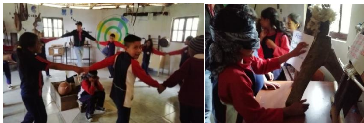
Figura 17. Estudiantes jugando y tantiando