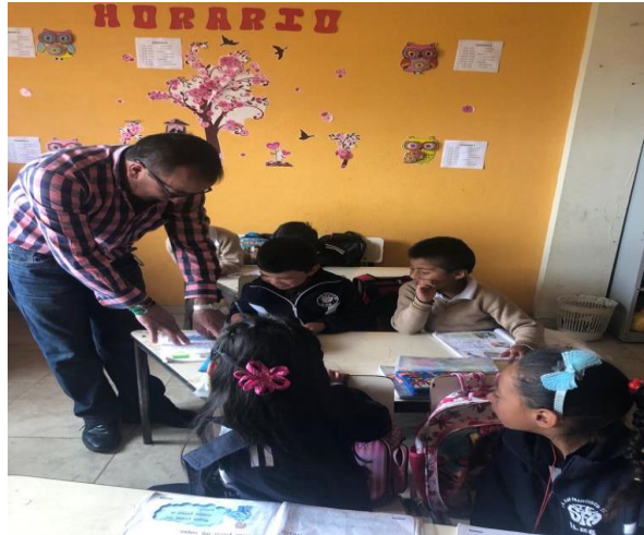
Figura 4. Elaboración de textos en el aula.

De acuerdo con la propuesta pedagógica y con la creación de textos etnoliterios se concluye que al haber conexión con el mundo natural, la imaginación constante, por lo tanto siempre habrán nuevas ideas, nuevos escritos, además, se involucra también al núcleo familiar de este modo los mayores de cada familia aportan ideas a sus hijos o a sus nietos en la elaboración de los textos.