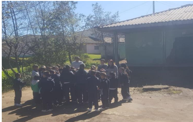
Figura 6. Jugando y explorando

escriban, es necesario trabajar una serie de actividades en el aula de clase de acuerdo con la motivación, edad de los niños y niñas.