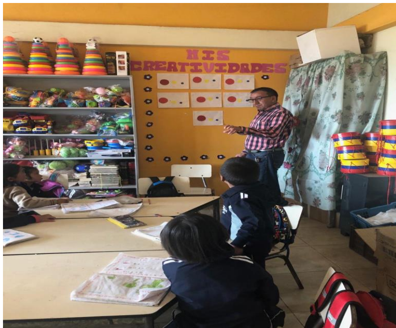
Foto 2. Ambientacion de la clase