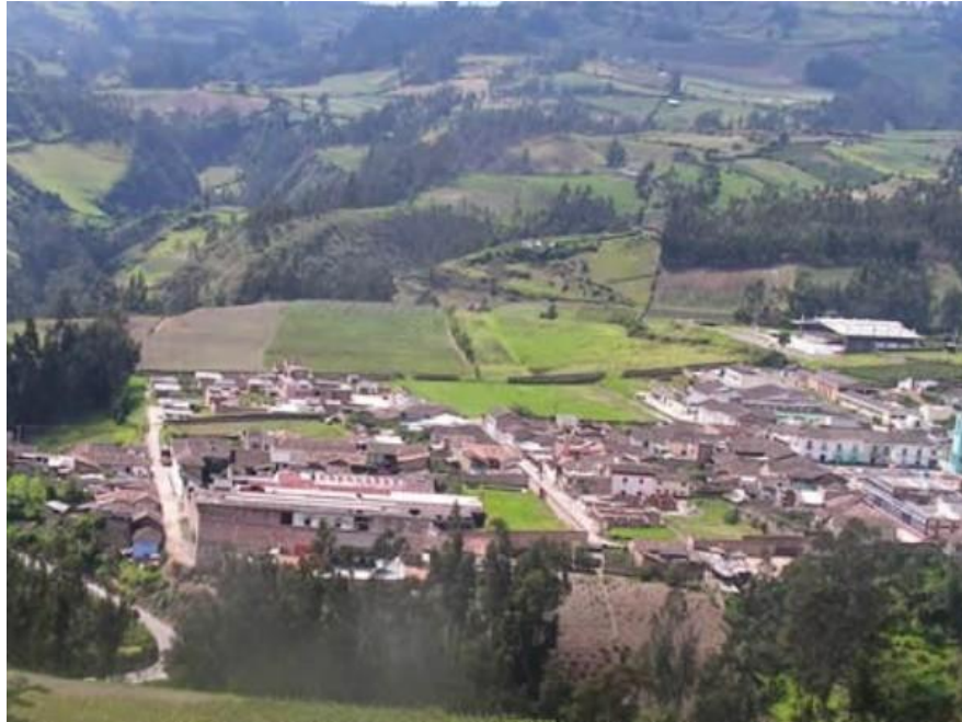
Figura 1. Municipio del Contadero- Nariño

La organización de Los Pastos se basaba en cacicazgos entre los cuales se puede destacar Puerres, Iles, Pupiales, Túquerres, Cumbal, Mallama, Mallasquer, Cuaspud, se sabe que existía un pequeño asentamiento indígena, llamado Putisnan, que hoy se conoce como Aldea de María. Los indígenas se dedicaban principalmente a la agricultura y mediante el sistema de trueque lo cambiaban por oro y chaquiras, trabajaban el algodón y elaboraban mantas, conocían igualmente la alfarería, el telar y el grabado en piedra, eran supremamente respetuosos frente a la naturaleza y su cosmovisión era muy amplia.