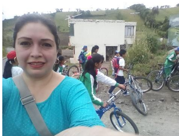
Figura 2. Estudiantes en travesía etnoliteraria

Una de las formas para potenciar la creatividad e imaginación en los niños es los recorridos etnoliterarios, que son salidas a lugares reconocidos del territorio para que ellos exploren libremente y creen nuevas ideas al momento de escribir un texto (cuentos, Poesías, Coplas, etc.)