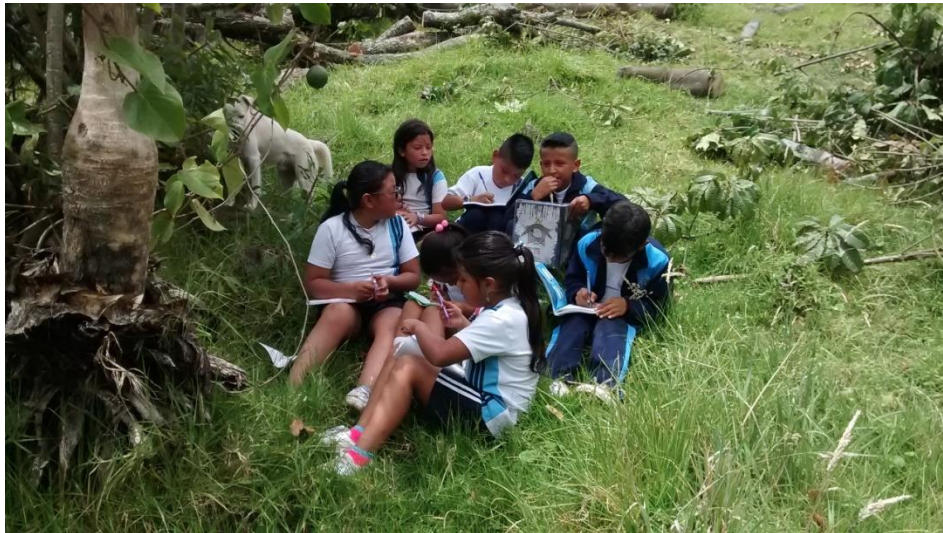
Foto 4. Compartiendo ideas.