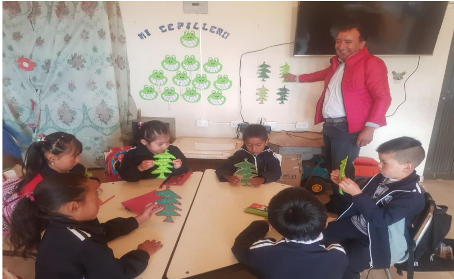
Foto 5. Desarrollo de estrategias lúdicas.