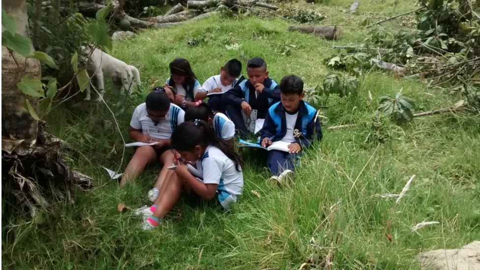
Foto 3. Construyendo cuentos apartir de la observación.