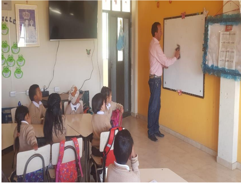
Foto 1. Conviviendo en el aula