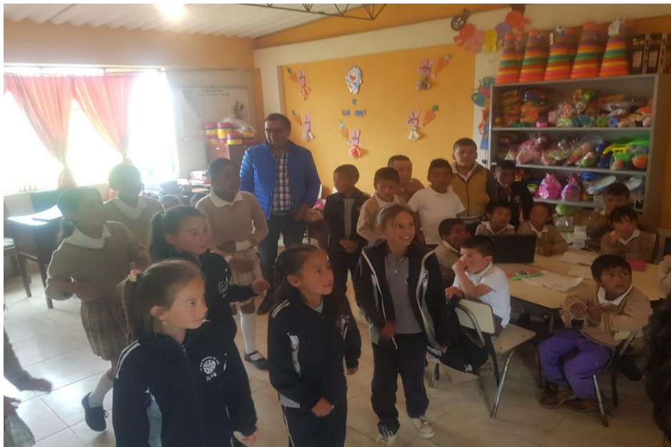
Foto 6. El juego una herramienta básica.