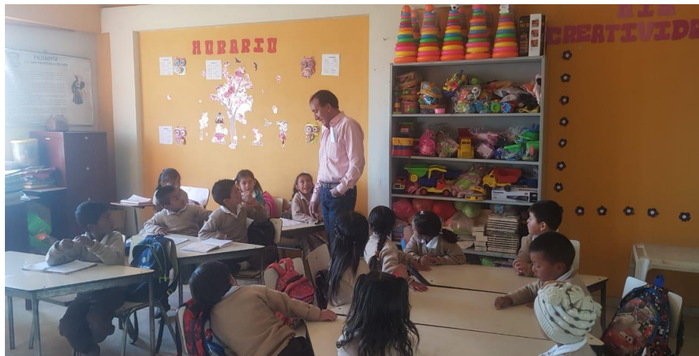
Figura 7. Contando historias relatadas por los mayores

niños reflexionaron sobre el daño que ha causado esa mina. Los juegos realizados después de cada actividad, fue una herramienta para que los niños le pongan interés a lo que hicieron y estén activos, creo que me ayudó mucho en esta propuesta, cuando llegue eran niños callados y poco participativos, tenían desinterés por estudiar y poco colaboraban en clase, luego de la primera actividad, se notó un cambio radical ya que les gusto y realizaban sus actividades escolares con la motivación de que se realicen de nuevo esas salidas. El escribir les ha ayudado a compartir con sus familiares, ya que cada vez que llegaban a la escuela traían nuevas historias relatadas por sus papás y abuelos. Una experiencia que a mi parecer si cumplió con el objetivo que es “fortalecer la identidad cultural a través de la creación de textos etnoliterarios”. Ya que no solamente escribieron sobre los lugares visitados, sino que también escribieron parte de la oralidad que fue transmitida por sus mayores.