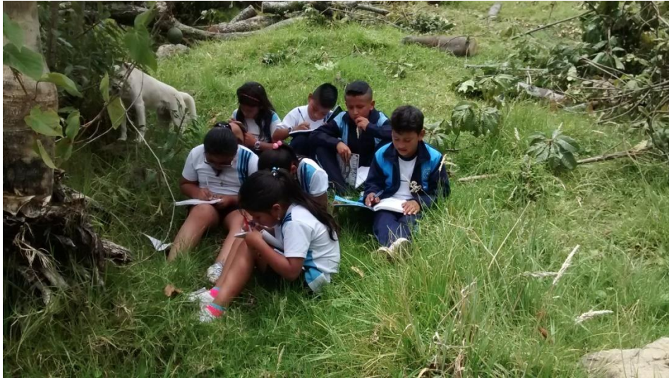
Figura 6. Exploración del entorno

niños conozcan su territorio, aparte de esto, sirva de inspiración para la creación de sus textos, haciendo uso de su imaginación, que los niños exploren su campo, se sientan tranquilos y cómodos en un ambiente diferente a las aulas de clase.