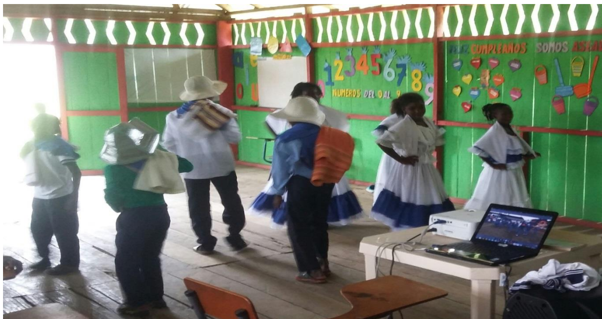
Figura N° 18. Danza la guaneña