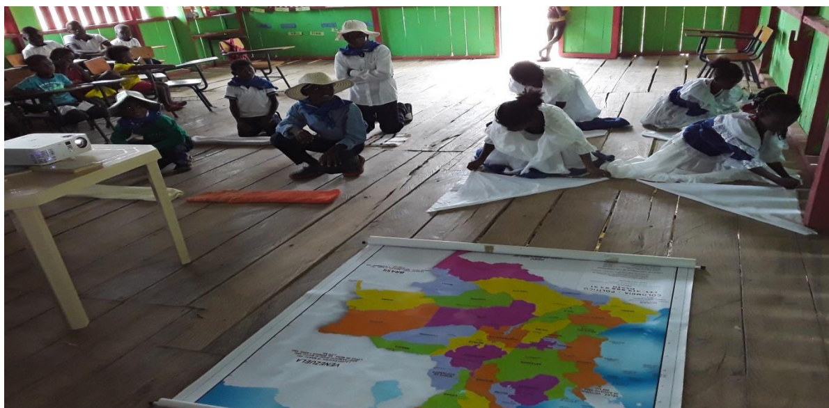
Figura N° 7. Representación de danzas de acuerdo a los límites.