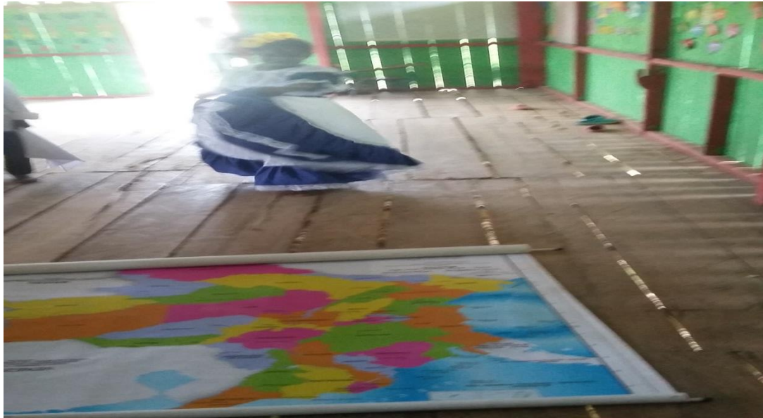
Figura N°. 10 Representación de la danza la cumbia