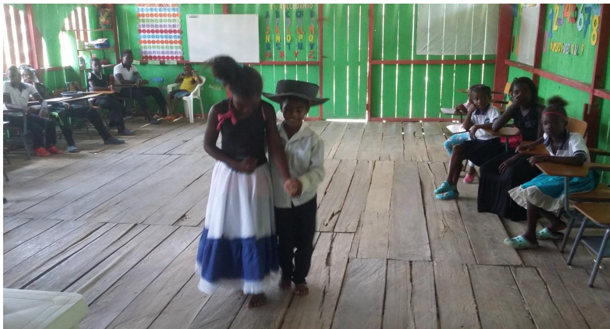
Figura N° 11. Representación de la danza el joropo.