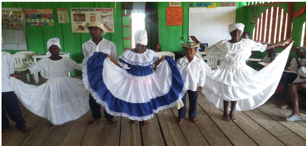
Figura N° 12. Representación de la danza del currulao