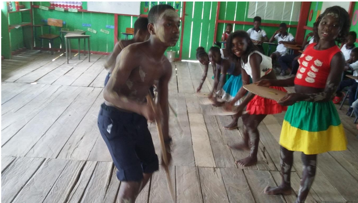
Figura N° 17. Danza la mina

encargado personas ajenas y foráneas a robarse sus riquezas la cual consistió en que tenían que ir bailando y cantando, aunque mi amo me mate a esa mina no voy, porque no quiero morir en un socavón.