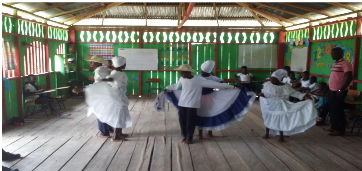
Figura N° 15. Explicación sobre las prácticas culturales

El maestro debe ser un guía e instructor tal como paso en las actividades anteriores en las cuales estuve pendiente de cada detalle que permitiera que cada actividad saliera satisfactoria, recordando a los menores los beneficios de la práctica de nuestra danza, siendo el currulao la más representativa de la costa del pacífico y que hoy en la actualidad solo se ve y se escucha en el carnaval, en la representación de las candidatas que hacen este baile y que desde ahí no volvemos a saber porque otros ritmos tienen más importancia para los niños que el propio, pues este es nuestro legado ancestral y si en todas las actividades realizadas parte de él, los niños crecerán con la mentalidad de que tienen que realizarlo, bailarlo y disfrutar su música y canciones que son pegajosas, dinámicas, divertidas y alegres los cuales se reflejan en cada una de las danzas según el lugar representado.