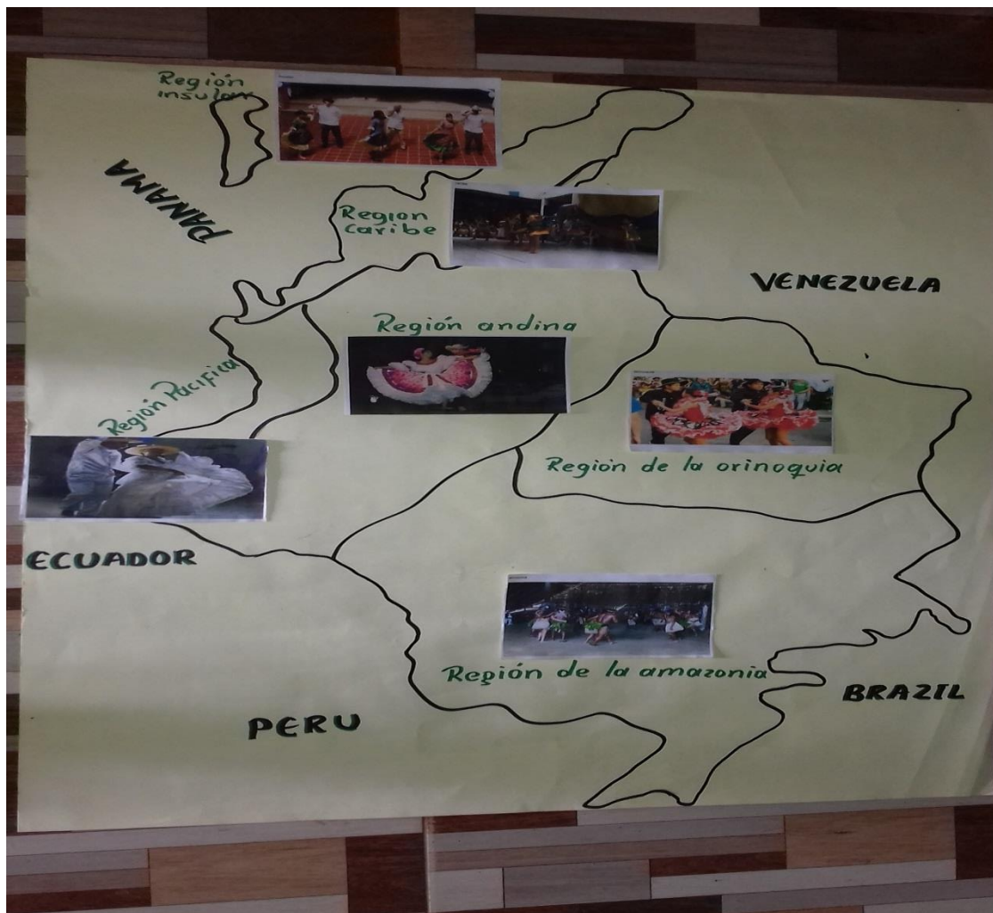
Figura N° 9. Mapa de convenciones de danzas

de baile, la zona en el cual se realizaba y sus principales características destacando la importancia de este por el lugar que se practica como por ejemplo: