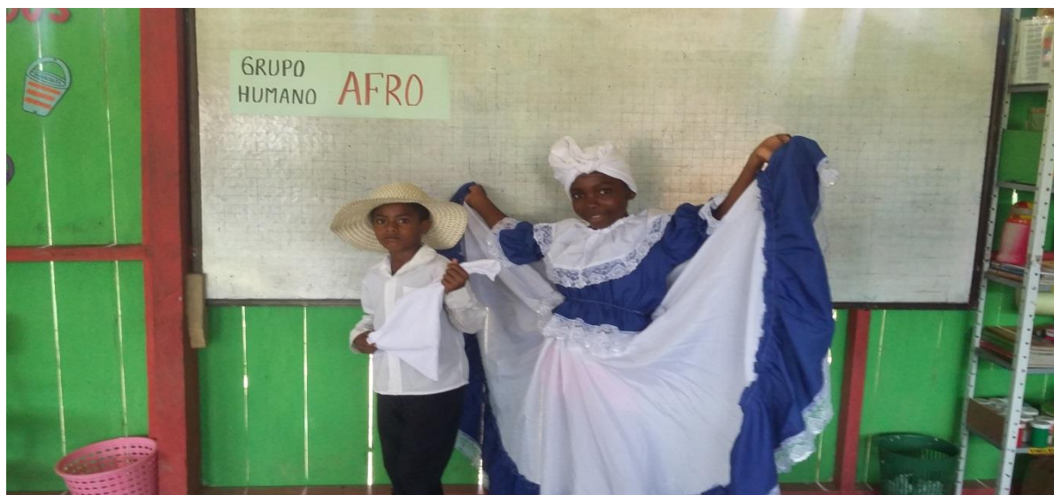
Figura N° 21. Caracterización del grupo humano afro

El primer grupo represento los afro descendientes del cual organizaron algunas de las manifestaciones culturales que se realizan internamente, realizando una manifestaciones del baile del currulao siendo la danza más representativa, luego de ello se explica del porque el baile, como lo bailan, las riquezas de su cultura y el lugar de Colombia en donde más se concentra su población o hay más agrupación de ellos.