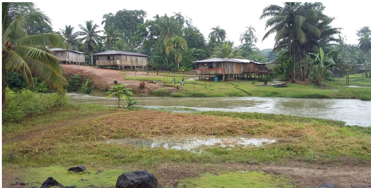
Figura N° 5. Comunidad pirí las delicias.

sobrino y agrandaron la población por eso hoy en día Las mayoría de los habitantes son familiares, son gente colaboradora, hospitalaria, solidarias y trabajadoras