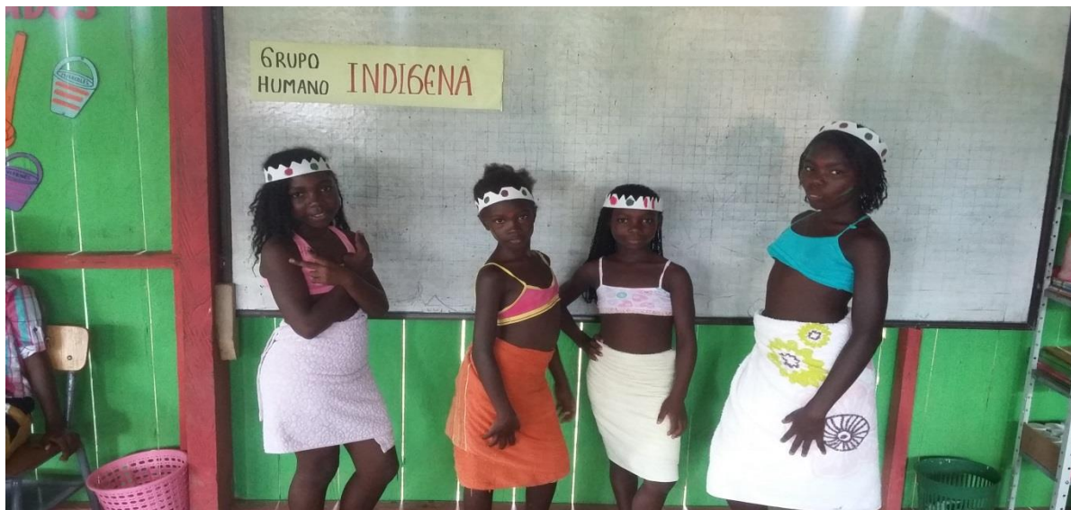
Figura N° 25. Caracterización grupo humano Indígena

Posteriormente se dio paso a la representación del grupo humano indígenas.