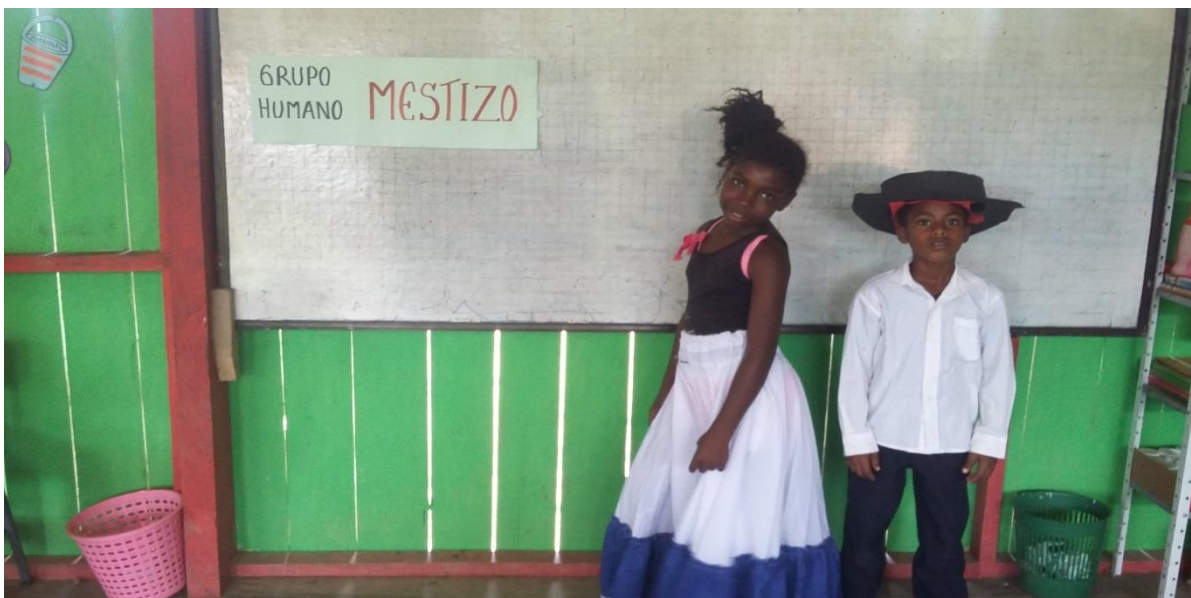
Figura N° 27. Caracterización grupo humano mestizo

Después de esta intervención se abordó el grupo humano mestizo.