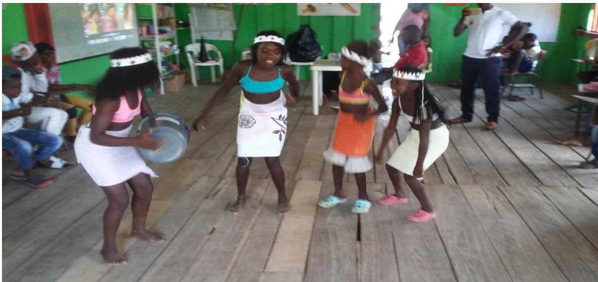
Figura N° 26. Representación de la danza en el salto de Chucunaque