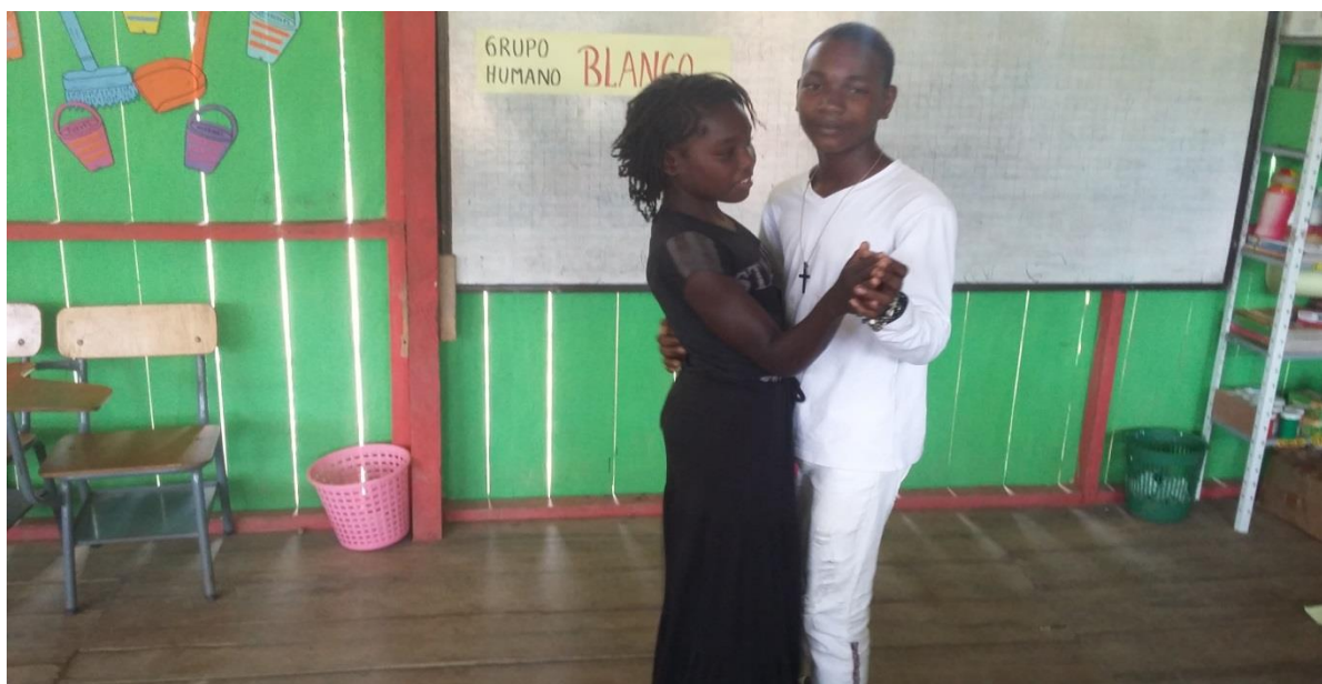
Figura N° 30. Representación del baile el bolero

Los estudiantes se personificaron y representaron el bolero como muestra de algunas de las costumbres de este grupo humano, aquí se notaron aburridos y pardos, pues no es un ritmo que represente alegría y folklor más bien sobriedad y elegancia.