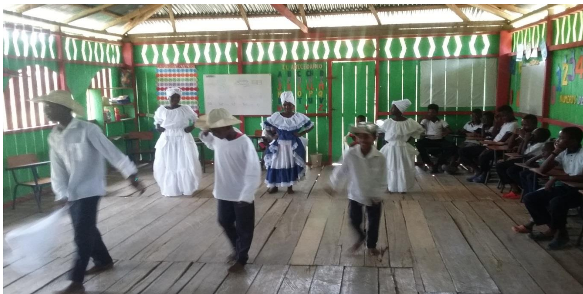
Figura N° 22. Representación cultural afro (de la danza el currulao)

simplemente no les da la gana invertir en proyectos en esta zonas, que aunque su población esta regada por todo el país, su mayor concentración es en la región pacifica de la cual hacemos parte, tierras olvidadas como lo es el choco y muchos municipios de la costa en los cuales no hay políticas publicas solidas que sus dirigentes se tienen que arañar para lograr algunos beneficios, que no hay al menos servicios básicos de acueducto, alcantarillado, sistema de salud digno, y que hoy sus poblaciones viven en situación, de violencia y desalojo de sus comunidades.