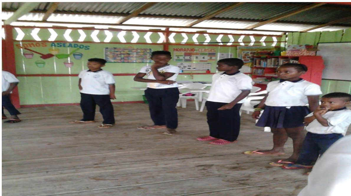
Figura N° 8. Socialización sobre el resultado de la entrevistas.