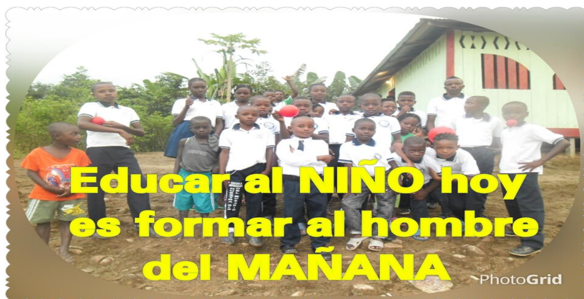
Figura N° 6. Estudiantes del centro educativo Piri las delicias.