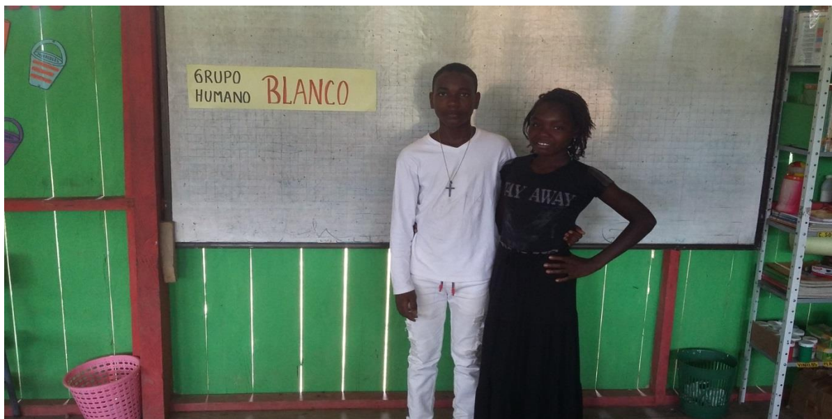
Figura N° 29. Caracterización grupo humano blanco

Por ultimo le correspondió al grupo de los blanco.