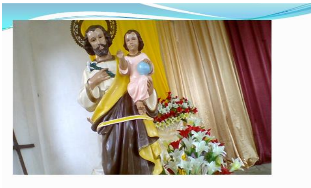
Figura N° 3. Imagen de santo patrono del municipio

zona rural y urbana, siendo porcentualmente el 90% concentrada en la zona rural y el 10% en la zona urbana, su economía se basa en la agricultura, la minería ilegal, la pesca y la ganadería, siendo las dos últimas en poco porcentaje. Su principal y única vía de transporte que tiene es la fluvial y se encuentra en trámite la vía terciaria San José la Guayacana, kilómetro 85. Su principal religión es la Católica, aunque en los últimos años hay presencia de muchas fiestas religiosas: pentecostal, cruzada, testigos de Jehová, entre otras. Su santo Patrón es San José, que se celebra el primero (1) de Mayo de cada año, a partir del año 2.005 se constituyó en parroquia la cual tiene por nombre San José Obrero.