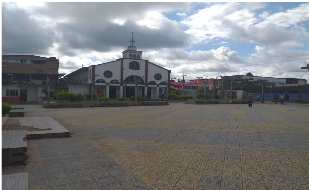
Figura N° 4. Panorámica del municipio de Roberto payan.

trabajadoras, creyentes, honradas, con costumbres, tradiciones, valores étnicos y dialectos propios.