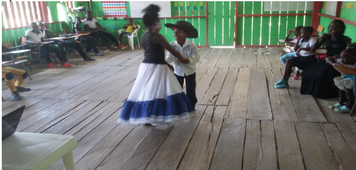
Figura N° 28. Presentación de la danza del joropo

En este caso los estudiantes se metieron en personajes, representando la manera de hablar, vestirse, y compartir de este grupo, después de haber realizado la consulta requerida y realizaron la danza del joropo, copiando algunos pasos, puesto que estos bailes son bastantes técnicos y algunos de sus pasos son bien complicados, se esforzaron por representarlos y sacar una buena socialización.