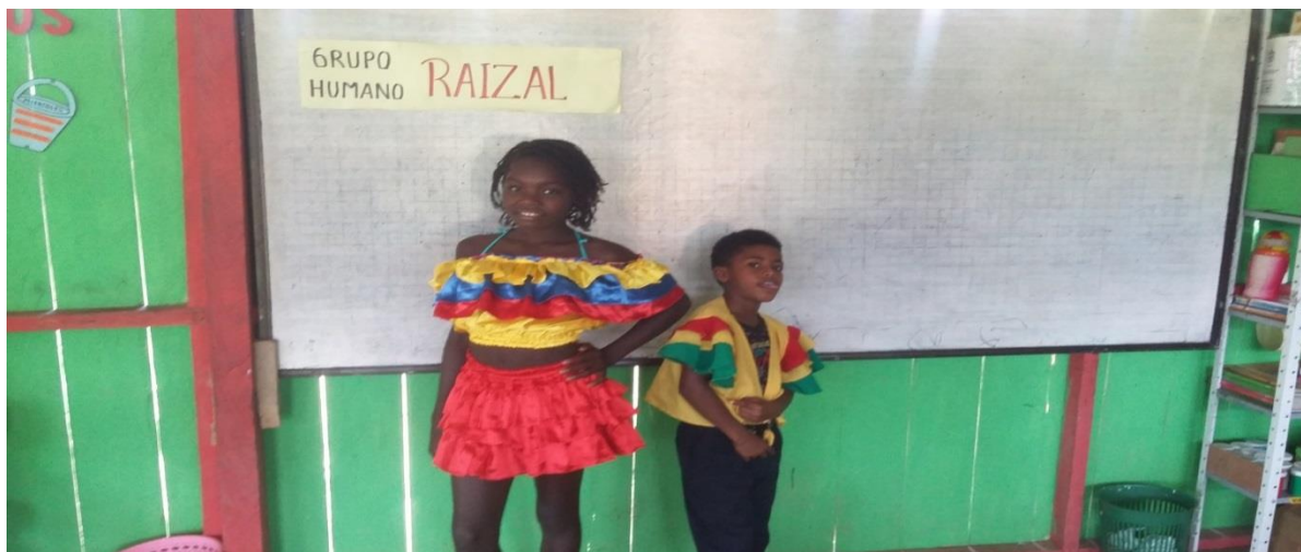
Figura N° 23. Caracterización grupo humano raizal