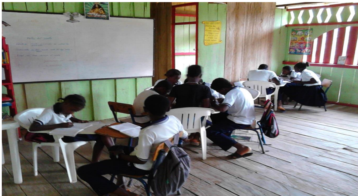
Figura N° 14. Estudiantes realizando trabajo grupal.