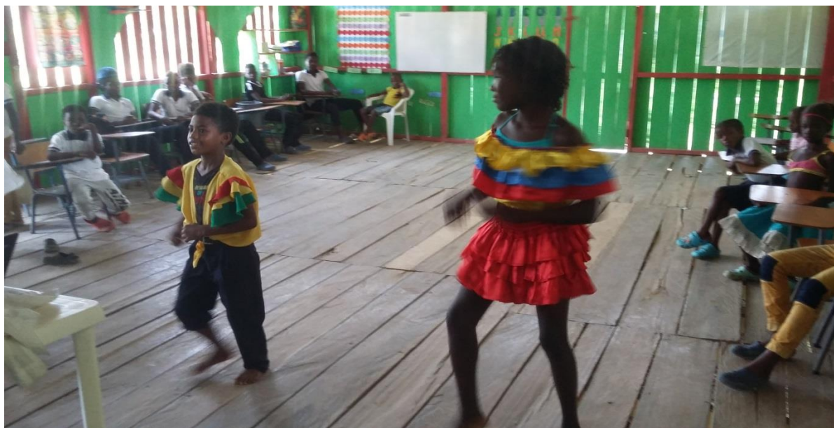
Figura N° 24. Representación de la danza típica

Que lo conforman las personas que integran las personas de san Andrés y providencia, los cuales son alegres y festivos con características similares a los afro descendientes con danzas autóctonas de su cultura, bailan el reggae y otras formas de costumbres y tradiciones, como la champeta se esforzaron por realizar una danza amena de acuerdo a las exigencias requeridas.