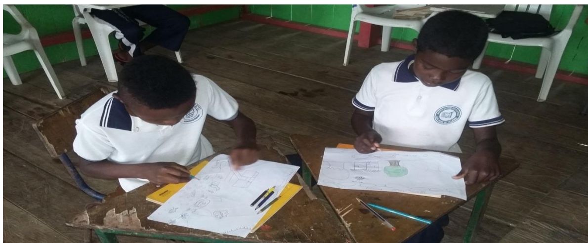
Figura N°. 16 Estudiantes representando diferencias entre el campo y la ciudad.

A partir de la representación de diversas danzas, con los cuales se logró identificar el tipo de lugar al cual está representando ya sea de la zona urbana o zona rural, los niños en esta oportunidad realizaron diversas consultas las cuales les sirvió para aclarar contenidos y afianzar sus conocimientos y poder demostrar con base y propiedad las diferencias de las características del campo y de la ciudad.