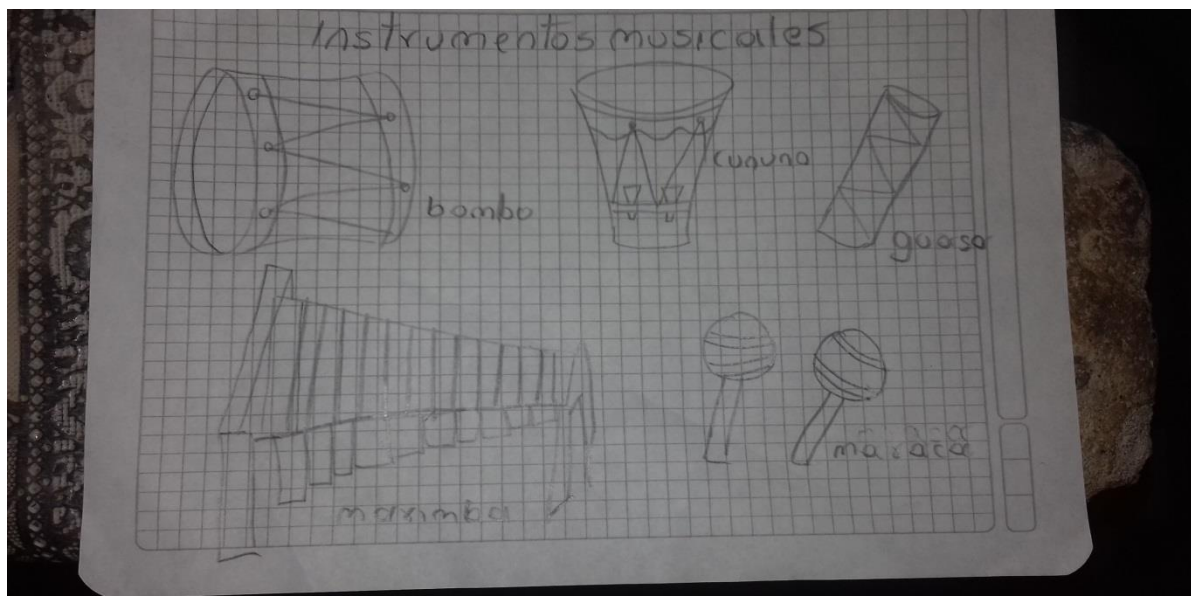
Figura N° 20. Realización por medio de dibujos los instrumentos musicales

Realizaron un dibujo bien elaborado digno de una exposición, pues tuvieron en cuenta todas las recomendaciones y observaciones hechas, estos fueron decorados con vinilos para darle vida a cada uno de los dibujos.