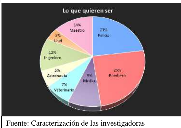
Ilustración 21 caracterización de la población 1

De 130 niños beneficiados, el 25% quiere ser policía, el 23% bombero y el 14% maestros. Lo que muestra que tiene valores como el servicio, el cuidado y la solidaridad arraigados en