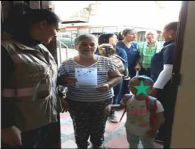
Ilustración 12: Estrategia: 5 min para tu niño(a)

Los padres o adultos significativos son fundamentales en la crianza de los niños, son los primeros educadores en la vida de los niños, de ellos adquieren los primeros significados del mundo y son ellos quienes satisfacen las necesidades primarias.