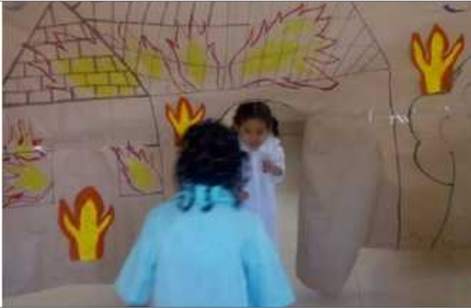
Ilustración 11: Los Bomberos

Lo que más se resaltó en esta actividad fue observar el sentido de pertenencia, de protección, amor y cuidado del otro, ya que en su comportamiento