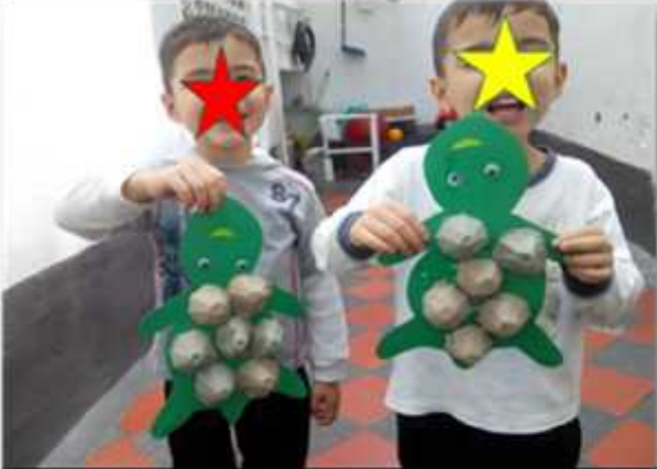
Ilustración 7: Estrategia la Tortuga

Fue una actividad positiva ya que se logró integrar todo el grupo, donde todos expresaban sus ideas, recuerdos y hasta surgían dudas de donde Vivían las