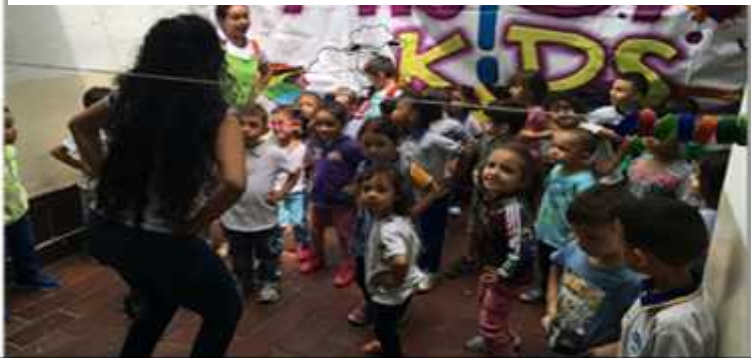
Ilustración 4 :El arte como expresión

Se necesita generar espacios que permitan al niño potenciar su expresión, creatividad e innovación las cuales hacen parte de él y que por circunstancias de su contexto, violencia, cultura o familia han sido bloqueados.