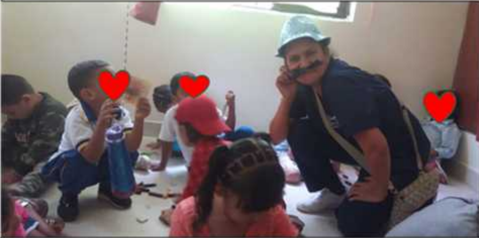
Ilustración 13: Estrategia: El Cartero

semana, permitía expresar sentimientos como la alegría, sorpresa, amor, silencio, afirman el mensaje de amor del uno con el otro “mi mama me dijo lo mismo”