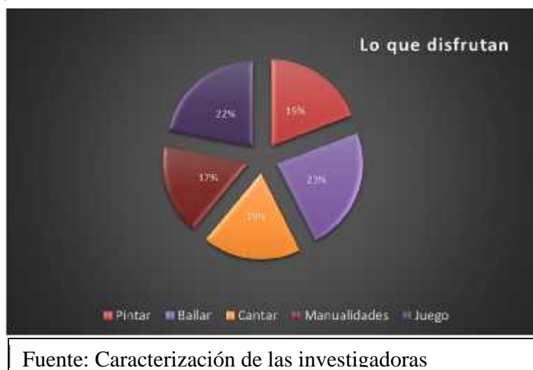
Ilustración 3 Caracterización de la población 2

Con base en el conocimiento de las particularidades de cada niño construimos las siguientes estrategias que nos permitieron interactuar activamente con ellos en ambientes de amor, de dialogo, de valores, cultura, artes y vínculos afectivos, para pensar, sentir, generar nuevas formas de interacción.