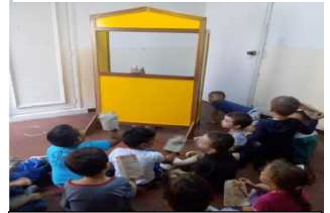
Ilustración 6: Teatro de títeres

Haber conocido las realidades de sus barrios y sus familias a través de ellos es un regalo para construir juntos caminos de sentido, de transformaciones, y poder vincular a sus familias a que hagan parte de la nueva realidad que queremos para ellos con razones reales a sus necesidades.