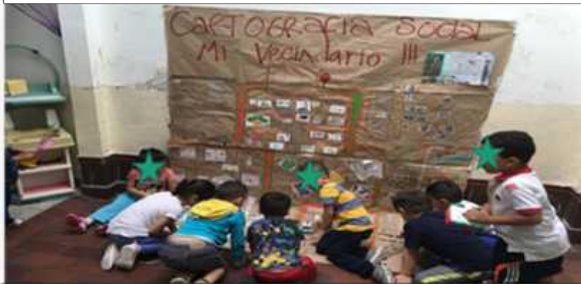
Ilustración 8: Cartografía del territorio