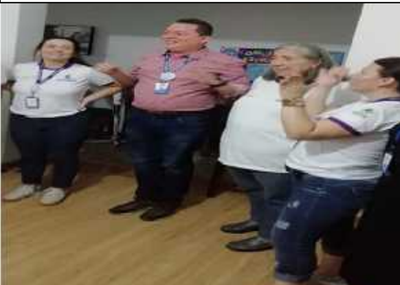
Ilustración 14: Estrategia Socialización