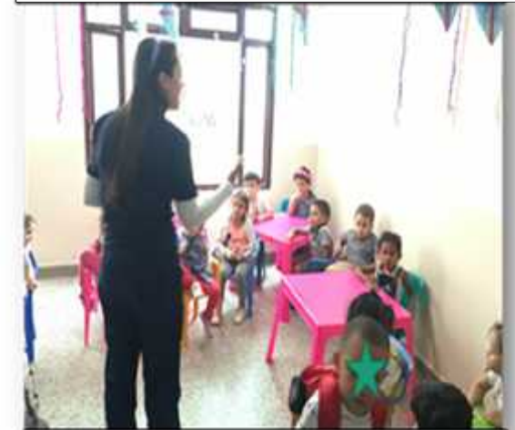
Ilustración 10: Cartografía del Centro Infantil

Reconocer cada espacio del centro: Cocina, Oficina, Comedor, Salón y Patio para Construir con ellos unas pautas de comportamiento en los distintos espacios, Identificamos las mejoras de los espacios donde los niños pasan su tiempo, los niños dibujan una propuesta del aula de clase que desean. Los niños mejoraron su convivencia y el respeto por cada espacio, ya en el comedor no se tiraban la comida y entraban o salían de un sitio en forma ordenada.