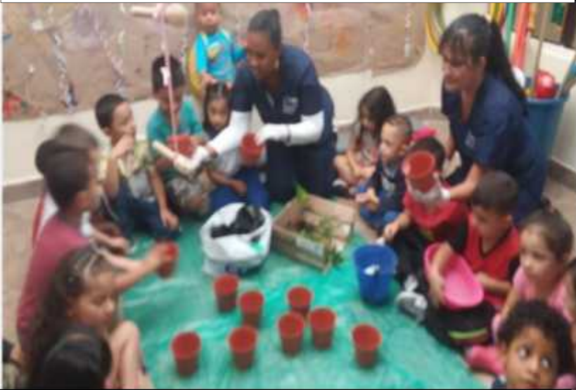
Ilustración 10: La siembra

hacer parte de un juego donde disfrutaban con el tacto, la vista y sus demás sentidos, además se logró despertar en ellos el interés del porque los nombres de sus familias con nombres de flores, formando todo esto parte de la historia socio cultural de sus entornos familiares y sociales.