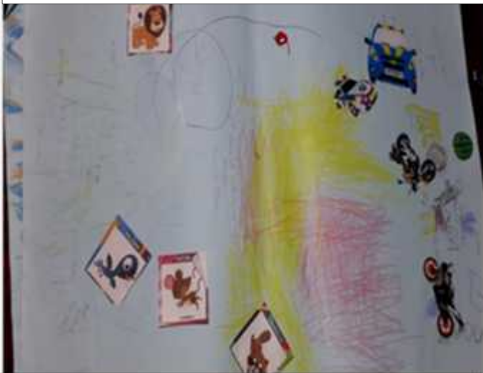
Ilustración 9: Cartografía del Centro Infantil