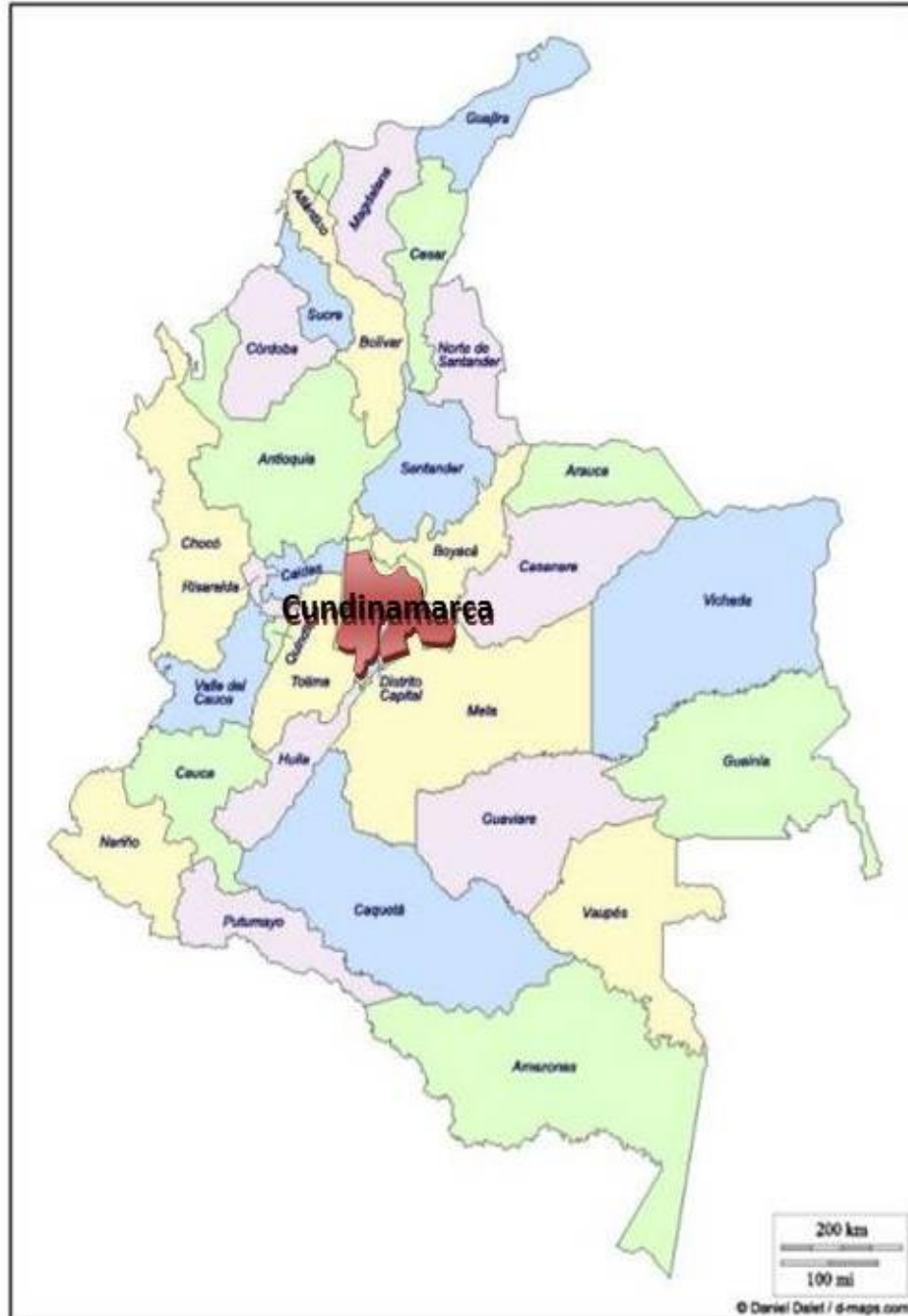
MAPA SITUACIONAL UBICACIÓN DENTRO DEL PAIS