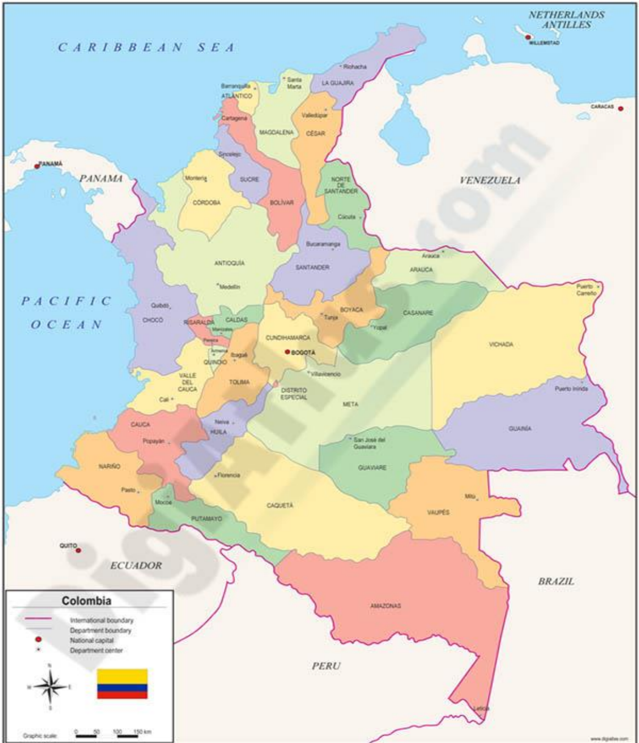
Mapa-Colombia tomado de internet.