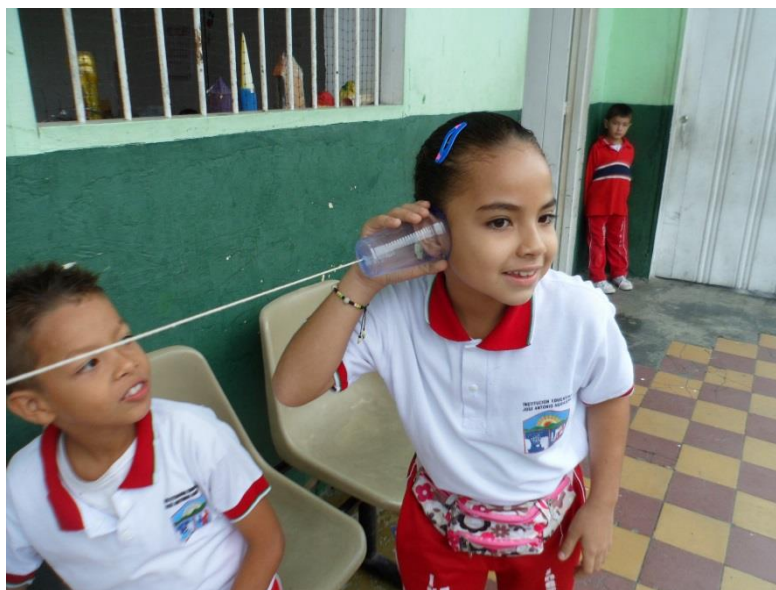
Figura 4. Ejercicio de teléfono roto interacción

El primer paso era dar a conocer a los niños el significado de la comunicación mediante un lenguaje sencillo y mostrando ejemplos de cómo se comunican los padres con los hijos, como se comunican entre compañeros de estudio y la forma de relacionarse el docente con sus alumnos, también se hizo una presentación sobre la historia de la comunicación de la cual ellos mismos hicieron un relato de cómo eran las primeras formas de comunicación del ser humano, concluyendo que era a través de símbolos, señales y sonidos y de que de esa manera fue surgiendo el lenguaje. Seguidamente se dieron a conocer los elementos de la comunicación y se indicó para qué sirven y qué papel juega cada uno, se hicieron juegos donde se buscó identificar cada elemento y reflexionar sobre su importancia, juegos como el teléfono roto ya conocido por ellos pero del cual poco habían reflexionado, se les indicó varias situaciones: una de ellas era la importancia de tener claro el mensaje a transmitir, manejar un lenguaje sencillo y claro por parte del emisor, que el