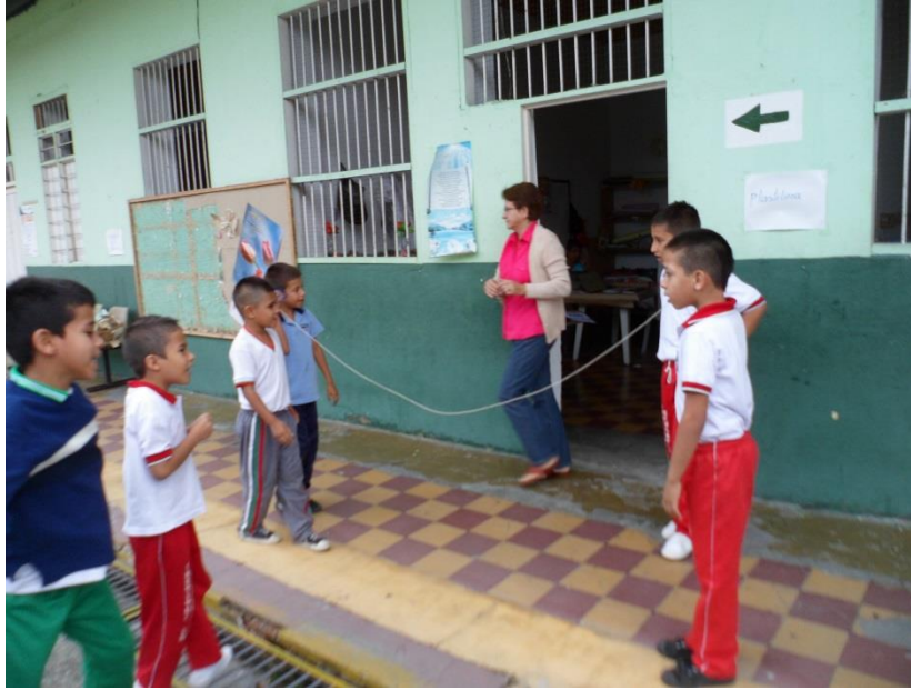
Figura 3. Ejercicio de teléfono roto

Teniendo en cuenta el propósito principal dirigido a propiciar en los estudiantes, conocimientos en comunicación para mejorar sus habilidades de expresión frente a la sociedad, se diseñó una serie de actividades pedagógicas y lúdicas a través de las cuales se motivará al niño hacer buen uso de la comunicación.