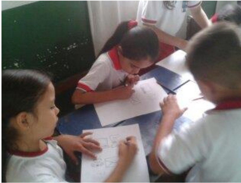
Figura 6. Plasmando a través del dibujo lo aprendido

Teniendo en cuenta otro de los objetivos sobre propiciar espacios de debate en los niños, se desarrollaron ejercicios de diálogo entre ellos, de lecturas y de análisis de las mismas, así ellos participaron y expresaron sus pensamientos e ideas.