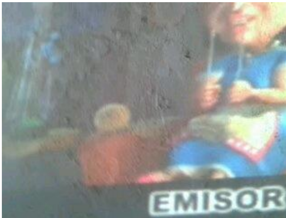
Figura 5. Video sobre los elementos de la comunicación

receptor debía estar dispuesto a recibir el mensaje, asimilarlo y tener la capacidad de retransmitirlo si era el caso. El medio también era muy importante pues es el hilo conductor del mensaje y si presenta distorsiones puede variar el mensaje.