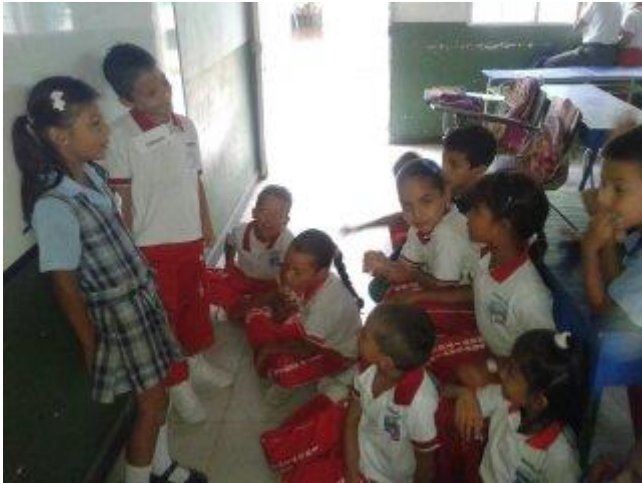
Figura 7. Ejercicio diálogo Emisor-Receptor