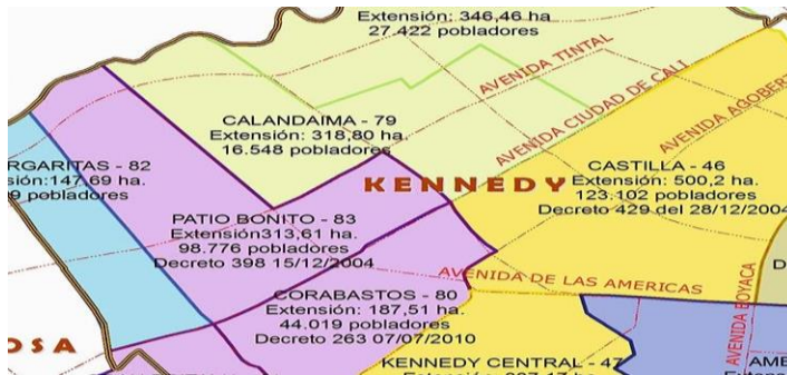
Figura 1 Mapa de la distribución localidades de Bogotá

La propuesta presentada se realiza en la localidad de Kennedy, estrato dos Kennedy es la localidad número 8 de la ciudad, es una de las más pobladas del distrito, está ubicada en el suroccidente de la sabana de Bogotá y se localiza entre las localidades de Fontibón al norte, Bosa al sur, Puente Aranda al oriente y un pequeño sector colinda con las localidades de Tunjuelito y Ciudad Bolívar, por los lados de la Autopista Sur con Avenida Boyacá, hasta el río Tunjuelito.