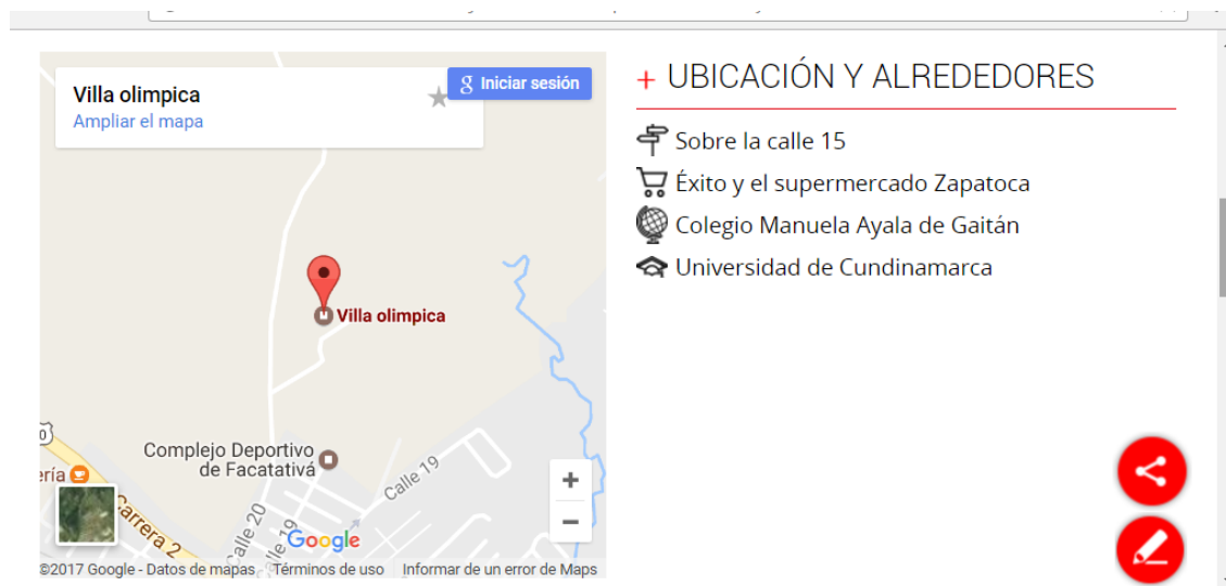
Ilustración 1. Ubicación