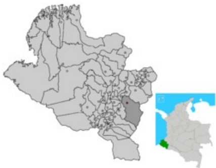
Imagen No 6. Ubicación San Juan de Pasto

La UNAD CEAD Pasto se encuentra ubicada en el Municipio de San Juan de Pasto es una ciudad de Colombia, capital del departamento de Nariño, además de ser la cabecera del municipio de Pasto. La ciudad ha sido centro administrativo, cultural y religioso de la región desde la época de la colonia.