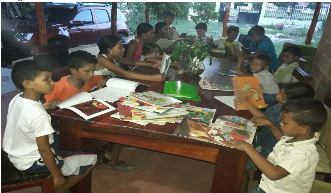
Niños disfrutando de la lectura individual en la Sede Cultural La Lagartija Tartamuda