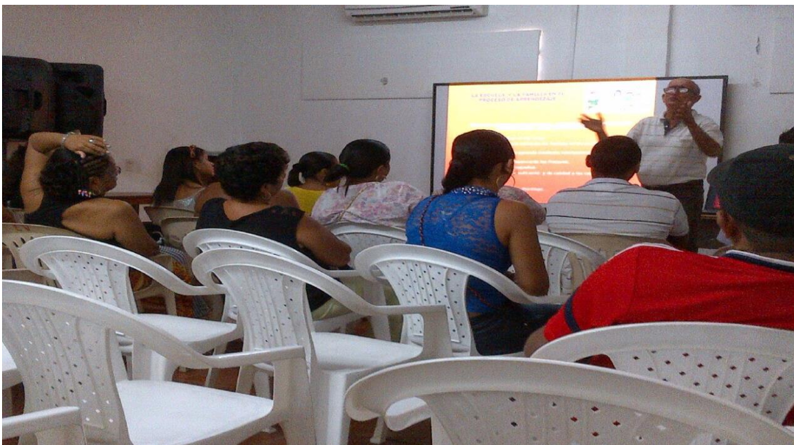
Taller de padres sobre acompañamiento infantil, inicio del año escolar La Lagartija Tartamuda