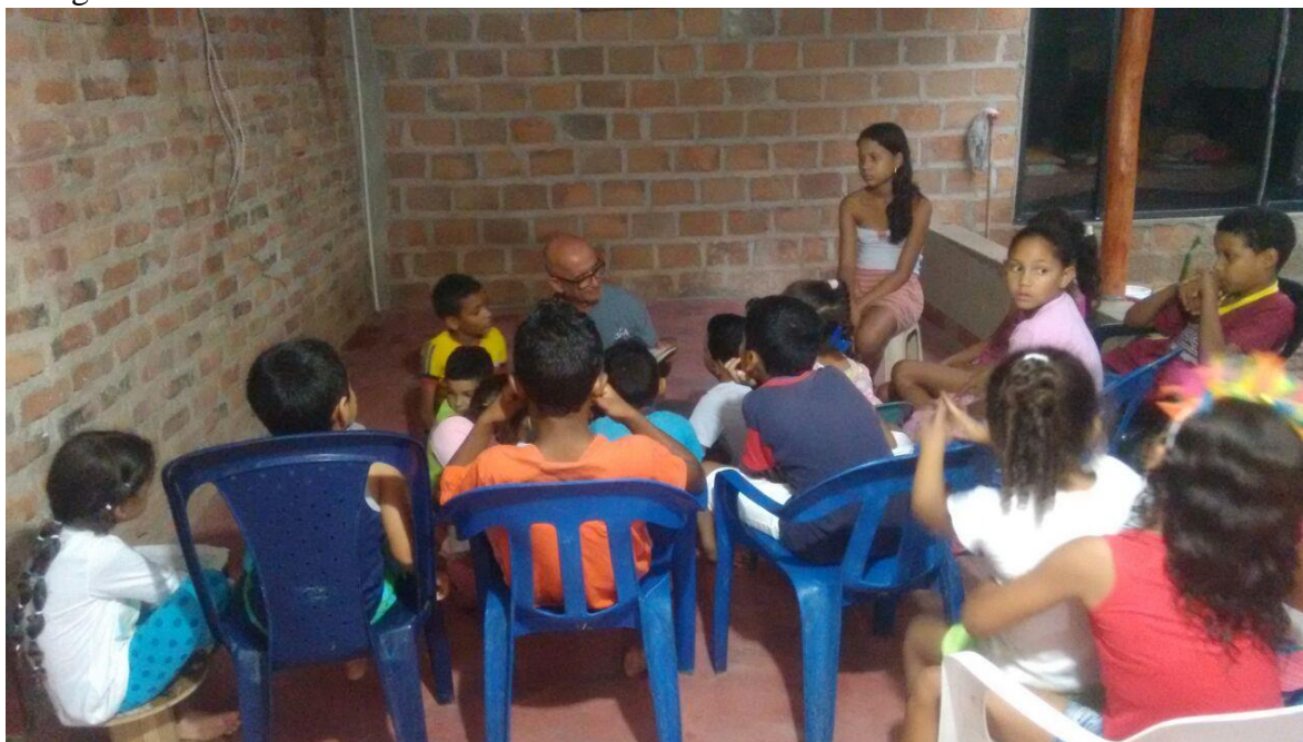
Sesión de lectura en voz alta en la Sede Cultural La Lagartija Tartamuda