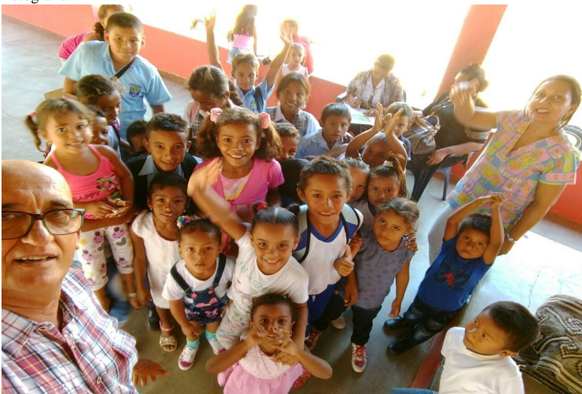
Durante sesión de lectura en la Escuela H. Manuel Lacouture. La Lagartija Tartamuda