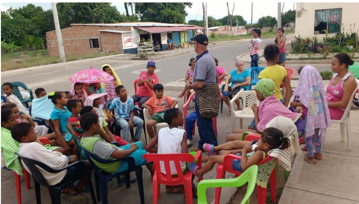
Charlas con los niños de la comunidad en la plaza del pueblo.