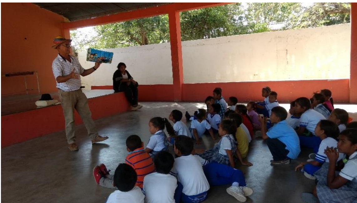
Lectura de cuentos en la escuela Huguez Manuel Lacoture