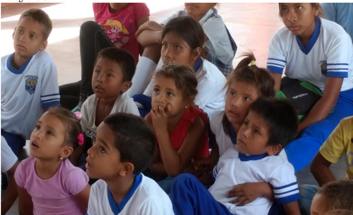
Niños escuchando lectura de cuentos Escuela H. Manuel Lacouture.