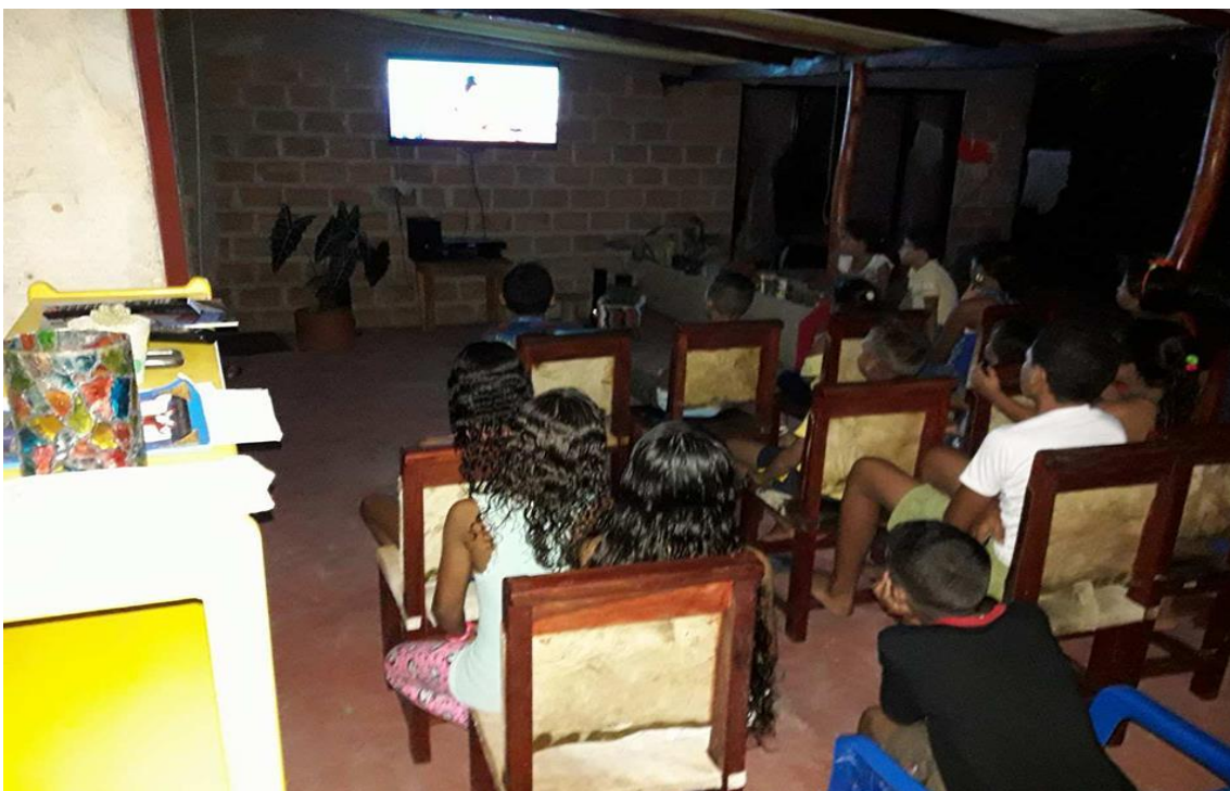
Sesión de película los días viernes en Sede Cultural La Lagartija Tartamuda