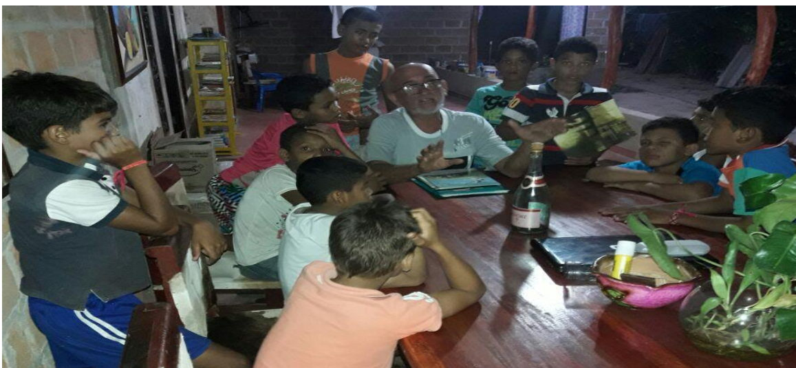
Lectura de cuentos en voz alta en la Sede Cultural La Lagartija Tartamuda