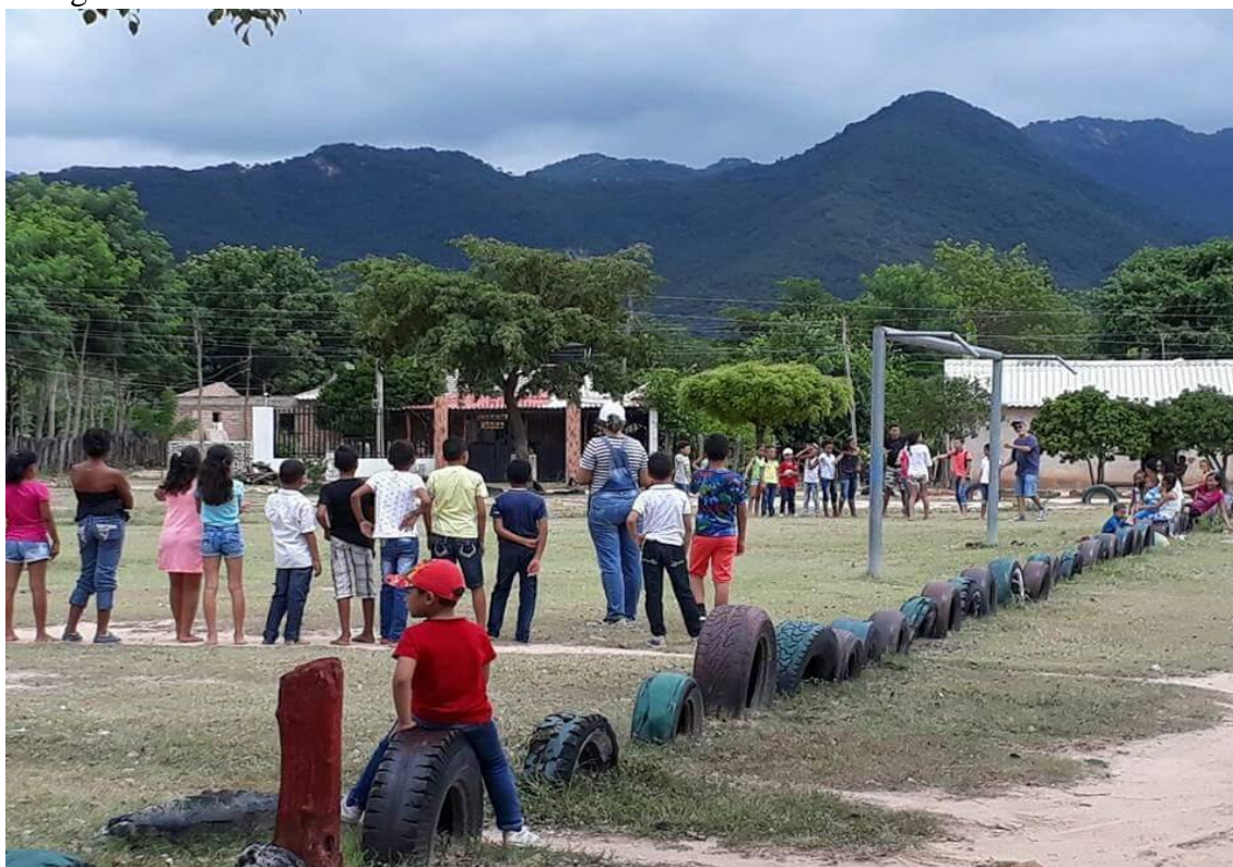
“Día de Campo”, actividades extras realizadas con los niños del corregimiento.