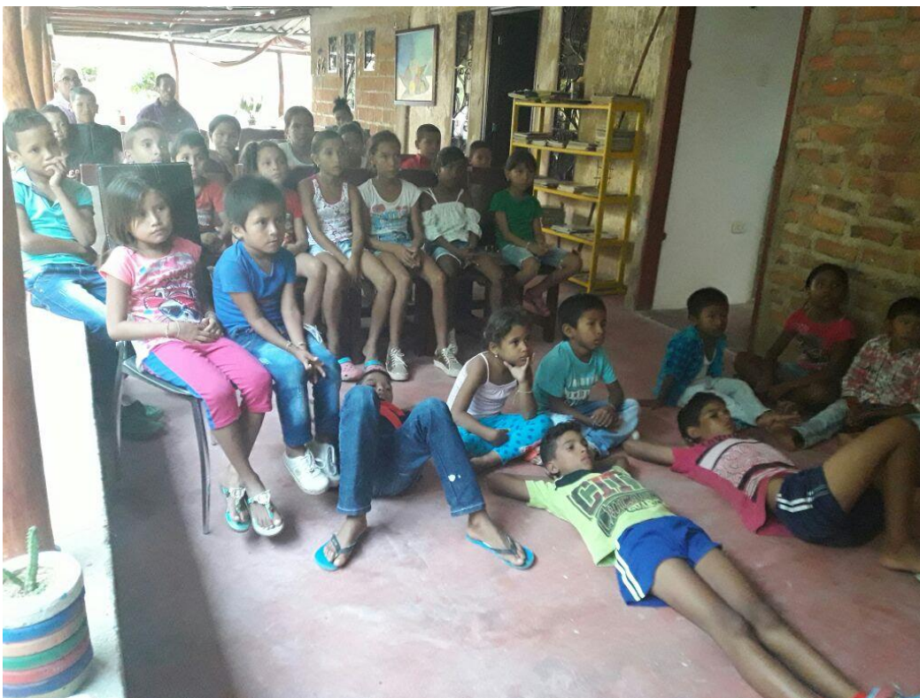
Niños disfrutando de películas infantiles en la Sede Cultural La Lagartija Tartamuda