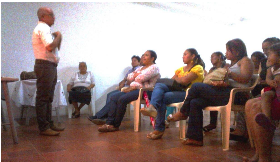
Taller de padres sobre acompañamiento infantil, inicio del año escolar