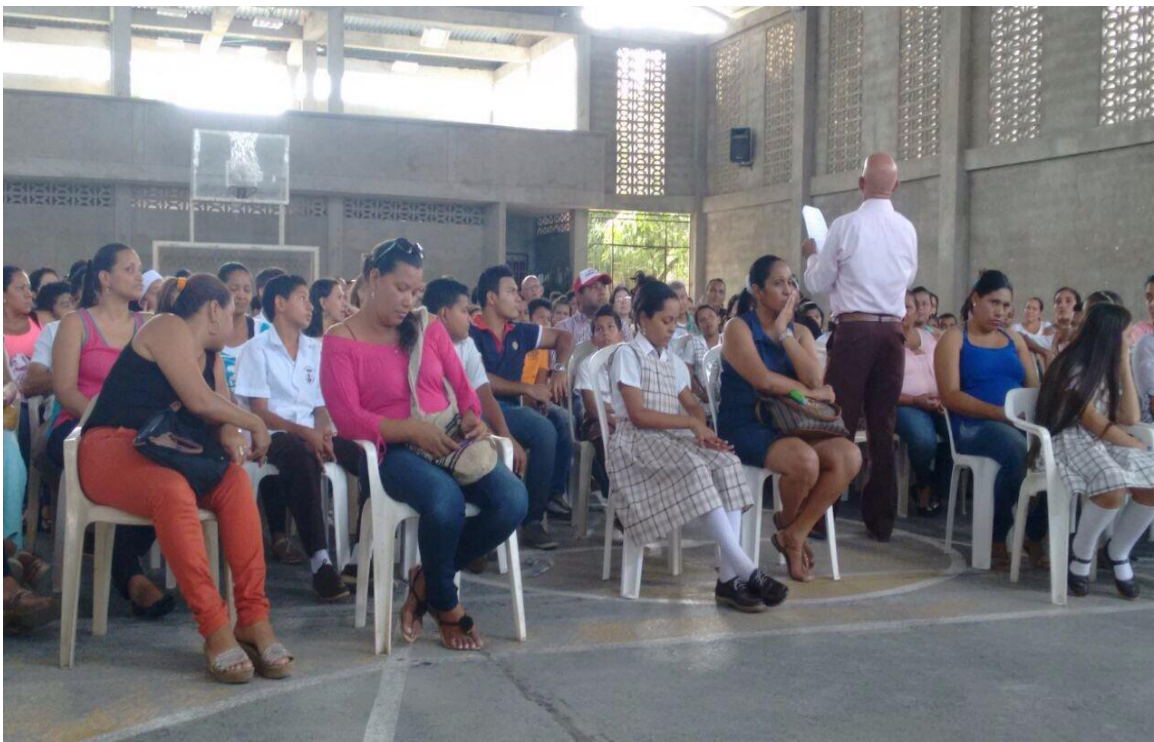
Charlas con padres del colegio El Carmelo, en cabecera municipal.