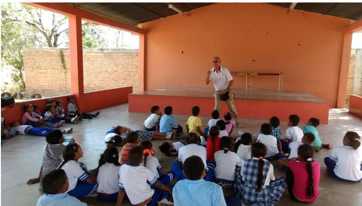
Dramatizando cuentos en la escuela H Manuel Lacouture.