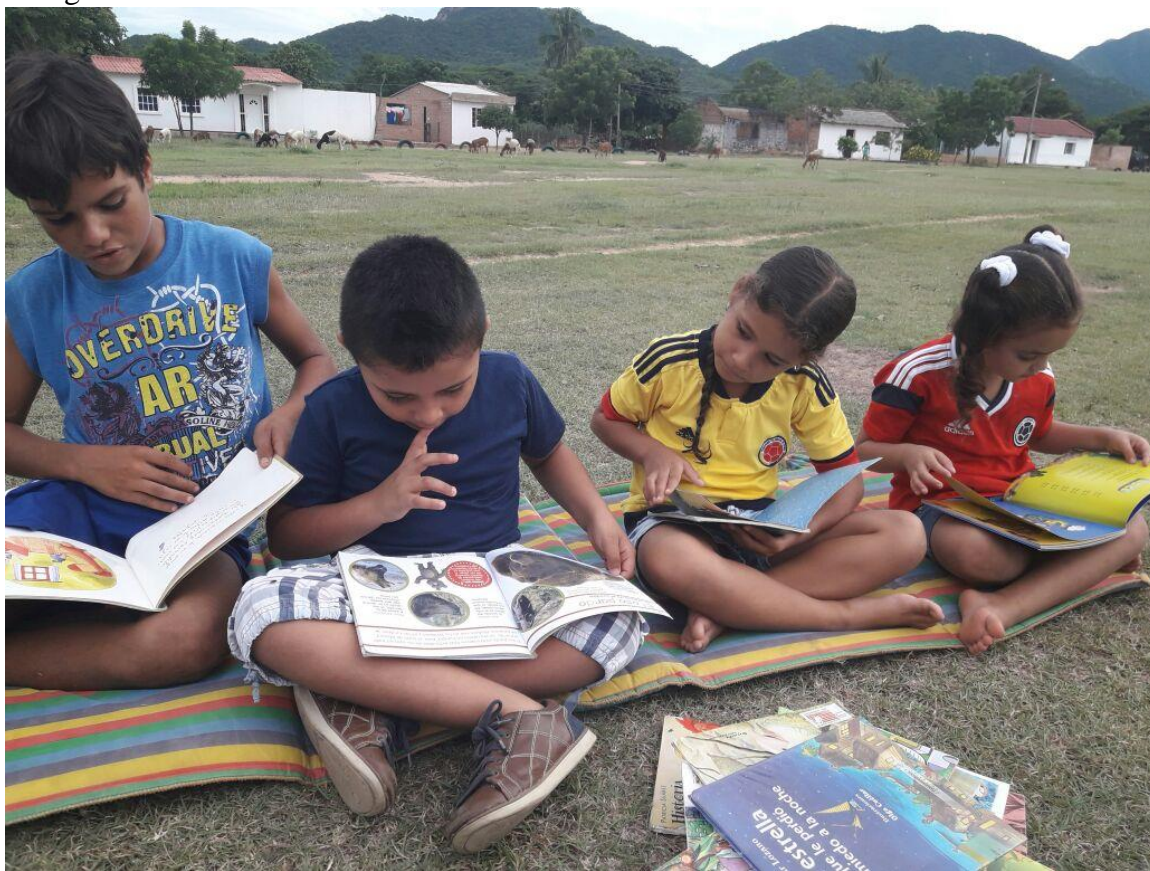
Niños leyendo durante la actividad de “Día de Campo”