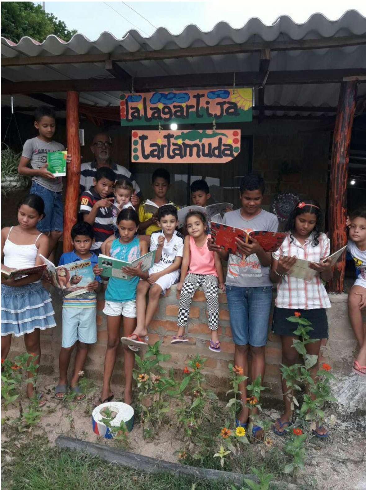
Los visitantes permanentes de la Sede Cultural La Lagartija Tartamuda.