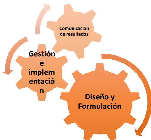
Ilustración 1. Diseño Metodológico de la Investigación Documental