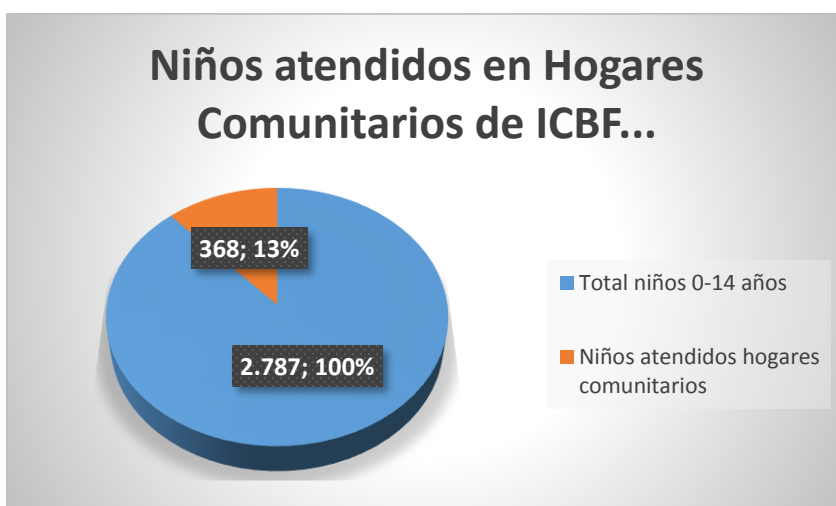
Grafico3. Niños atendidos en hogares comunitarios ICBF. Municipio de Vélez Sistema Único de Información de la niñez del ICBF, DANE 2005.

Geográficamente la cabecera municipal de Vélez Santander, dista a 238 km de Bucaramanga, la Capital Departamental. Situado a 2.150 m de altitud, en su territorio se distinguen dos Regiones fisiográficas: al oeste se extiende la zona del Carare, perteneciente al Valle del río Magdalena; al este, el área montañosa, cuyo relieve forma parte de la cordillera Oriental, en la cual se destacan la peña de Vélez y los cerros de Armas y Tovar. Posee los pisos térmicos cálido, templado y frío, con una temperatura media anual en el casco urbano de 17 °C y un promedio anual de precipitaciones de 1.886 mm. Avenado por los ríos Magdalena, Carare, Guayabito y Opón, las principales actividades económicas son agricultura (caña de azúcar, guayaba, café, frijol, maíz, cacao, frutas y legumbres), industria (fabricación de bocadillo), ganadería (vacuna) y minería (caliza). Fue fundado por el capitán Martín Galeano en 1539, en el sitio conocido con el nombre de Ubasá. Desde el siglo XVII es municipio y en 1832 fue creada la Provincia de Vélez. (Portal alcaldía municipal de Vélez, 2016).