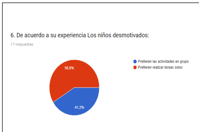
Ilustración 6. De acuerdo a su experiencia los niños desmotivados: Prefieren las actividades en grupo, Prefieren realizar tareas solos

En la última pregunta de acuerdo a la experiencia de los docentes, es contundente la respuesta al afirmar que los niños desmotivados realizan las tareas pero sienten que todo lo que hacen está mal. - Es quizás uno de los resultados más abrumadores obtener el 100 por ciento muestra la evidencia de que el niño no está mostrando pasión por realizar actividades, lo que condice a pensar que son niños que se muestran apático, el cual realiza las tareas solo por exigencia.