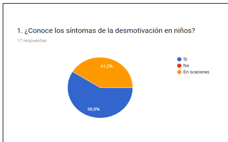
Ilustración 1 ¿Conoce los síntomas de la desmotivación en niños?

En la segunda pregunta por tratarse de profesores especialistas en primera infancia, 16 de ellos dicen reconocer con facilidad si un niño está triste o desmotivado y uno de ellos dice que sólo en ocasiones.