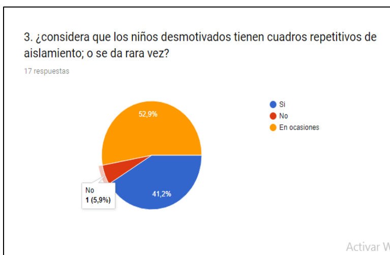
Ilustración 3 ¿considera que los niños desmotivados tienen cuadros repetitivos de aislamiento; o se da rara vez?

Para la cuarta pregunta de los 17 profesores, 12 de ellos coinciden en afirmar que una de las causas principales para la desmotivación en los niños hace referencia a lo social, que es la dificultad para integrarse y adaptarse al aula de clase, y los otros 5 docentes argumentan que el acoso escolar puede ser la razón por la que los niños se desmotivan. En este punto de la encuesta se observa con preocupación que ninguno de los docentes indica que la desmotivación se deba a causas biológicas, por el contrario se evidencia que los