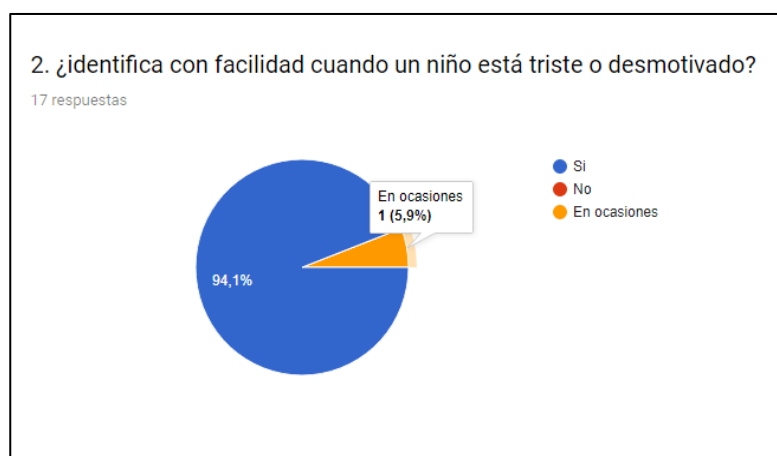
Ilustración 2 ¿identifica con facilidad cuando un niño e stá triste o desmotivado?

En la segunda pregunta por tratarse de profesores especialistas en primera infancia, 16 de ellos dicen reconocer con facilidad si un niño está triste o desmotivado y uno de ellos dice que sólo en ocasiones.