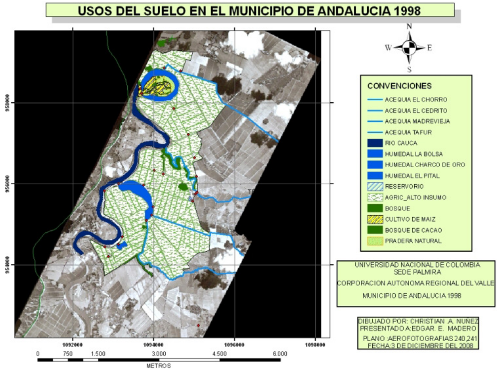
Figura 2. Aerofotografía digitalizada de los usos del suelo de los humedales del municipio de Andalucía (Valle del Cauca), en el año 1998.