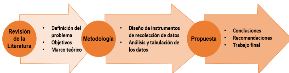
Figura 2 Fases del proyecto de investigación

Este proyecto de investigación se realizó en 3 fases que condensan la propuesta. El método utilizado es el mixto y como lo refiere Hernández (2014) “La meta de la investigación mixta no es reemplazar a la investigación cuantitativa ni a la investigación cualitativa, sino utilizar las fortalezas de ambos tipos de indagación, combinándolas y tratando de minimizar sus debilidades potenciales”. (pág. 532)