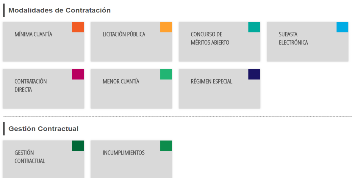
Grafico 3. Guías de las Modalidades de Contratación

Fuente. Adaptado de Colombia Compra Eficiente (SECOP II) (en línea). Disponible en internet