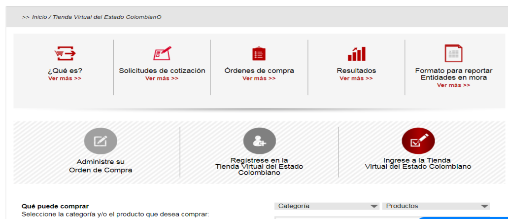
Grafico 11. Ingreso a Tienda Virtual