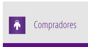
Grafico 2. Ingreso a Compradores

Fuente. Adaptado de Colombia Compra Eficiente (SECOP II) (en línea). Disponible en internet