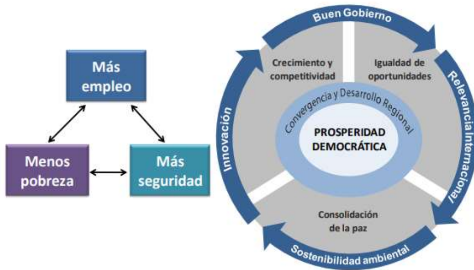
Ilustración 2. Ejes Plan Nacional de Desarrollo