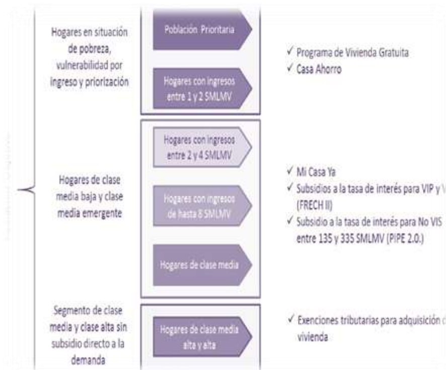
Ilustración 1 Política integran con amplia oferta