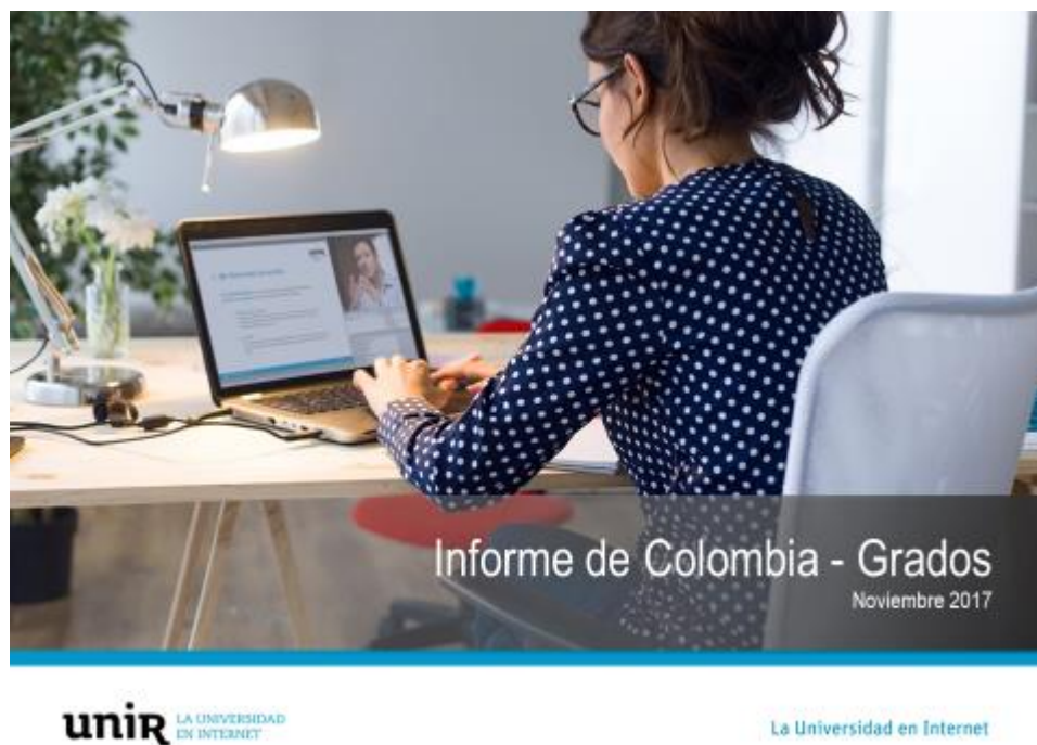
Figura 1. Portada de presentación sobre el informe de grados en Colombia.

Después de terminar satisfactoriamente el segundo ciclo, se comienza el tercer y último ciclo propuesto comenzando desde el 2 de Noviembre hasta el día 12 de diciembre donde se repite el proceso realizado en los dos primeros ciclos pero con unos diplomados solicitados por la UNIR.