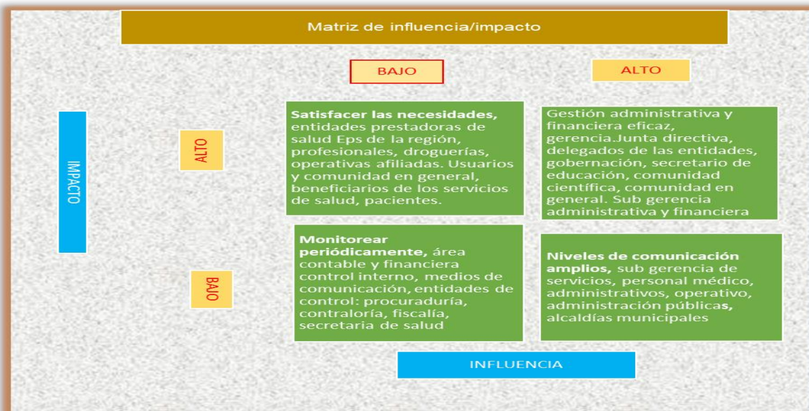
Figura 2. Matriz de Influencias vs Impacto ESE Nuestra Señora de la Paz.

La figura 2 nos muestra la relación influencia/impacto respecto a los Stakeholders de la ESE Nuestra Señora de la Paz, estableciendo una serie de prioridades en la ejecución y control.