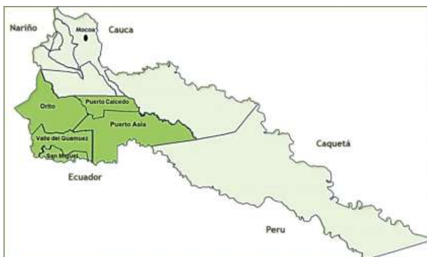
Figura 2: Mapa Municipio Valle del Guamuez