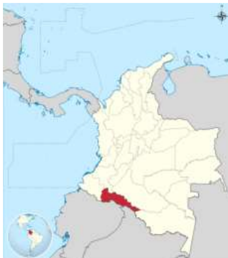
Figura 1: Mapa de Colombia - Departamento de Putumayo