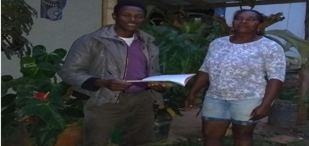
Vereda Ardovelas, 30 – 10 – 2018