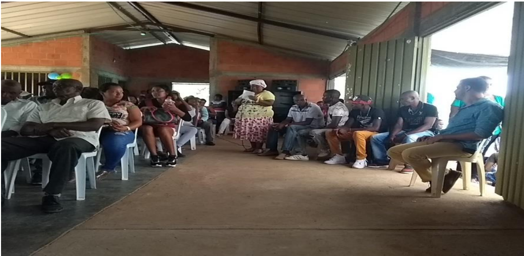
Vereda Ardovelas, 30-12-2018.