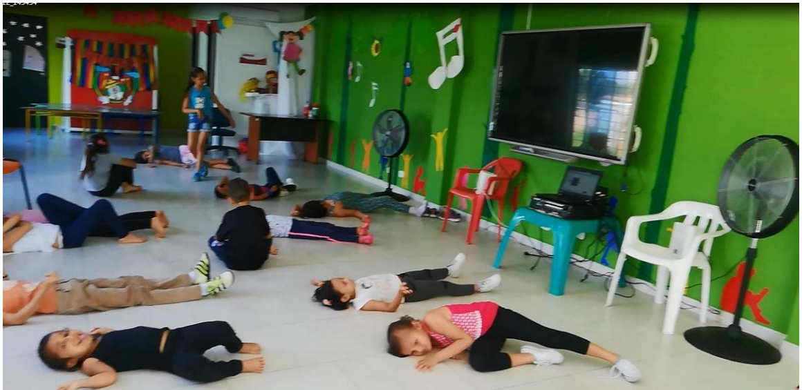
Clase 09/ octubre/2018