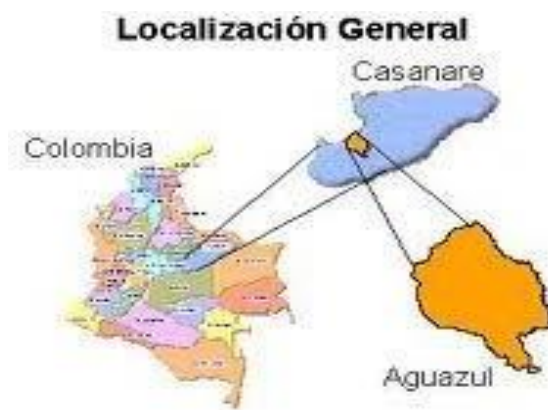
Ilustración 2 Mapa Localización General Aguazul Casanare