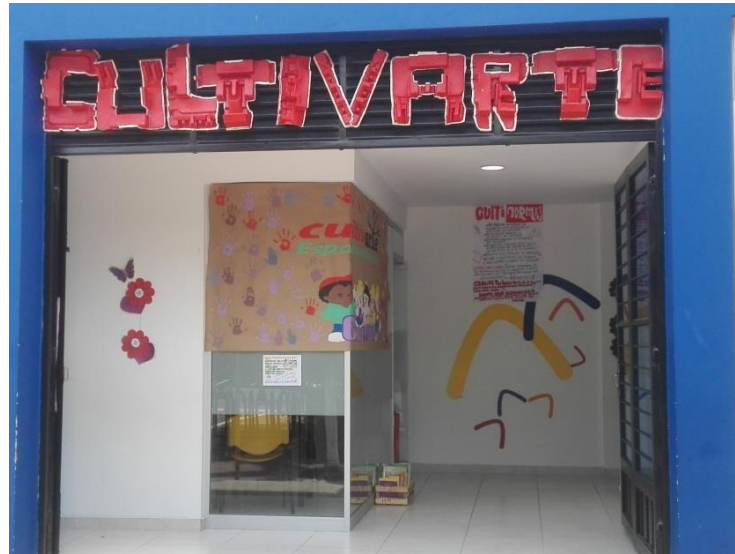
Ilustración 3 Imagen Cultivarte Aguazul