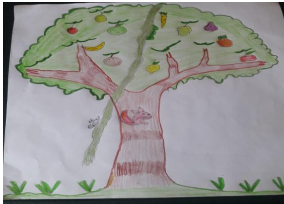
Figura.5. el árbol grande

El diseño de la estrategia pedagógica se centro es la observación de los sitios sagrados para que por medio de ellos los estudiantes se interesen por reconocer el valor y el respeto que tienen cada uno de ellos en la cultura Awá.