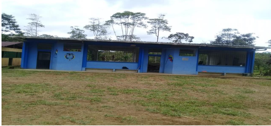
Figura 3. Escuela Pulgande campo alegre