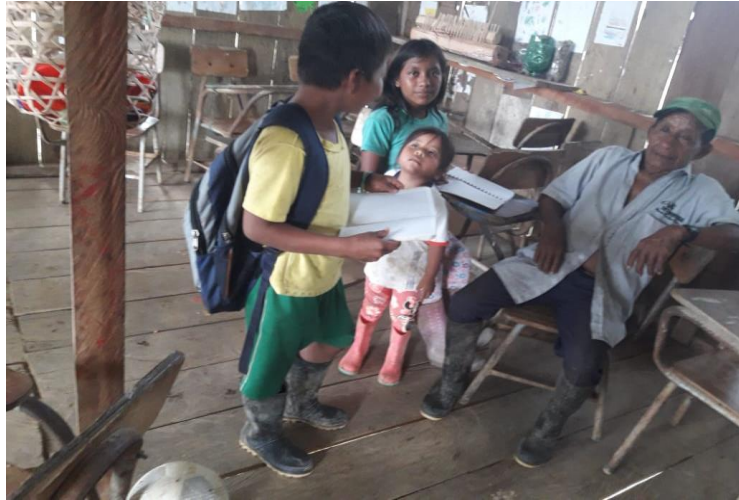
Figura. 4. Entrevista al mayor de la comunidad Pulgande campo alegre