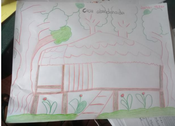
Figura. 7. Casa botada viven los espíritus