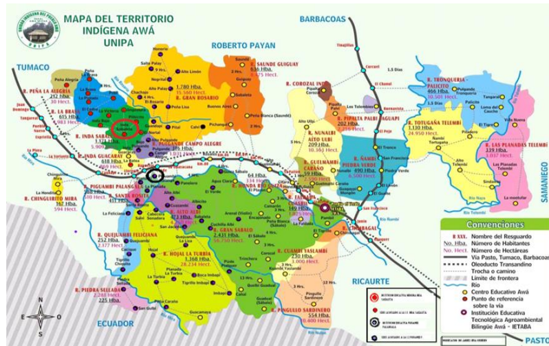
Figura. 1. Mapa del pueblo Awá Unipa