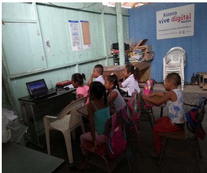
Figura 5. Estudiantes desarrollando actividades académicas