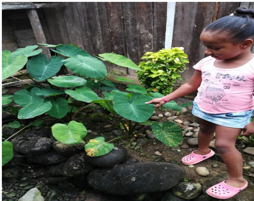
Figura 7. Salida de campo