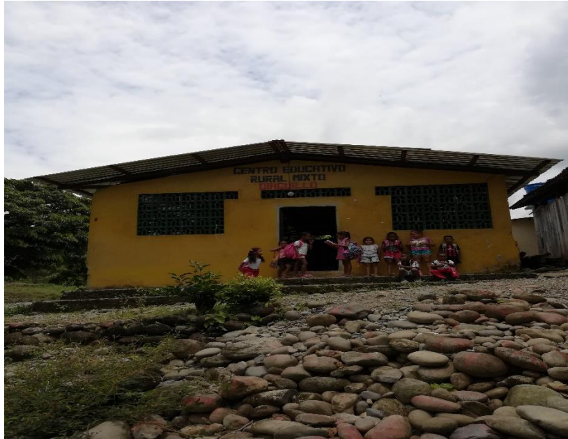
Figura 2: Centro educativo Diaguillo

el grado preescolar hasta el quinto grado los cuales tienen la posibilidad de continuar sus estudios en la sede N.1 en la cual funciona bachillerato con sus grados sexto, séptimo y octavo.