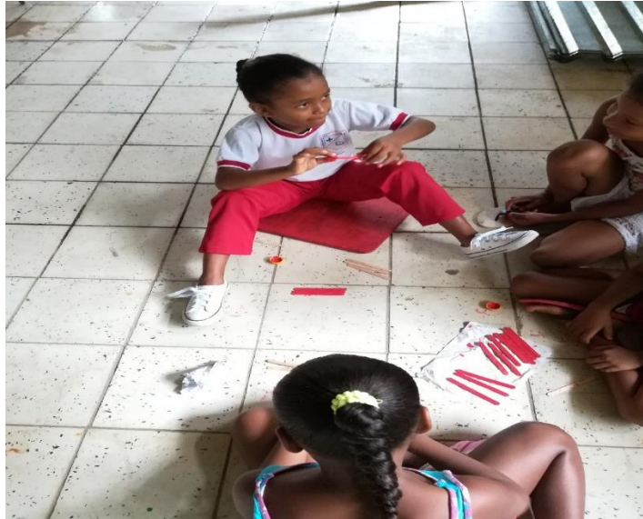
Figura 6. trabajo académico

desprenden las siguientes evidencias de aprendizaje Clasificación de materiales según su tamaño, Materiales sólidos, Materiales líquidos, Propiedades de materiales líquidos y sólidos y Uso de materiales (roca, madera, goma.)