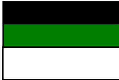
Figura 3: Bandera del centro educativo Diaguillo