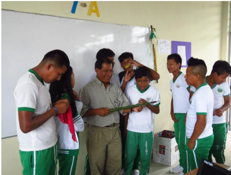
Imagen 4. Práctica con los estudiantes. Archivo fotográfico de los autores. 2019.

Otro proceso significativo que se dio durante la práctica del tejido de saber de la conservación de biodiversidad se denominó caminar por las huellas de conocimientos y saberes mediante la comunicación a través de la oralidad. En este orden ideológico de gobernanza en educación es enseñar y aprender convivir a partir de los principios de Unidad, Cultura, Territorio y Autonomía, para el control territorial y social.