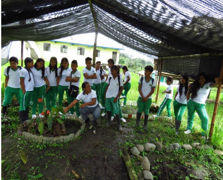
Imagen 3. Jardín Pedagógico. 2019