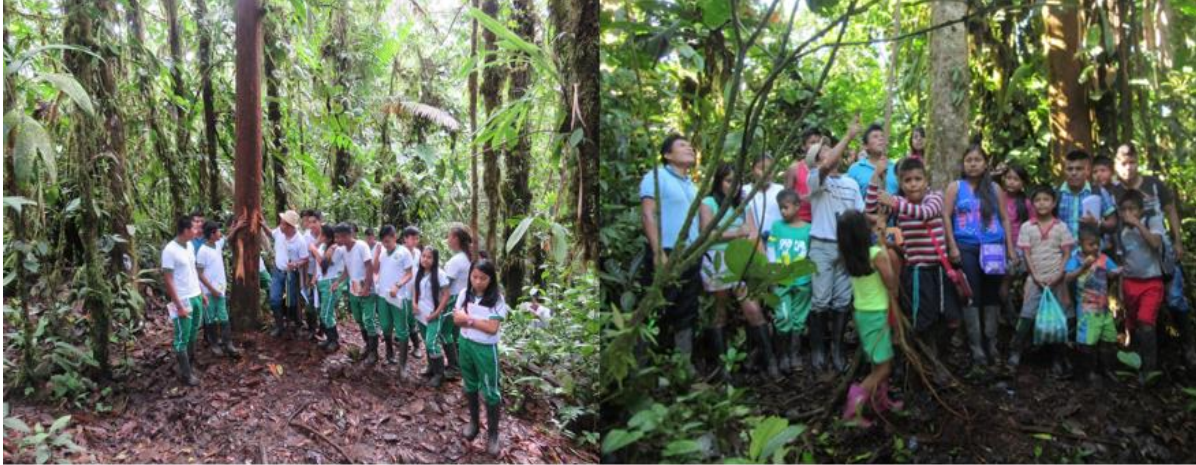
Figura 5. Recorridos en la Reserva la Nutria “PIMAN”. 2016