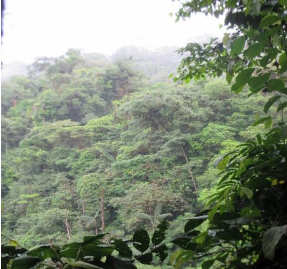
Territorio. 2017