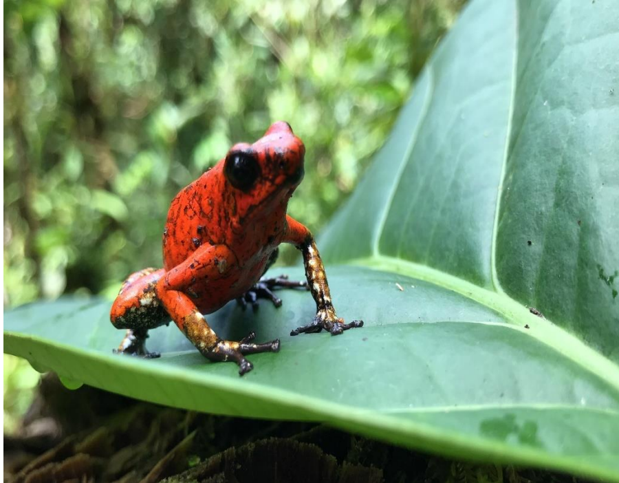
Anfibio. Rana kiki. 2019