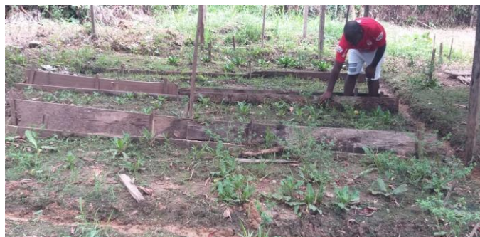
Figura 3: Proceso de siembra plantas medicinales