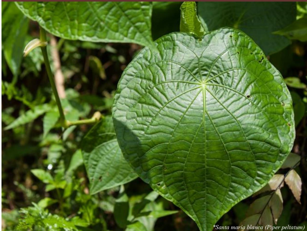
*Santa maría blanca (Piper peltatum)