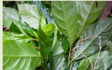
Anamú (Petiveria alliacea)

Los curanderos usan las plantas contra las enfermedades naturales que afectan al cuerpo y también las que son adquiridas por embrujamientos y maleficios. Su deber es emplear las yerbas para deshacer rezos y hechizos, pero si alguno las usa para invocar la maldad es considerado un brujo. Cuando alguien ha sido embrujado, normalmente fracasa en todo lo que hace. Acude al curandero para conjurar el maleficio con baños de escobilla y membrillo macho, y para saber quién es el culpable de sus desgracias. Al responsable se le puede ver en una batea con agua de hojas de matimbá ( Annona purpurea ).