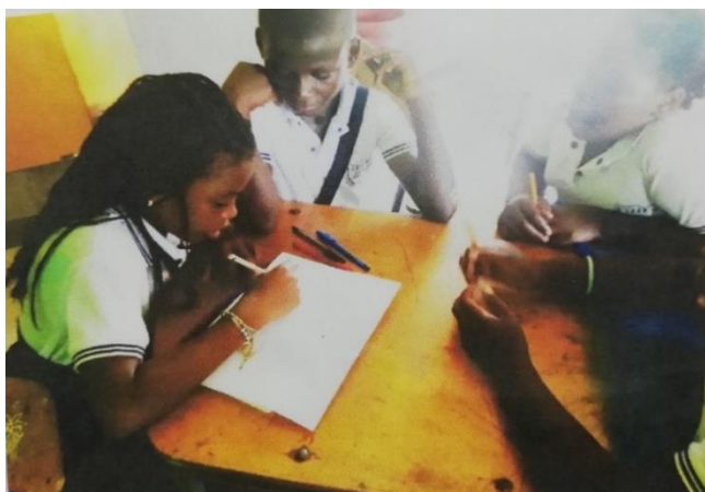
Figura 2: Estudiantes en taller, previo a salida de campo

Para el tercer objetivo específico se propuso generar un repositorio de plantas medicinales para la institución en la cual se desarrollo el estudio investigativo, se presentan a continuación, algunos ejercicios realizados durante ese proceso, que develan la participación constante de los estudiantes, comunidad y etnoeducadores en el rescate de la medicina tradicional y los saberes populares.