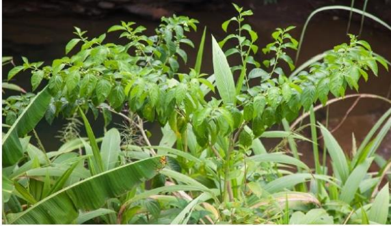
Sauco (Solanum incompitum)