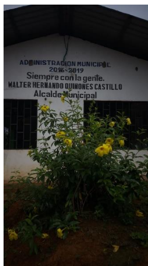
Figura 4: Repositorio de plantas medicinales