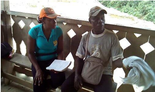
Figura 3. entrevistando a un mayor.