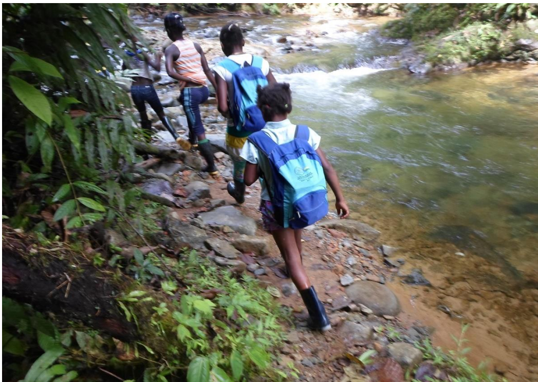
Imagen de salida pedagógica.