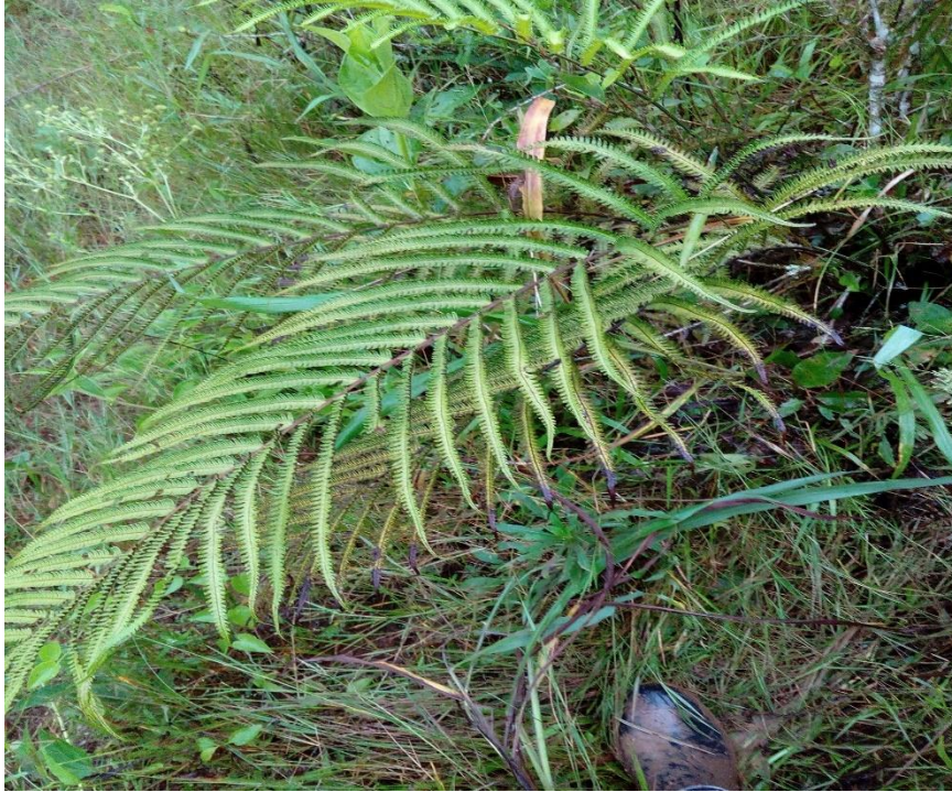
Planta: hierba de hojo.