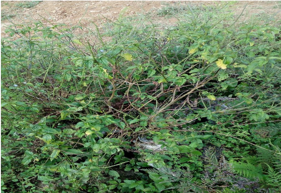
Planta de vervena negra.