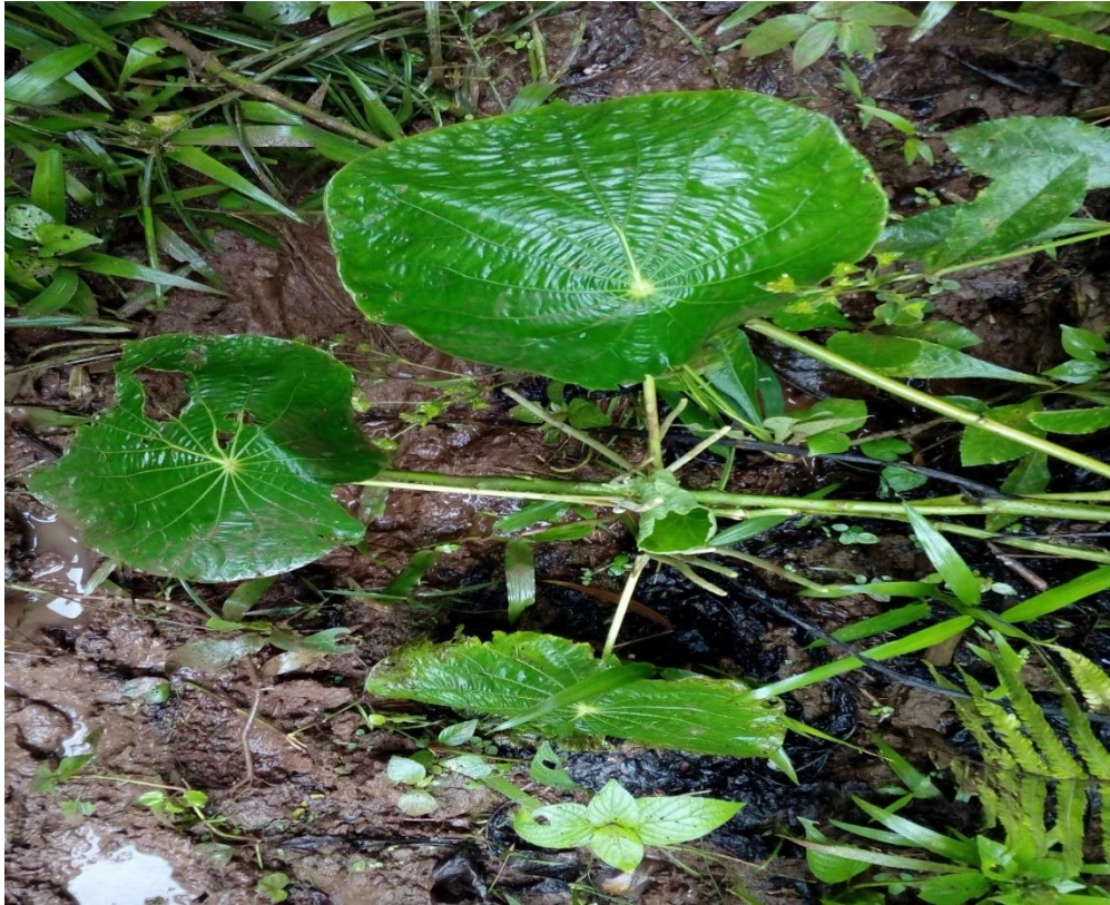
Planta Santa María