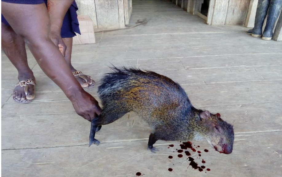
Animal Guatín.