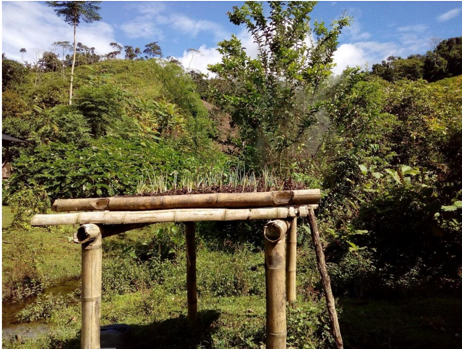
Fotografía de azotea de cebolla nativa.