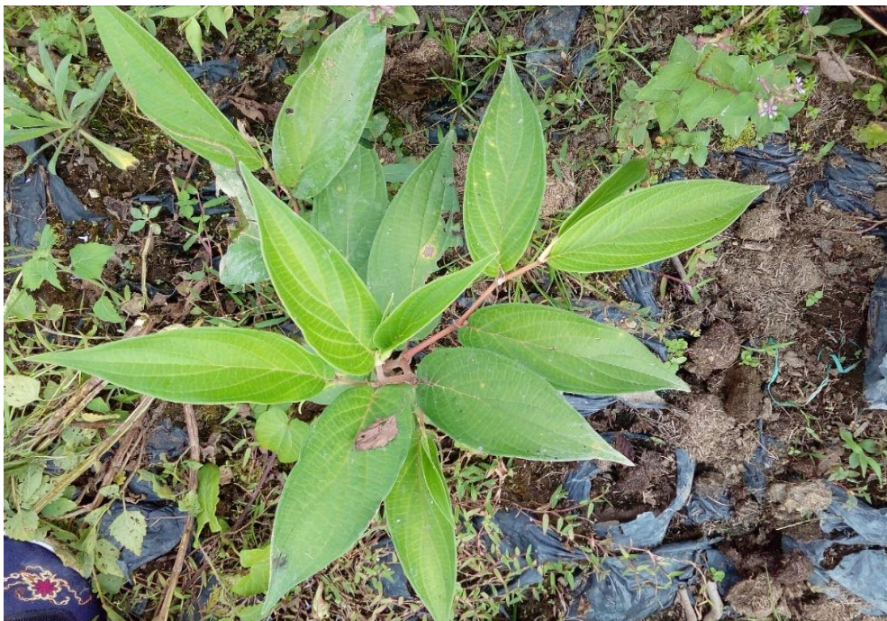
Planta de cordoncillo rojo