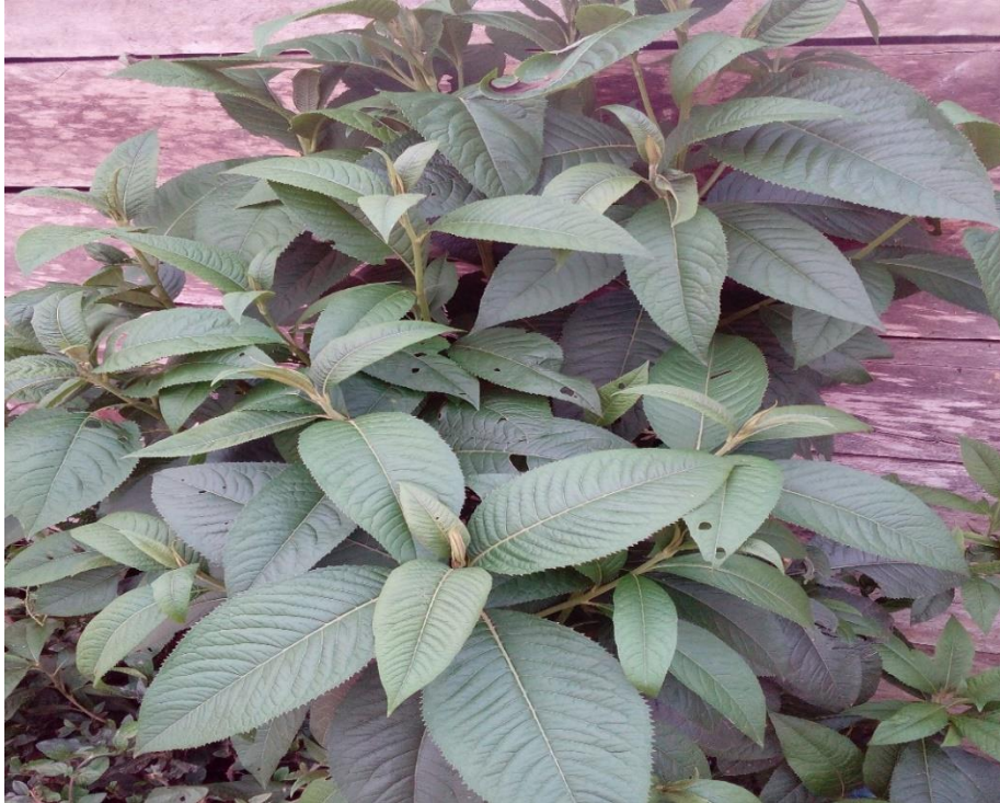
Planta de yasmande