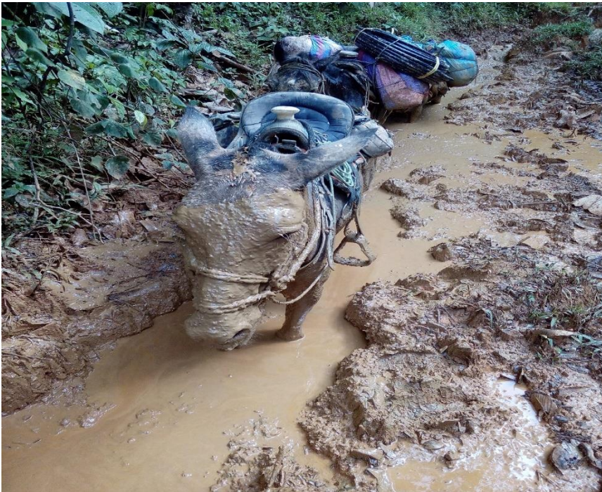
Transporte mular.