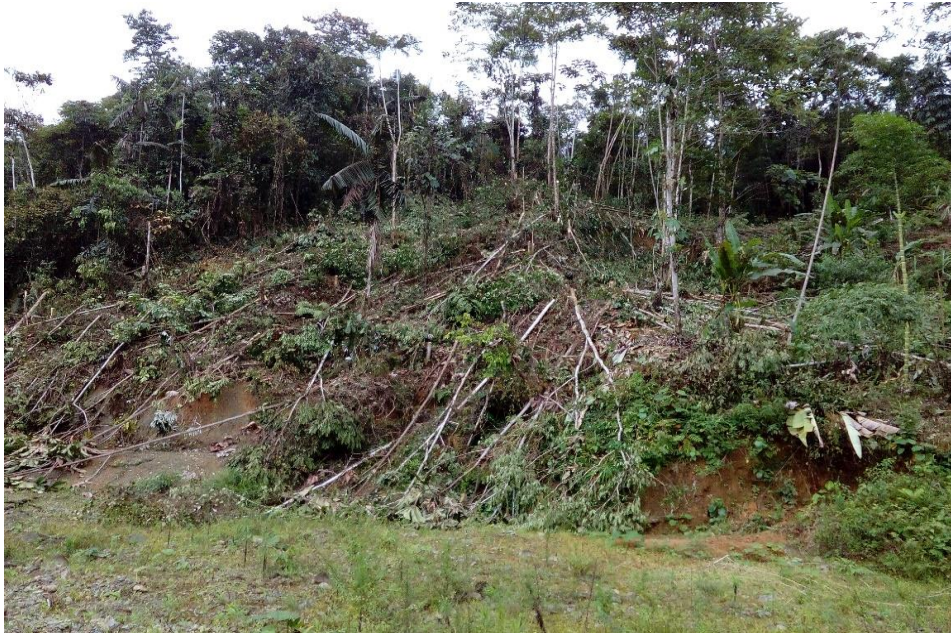
Imagen de la deforestación.