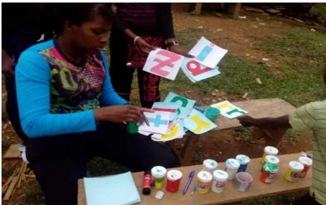
Figura 7. Construyendo el minidiccionario