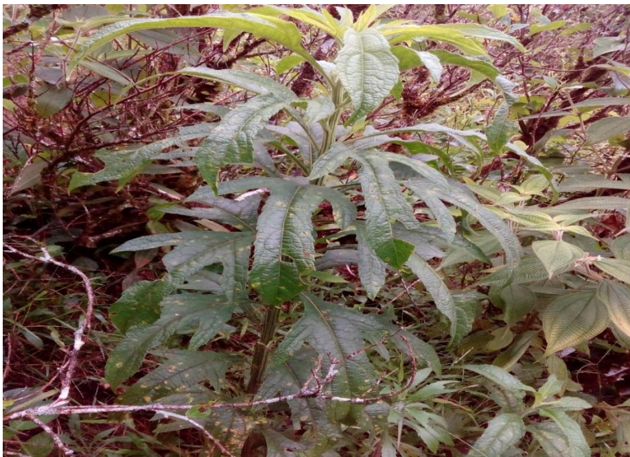
Planta tres dedos o gavilana