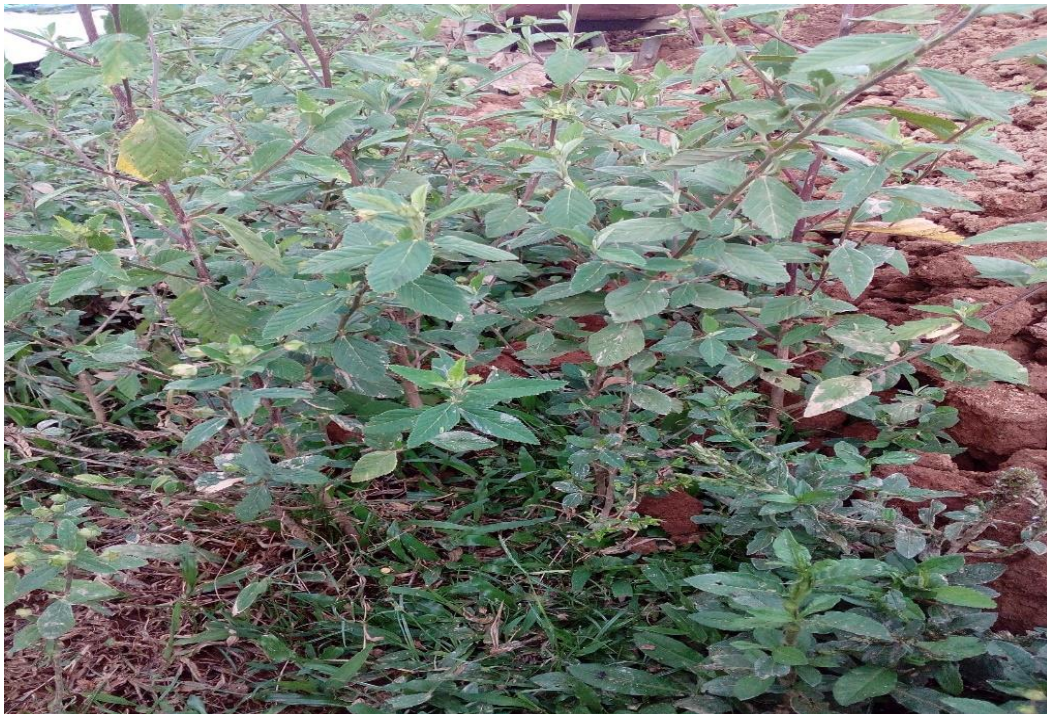
Planta Zuelda con zuelda