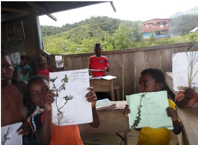
Figura 1. Estudiantes en exposiciones

La estrategia a implementar es una exposición de las plantas medicinales a través del conocimiento de los mayores sabedores.