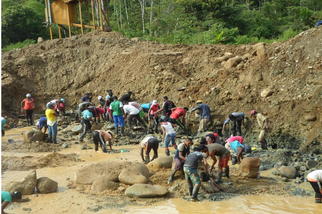
Dstrucción del entorno con la minería.