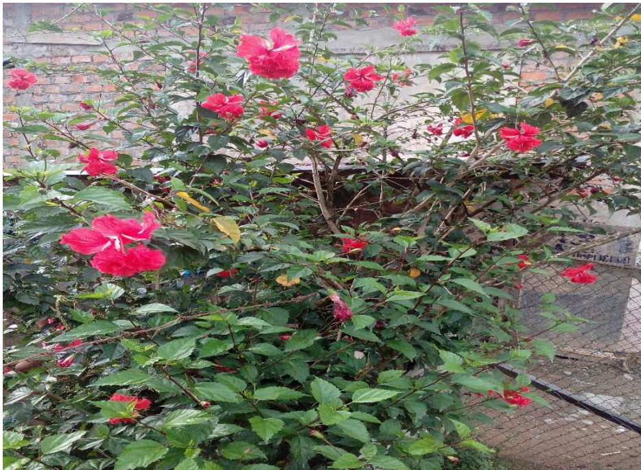
Planta: Malva rosa.