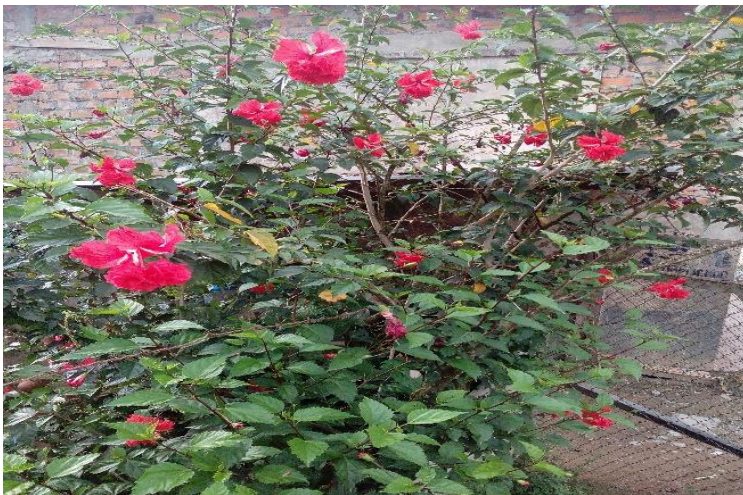
Figura 6. Plantas de pradera