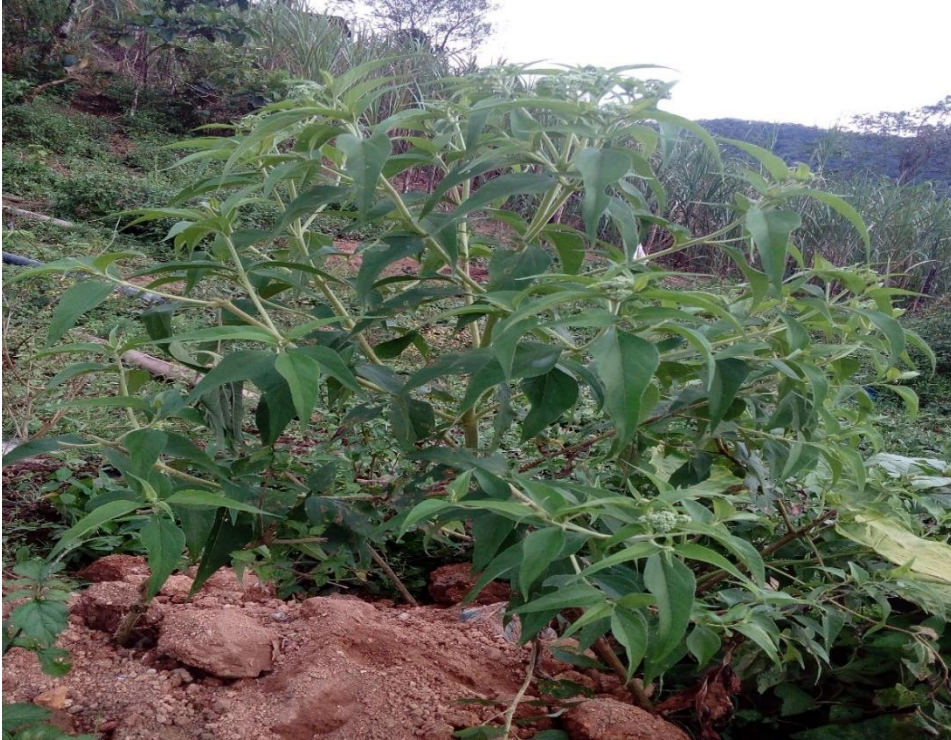
Planta de salvia