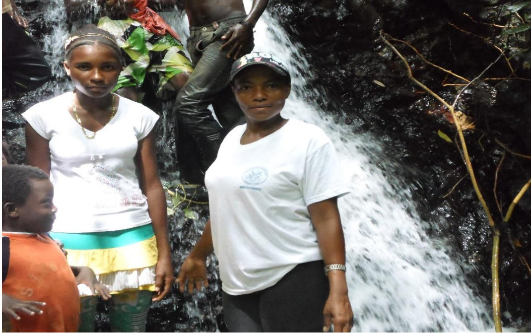
Explorando las plantas del medio acuático.