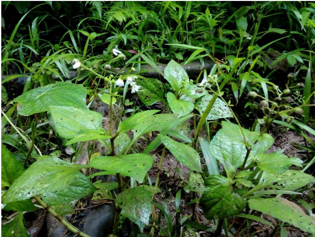
Planta Doña Juana