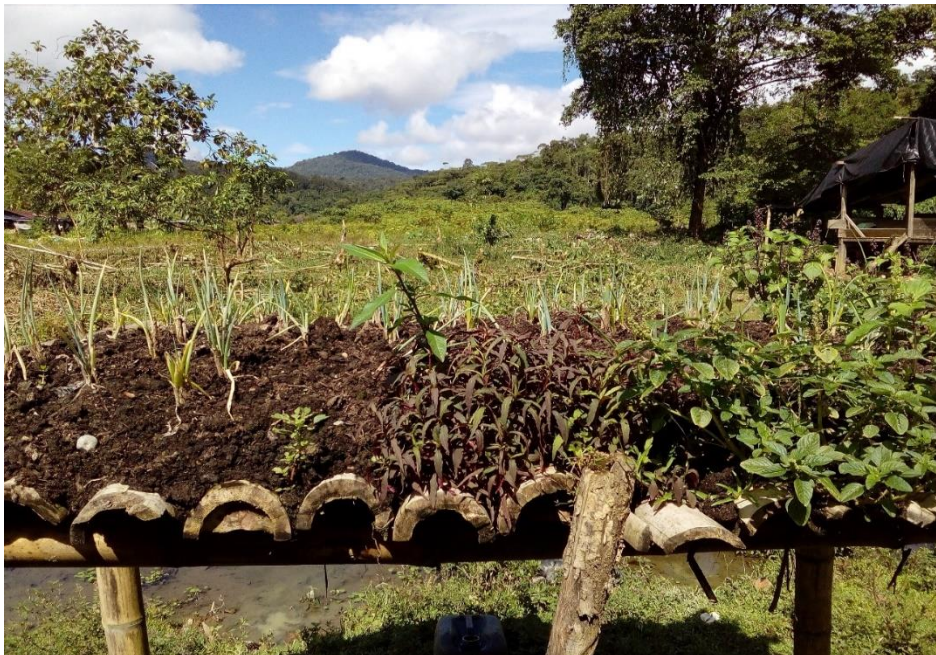
Plantas medicinales en una azotea construida a base de guaduas.