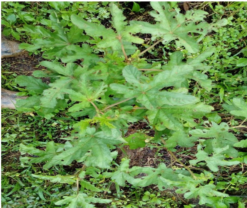
Planta de malva