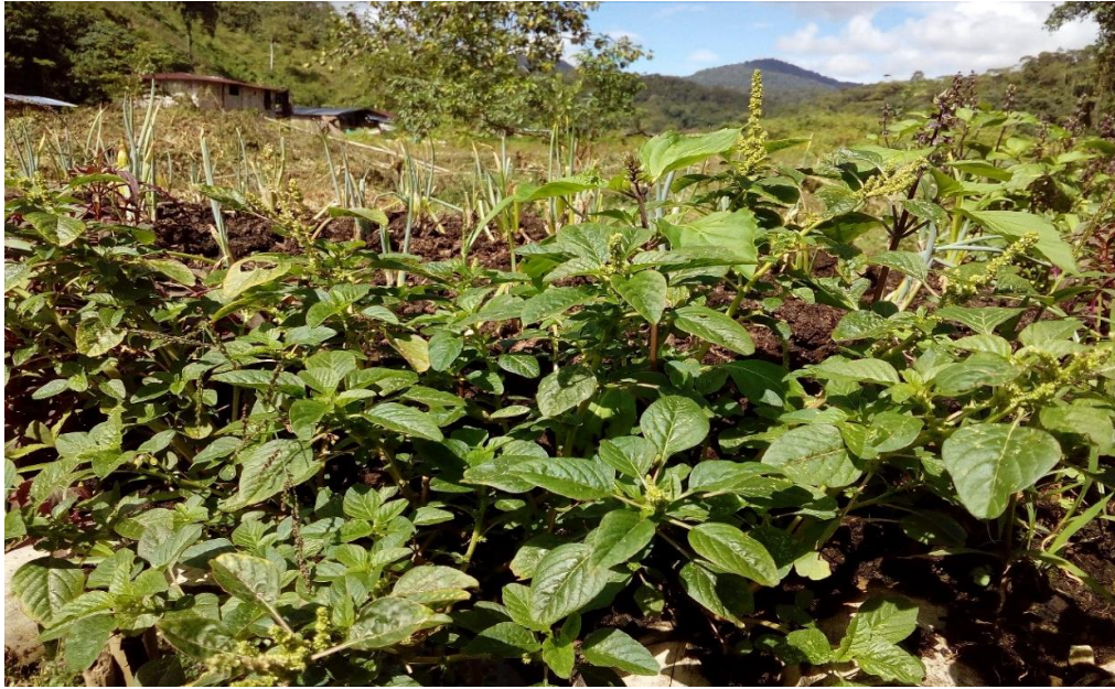
Planta hierba buena.