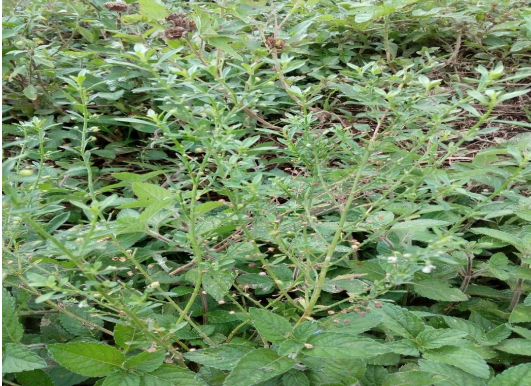
Planta de pichanga dulce.