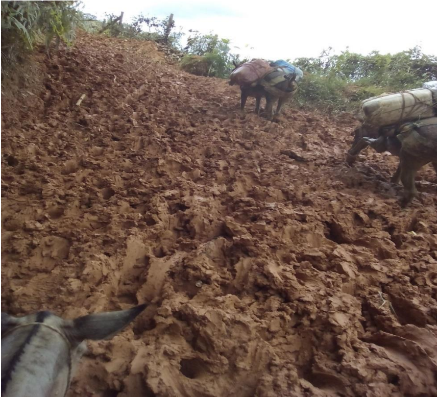
Medio de transporte mular.