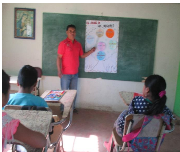
Figura 16. Mejoramiento en el comportamiento de los estudiantes

Dentro del presente proyecto se tuvo en cuenta el impacto que generar la inclusión de valores en los niños y niñas del centro educativo San Martín al implementar la estrategia didáctica como resultado se obtuvo que los estudiantes mejoraron en su comportamiento, manejo de vocabulario, le dieron la debida importancia a los valores de la identidad, interculturalidad, tolerancia, justicia, aprendieron a respetar a sus mayores, a la madre tierra y así mismos como se evidencia en la siguiente fotografía: