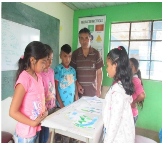
Figura 5. Cartelera y dibujen los recursos naturales

Los niños y niñas manifiestan que no quieren que se talen los bosques que se siembren árboles en las cuencas hidrográficas, que no se contamine el agua con basuras.