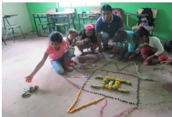
Figura 4. Sol de los Pastos y valores

Después se realizó con material del medio el sol de los pastos en el centro del salón, todos contribuyeron en el relleno de este símbolo en donde se les dio a conocer cada una de las épocas del resguardo del gran Cumbal y la conformación de sus nueve veredas, además se les enseñó en significado de cada punta del sol de los pastos, haciendo énfasis en los valores de la rectitud, justicia, respecto, honestidad, gobernabilidad e interculturalidad como se muestra en la siguiente fotografía: