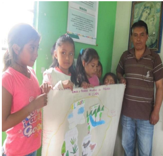
Figura 12. Cartelera los recursos naturales

Después para reforzar lo aprendido se les solicito a los niños y niñas que realicen una cartelera de los recursos naturales más recuerden. Al momento de la presentación de la cartelera cada niño y niña expreso sus puntos de vista sobre los recursos naturales que son los que permiten vivir, alimentarse, generan ingresos por lo que se los deben de cuidar, no maltratar para que se conserven con tolerancia porque algunos de ellos han desaparecido y otros están en vía de extinción, como se evidencia en la fotografía: