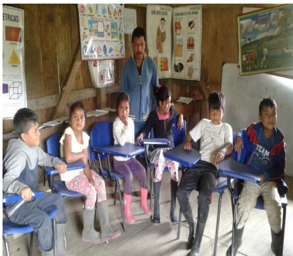
Figura 15. Enseñando valores de convivencia

Fue así que los niños y niñas del centro educativo San Martín construyeron sus propios saberes con la actividad, aprendieron los valores de convivencia intercultural ya que ellos cuentan con la capacidad de dar afecto y recibirlo con lo práctico para poder salir de la oscuridad como lo afirma Zubiría Samper: