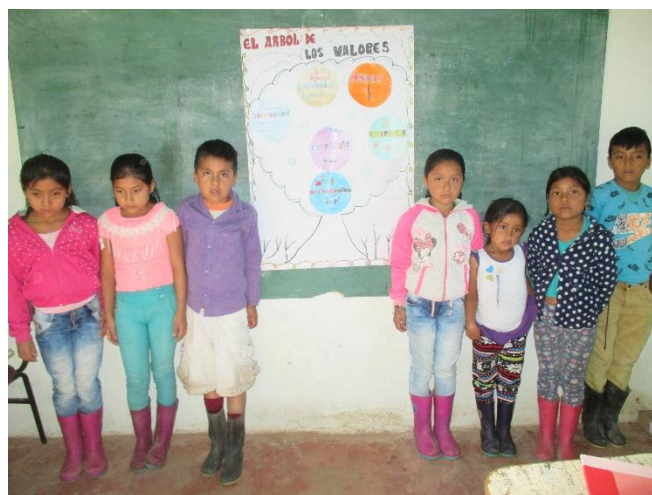
Figura 18. Cartelera de los valores

Para una mejor implementación de la estrategia didáctica se realizaron unas actividades con los niños y niñas de primero a quinto de primaria en el centro educativo San Martín como elaboración de carteleras acerca de los valores en donde cada niño y niña pego uno de los valores, la decoro con materiales del medio como hojas secas, flores y semillas de algunas plantas, además le dio la debida explicación e interpretación para enriquecer su formación delante de sus compañeros como se evidencia en la fotografía: