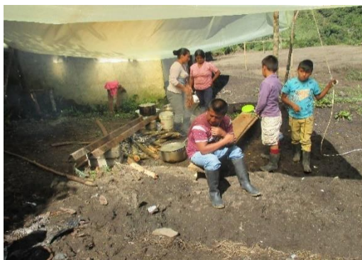
Figura 8. Minga de pensamiento

Para el día 11 de abril del presente año se reunió la comunidad estudiantil padres de familia, niños y niñas a las 10:00 a.m. con la asistencia de nueve estudiantes y ocho padres de familia se dio inicio con un saludo de bienvenida a todas las personas presentes, luego el docente explico la actividad que se va a desarrollar en este día. Como se evidencia en la fotografía: