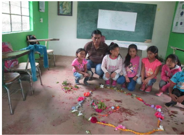
Figura 11. Croquis del resguardo de Cumbal

Entonces a los niños y niñas del centro educativo San Martín se les enseñó los valores con el desarrollo de temas que están articulados con la memoria ancestral en la que fue necesario dar a conocer a los estudiantes el territorio del resguardo indígena de Cumbal en donde ellos participaron en la elaboración del croquis de este, con material de medio, aprendieron a ubicar los límites, respetar, valorar esta parte de la madre tierra en la que viven, como se indica en la fotografía: