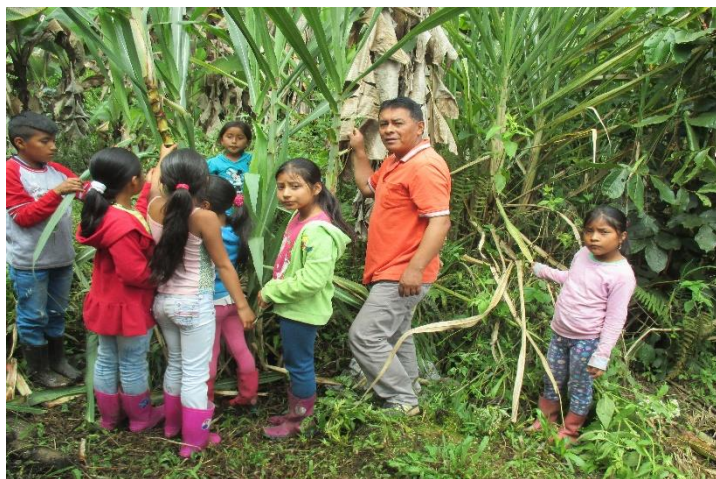
Figura 17. Recorriendo los sectores de la vereda

Por medio de la recuperación de los valores de la convivencia intercultural a partir de la memoria ancestral se hace un recorrido como se evidencia en la fotografía: