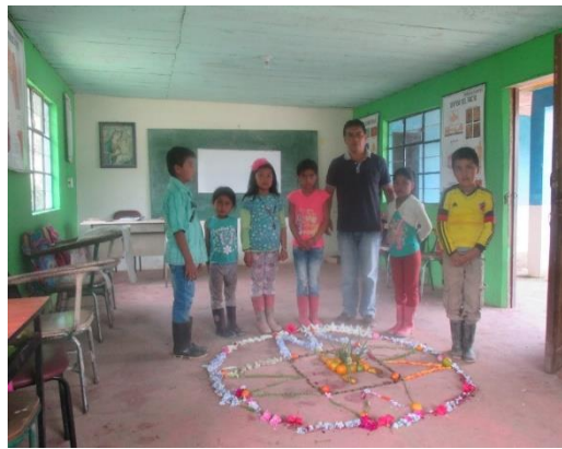
Figura 10. Valores de convivencia intercultural

Es así que con la actividad que se realizó se fomentó los valores de convivencia intercultural en los estudiantes a partir de la memoria ancestral con la realización del sol de los pastos en el centro del salón. como se puede evidenciar en la fotografía que se indica a continuación: