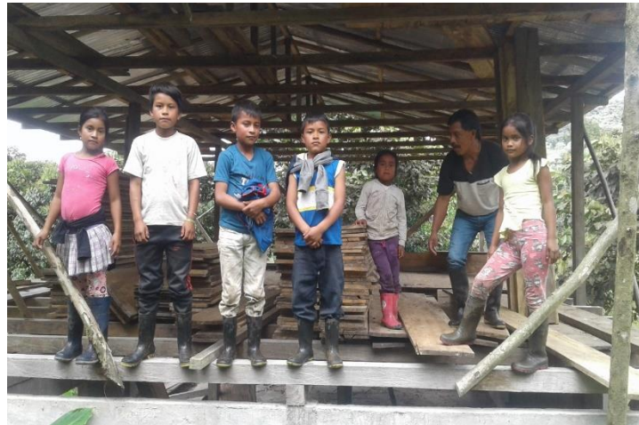
Figura 19. Salida de campo

Con esta salida los niños y niñas aprendieron nombres de los ríos más cercanos, conocieron el relieve, valoraron la madre naturaleza, al final del recorrido se hizo una minga de pensamiento para motivar a los estudiantes en valores de convivencia intercultural a partir de la memoria ancestral que esta inversa en cada una de las partes, sitios sagrados, mayores de la vereda de San Martín que tienen saberes, secretos y recuerdos. Como se muestra en la fotografía: