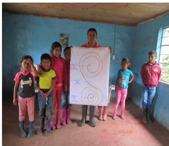
Figura 7. Churo cósmico

Los niños y niñas hicieron la cartelera en la que plasmaron el churo cósmico, con sus respectivas divisiones y significados, lo entendieron mejor, adquirieron conocimientos y valoraron su identidad cultural como se evidencia en la fotografía: