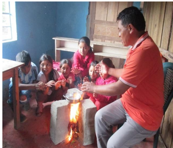
Figura 14. Taller tejiendo pensamientos

Se les dio a conocer estos saberes a los estudiantes para que se comprometían con estos eventos de la identidad cultural del resguardo indígena del gran Cumbal en la que pueden participar presentándose con sus tradiciones como danzas, tejidos, simbología, productos platos típicos de su vereda que hacen parte de la memoria ancestral. Todos los niños y niñas alrededor del fogón contaron a cerca de estas fiestas sagradas, de las costumbres, valores y principios de su comunidad que se realizan cada año como se evidencia en la fotografía: