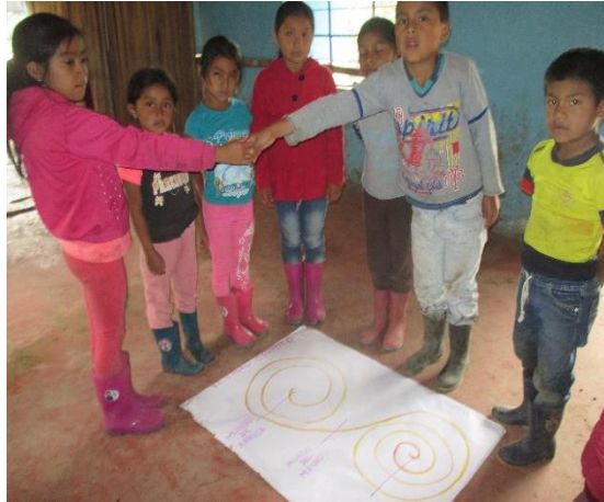
Figura 13. Churo cósmico parte de la memoria ancestral

Después en una cartelera los niños y niñas con la ayuda del docente hicieron el churo cósmico, con sus respectivas divisiones, significados, lo entendieron mejor, adquirieron conocimientos y valoraron su identidad cultural como se evidencia en la fotografía: