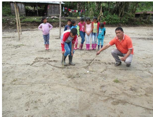
Figura 2. Conociendo mi vereda San Martín

Para el desarrollo de este objetivo se inició con una salida a la cancha deportiva del centro educativo en donde se conversó con los estudiantes haciendo énfasis al lugar dónde viven la vereda de San Martín, con el fin de atraer su atención se cantó con ellos sol solecito, se encuentro que los niños y niñas les hacía falta el valor del respeto, la identidad cultural e interculturalidad por lo cual se dibujó el mapa de su territorio de la vereda San Martín en la arena como se muestra en la fotografía: