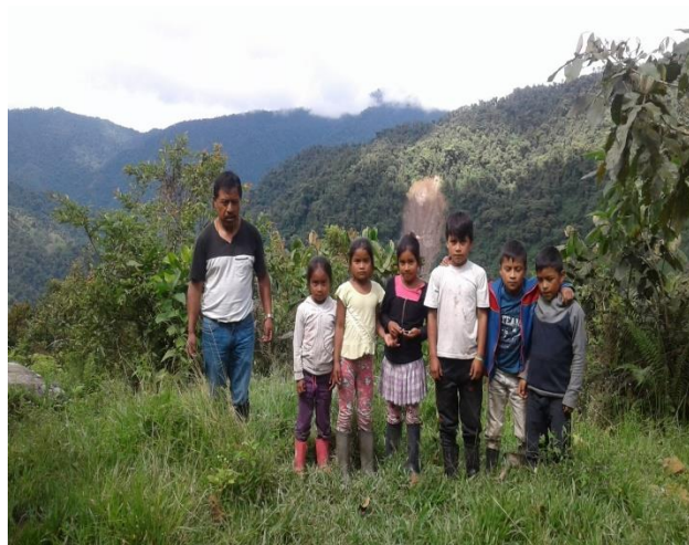
Figura 3. Recorriendo mi territorio

En este sentido el deber del docente en este proceso de aprendizaje fue de acompañar a los estudiantes en estos recorridos que enriquecieron sus conocimientos.