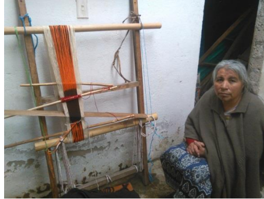
Figura 2. Narración de conocimientos propios de una mayora del resguardo de Guachucal

En el contexto del tejido y su saber ancestral se pretende recoger toda la información que permita que el estudiante asimile los conocimientos occidentales con los propios de manera que las áreas del conocimiento sea dictadas a través de la educación propia con otro método más didáctico y menos habitual que el que se dicta en la actualidad.