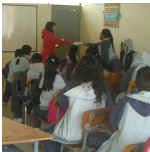
Figura 8. Taller de reflexión