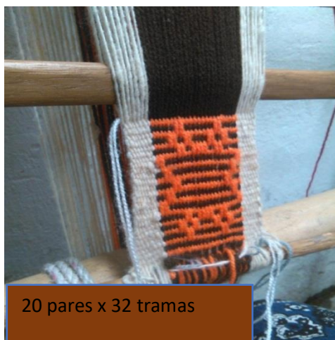
Figura 5. Tejido en Guanga

Nos informan que la guanga ha sido parte de la educación de las tejedoras ya que las tejedoras no fueron a la escuela pero saben contar, sumar restar, dividir, mediante el tejiendo aprendieron las matemáticas y que para realizar el proceso de diseño son ellas quienes lo realizan o diseñan el dibujo o símbolo a crear con lana, nos explican que se debe contar las hebras por pares los que van a formar parte del símbolo, si es necesario aumentar o restar y en caso dividir depende el diseño a realizar de esta manera se evidencia que para lograr obtener una estrategia para enseñar matemáticas y diseño se necesita comenzar a tejer y tener claro lo que se va a realizar.