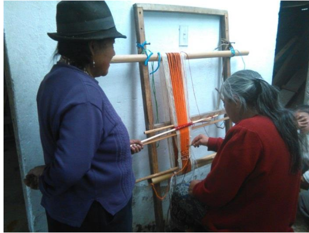
Figura 3. Plasmar en el tejido la simbología sagrada de los pastos

Después de haber recibido estos importantes conocimientos que concibe el tejido en guanga se pretende llevarlos a el aula de clases y construir un aprendizaje basado en conocimientos propios donde el uno resignifica a el otro, se logra crear la estrategia didáctica donde los estudiantes por medio del tejido ancestral y el instrumento la guanga recibirán y aprenderán sobre los conocimientos propios transversalisadas a las áreas del conocimiento que se dictan en la actualidad de esta manera podemos decir que los estudiantes aprenderán tejiendo el área de matemática, lenguaje, sociales, naturales dibujo, ética, artística, religión.