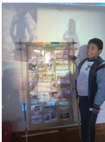
Figura 7. Tejido el saber