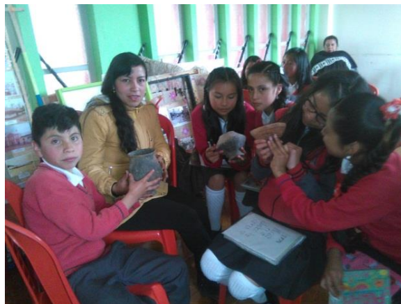
Figura 9. Estudiantes identificando piezas de la cultura pasto

Se realiza la introducción y rescate de piezas en barro que son parte de la identidad cultural de la etnia de los pastos para que los estudiantes reconozcan el significado de piezas sagradas de la cultura pasto que nos llevan a reafirmar la identidad de la cultura indígena en el territorio las piezas presentadas fueron llevadas por los estudiantes en una actividad de investigación y reconocimiento del contexto cultural del resguardo de Guachucal.