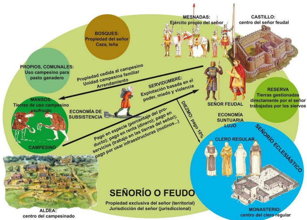
Figura. 2 Estructura del feudo

como parece ser. A grandes rasgos este proceso radica en el hecho de la caída del Imperio Romano, cuando las tierras baldías quedan desoladas produciendo un proteccionismo militar por parte de señores que se hacen con los espacios, de esta forma empieza poco a poco a producirse un estilo de vida económico alejado de la esclavitud convencional para darle paso a un sistema de tierras con libertades de trabajo limitadas ((Heather, 2009, p. 76). No obstante, a nivel académico esta explicación parecería compleja o un elemento más del tradicionalismo en el aula, sin embargo, tomando la idea de la línea del tiempo, se puede mencionar el porqué en el 476 D.C, se da un espacio de transformación, o por qué desde el punto de vista económico hay un cambio de época, es decir de la Antigüedad a la Edad Media. Tomando en consideración lo anterior, hay que intentar, a parte de la línea del tiempo, utilizar esquemas (figura.2) que permitan la adecuada comprensión del estudiante frente a este proceso, entendiendo los vínculos como algo esencial, a lo que se quiere llegar es a que el estudiante comprenda que desde el espacio rural medieval se pueden comprender las estructuras actuales frente al espacio y las necesidades sociales de poder-apoderado (Tournai, 2017, p. 36).