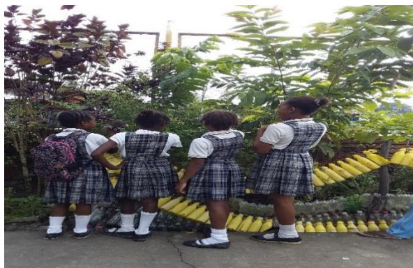
Figura 2. Estudiantes grado tercero, medicina tradicional

Descripción: La actividad consiste en identificar a las personas que aun practican la medicina tradicional en nuestro territorio.