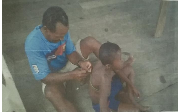
Figura 4. Medico tradicional

EVALUACION: -En esta primera actividad se utilizó como mecanismo la investigación, para saber cuáles tipos de médicos tenemos en la comunidad y así saber que enfermedades tratan. -Para desarrollar la segunda actividad se hizo la evaluación escrita para que los estudiantes tengan registro del tema.