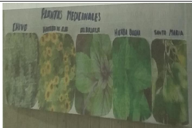
Figura 3. Plantas medicinales

- esta segunda actividad se utilizó como mecanismo de evaluación la investigación participativa para que los estudiantes investiguen a nuestros mayores sobre las plantas medicinales, para que sirven y como se usan.