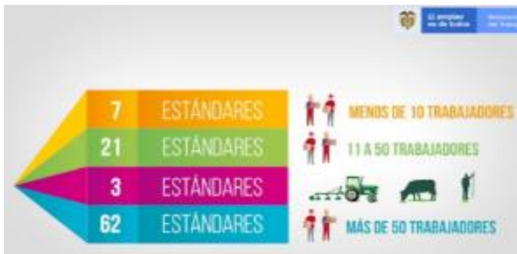
Figura 2 Estándares Mínimos de acuerdo al tamaño de la empresa